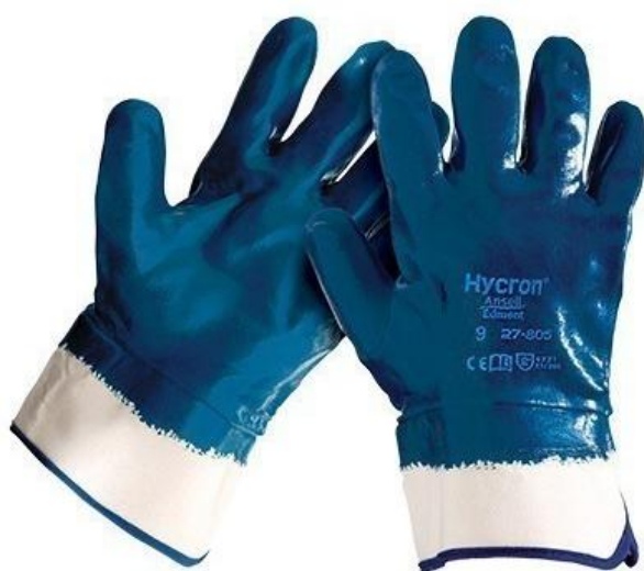
Slika 14. Hycron rukaviceon rukavica [16]

grubom drvenom građom, gredama te šperpločama. Zaštitni premaz otporan je na masnoću, nečistoću, ulja i tekućine. Ugodna je za nošenje, otporna na trganje i habanje. Ova rukavica sadrži fungicide i bakteriostatike odnosno sredstva koja usporavaju i zaustavljaju razvoj i rast mikroorganizama sprječavanjem djelovanja enzima bitnih za njihov metabolizam kako bi se spriječila iritacija kože. Dizajnirane su da omoguće veću slobodu i pokretljivost prstiju. [3] Hycron rukavica je izrađena od pamuka te je kompletno umočena u nitril.