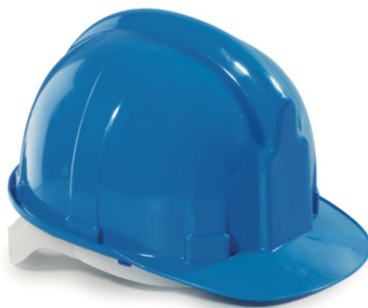
Slika 3. Industrijska zaštitna kaciga [7]

Kalup industrijske zaštitne kacige napravljen je od čvrstog i glatkog materijala najčešće polietilena ili polikarbonata, koji industrijskoj kacigi daje željeni oblik i čvrstoću, ali također pruža toplinsku i električnu zaštitu (slika 3.). Industrijske zaštitne kacige su također izrađene od materijala koji su otporni su na agresivne kemikalije. Izrađuju se i od staklenih vlakana, jer su ona dobri izolatori topline i otporna su na niske temperature, ali staklena vlakna pokazala su loša svojstva, a to su oštećenja kacige s unutarnje strane što dovodi do osipavanje vlakana na glavu radnika, što može dovesti do alergije kože.