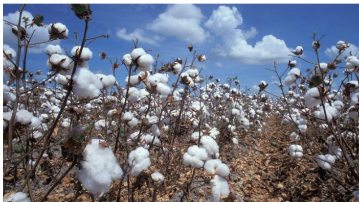
Slika 19. Pamuk [20]

Pamuk je prirodno vlakno, mekan je materijal koji odlično upija te također ima dobra izolacijska svojstva, ugodan je na dodir i nošenje (slika 19.). Na kvalitetu tkanine utječe način tkanja te razne obrade. Pamuk se u većini slučajeva miješa s drugim sirovinama kojima dobije bolju dodatnu kvalitetu. Često se koristi u kombinacijama sa sintetičkim materijalima ili elastinom. Mješavine sa poliesterom se manje gužvaju, elastin dodaje elastičnost materijalu. Karakteristike odjeće izrađene od pamuka su mekoća, savitljivosti, čvrstoća, dobra upijanja i prozračnost.