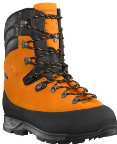
Slika 16. Visoke zaštitne cipeletitne cipele [17]

obuća nema bočnih šavova, rub potplata je izdržljiv dok su predjeli pete i prstiju dodatno ojačani s gumom za dužu postojanost obuće.