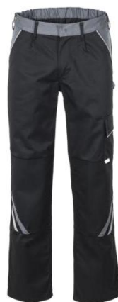
Slika 18. Zaštitna jakna [19]