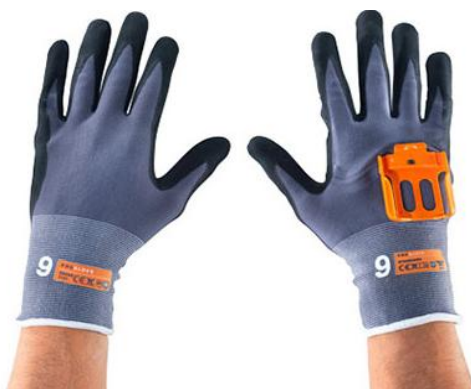
Slika 21. Pametne rukavice sa skenerom [23]

Pametna rukavica sadrži integrirani skener odnosno čitač koda koji služi za brže i učinkovitije logističke te druge proizvodne procese (slika 21.). Svaki se skener pričvršćuje na gornji dio rukavice dok je u upotrebi i odvaja se za ponovno punjenje s trajanjem baterije od 10+ sati. [26] Ovakva pametna rukavica radnicima omogućuje skeniranje bez napora dok su im ruke slobodne. To pojednostavljuje procese, smanjuje pogreške i dovodi do veće ergonomije rada.