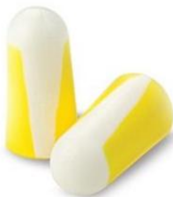
Slika 7. Zaštitni čepovi Bilson 303 [10]

jednostavnije stavljanje (slika 7.). Lako i jednostavno se oblikuju i stavljaju u uši. Nemaju sklonost izlaska iz ušnog kanala. Završna glatka obrada onemogućuje nakupljanje prašine i prljavštine. Ovakvi čepovi za uši ekonomično su rješenje te su idealni u radnim operacijama koje zahtijevaju visoku razinu udobnosti, redovne zamjene ili kada higijenski uvjeti zabranjuju ponovnu upotrebu.