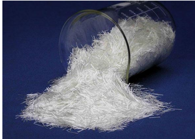
Slika 2. Staklena vlakna [6]