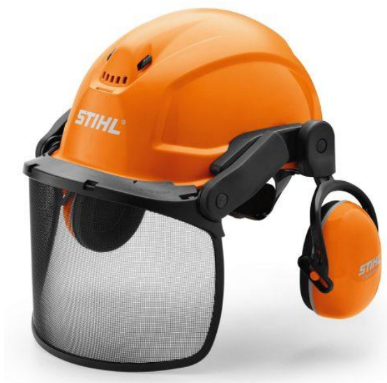
Slika 4. Šumarska kaciga [8]

Šumarska kaciga ima i mrežasti štitnik za oči te zimsku podlogu. Mrežasti štitnik je izrađen od acetatne folije ili najlona te je pričvršćen s prednje strane kacige držačem koji radnik podiže i spušta, a glavna funkcija je zaštititi oči od piljevine. Zimska podloga sadrži kapu koja štiti glavu, vrat i uši radnika prilikom rada na otvorenom.