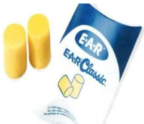
Slika 6. Zaštitna vata [4]