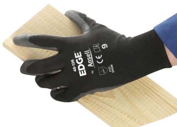
Slika 13. Zaštitne rukavice [15]

Klasične zaštitne rukavice su pletene pamučne ili sintetičke rukavice izvana ojačane prirodnom ili umjetnom gumom te se takve zaštitne rukavice najviše koriste u drveno - prerađivačkoj industriji (slika 13.) Rukavice za zaštitu od mehaničkih opasnosti ispituju se prema normi HRN 388:2019 Rukavice za zaštitu od mehaničkih opasnosti, te su označene odgovarajućim piktogramom oblika čekića s ocjenama za četiri otpornosti, kao što su habanje, presijecanje, trganje i probijanje. Raspon ocjena za svaku pojedinu otpornost je od 1 do 4, odnosno 5 za presijecanje. Što je veća ocjena bolja je razina otpornosti. [4]