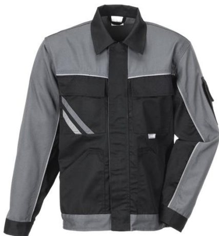
Slika 17. Zaštitni prsluk [19]

Zaštitna odjeća u drvenoj industriji obuhvaća zaštitni prsluk ili kratke kapute za zaštitu pri radu sa strojevima (slika 17), te radne hlače ili kombinezone (slika 18.). Radnici nose zaštitnu odjeću radi zaštite od ozljeda, opasnih tvari te vremenskih utjecaja. Zaštitni utjecaj odjeće većinom ovisi o svojstvima materijala od kojih se zaštitna odjeća izrađuje, ali isto tako i o načinu izrade same odjeće.