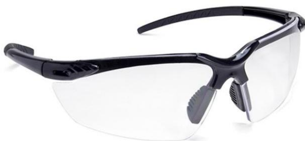
Slika 9. Zaštitne naočale s prozirnim okvirom [12]

Zaštitne naočale s prozirnim staklom služe za zaštitu očiju prilikom obrade materijala od drveta gdje čestice i prašina prilaze iz prednjeg pravca manjom ili srednjom brzinom. Sastoje se od okvira i prozirnog stakla od polikarbonata, a okviri se izrađuju od crnog poliamida i acetat celuloze (slika 9.).