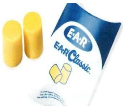
Slika 6. Zaštitna vata [4]