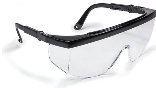
Slika 10. Zaštitne naočale s prozirnim okvirom i bočnom zaštitom [12]

Zaštitne naočale s prozirnim staklom i bočnom zaštitom služe za zaštitu očiju radnika koji rade na strojevima a čestice prilaze velikom brzinom iz prednjeg i bočnog smjera. Sastoje se od okvira i prozirnog stakla od polikarbonata, a okviri se izrađuju od crnog poliamida i acetat celuloze (slika 10.).