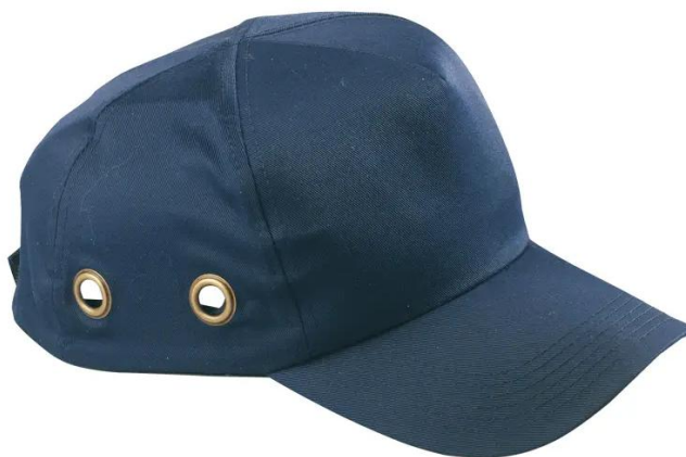
Slika 5. Industrijska zaštitna kaciga zaštitna kapa [9]

Industrijska zaštitna kapa je kapa koja je izađena od tkanine u koju je umetnuta zaštitna čahura od tvrde plastike, zbog udobnosti i ne toliko velikog rizika od ozljede glave u drvnoj industriji odnosno u pilani ona je češći izbor opreme nego industrijska zaštitna kaciga, također tu se može nalaziti i mrežica za kosu čija je glavna funkcija zaštita od zahvaćanja kose od strane rotirajućeg dijelova stroja (slika 5.).