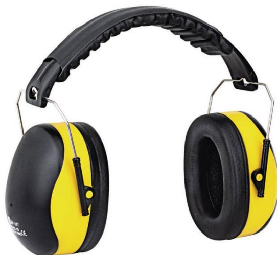
Slika 8. Ušni štitnici [11]

od 150 g mogu se nositi pod bradom, na tjemenu glave ili na zatiljku. Ako prelaze tu masu, nose se samo s nosačem na tjemenu glave.