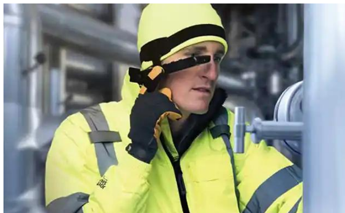
Slika 22. Pametne naočale [24]