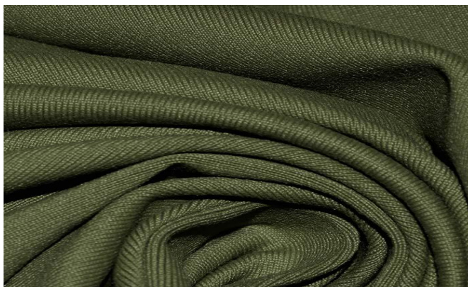
Slika 20. Tkanina od poliamida [21]

Vlakna od poliamida se proizvode slično kao i poliester (slika 20.). Materijali izrađeni od poliamida su izdržljivi, jednostavani za održavanje, dobro održavaju oblik, te se brzo suše jer su otporani na vlagu. Sadrže dvostruko veću otpornost na habanje od poliestera. Poliamid ima dobru otpornost kada je izložen utjecaju visokih temperatura, otpornost na benzin i mast i otpornost na abraziju.