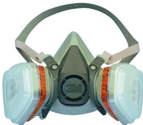
Slika 12. Polumaska s filterom [14]

Nakon svake uporabe polumaska se mora očistiti. Filtre izvaditi iz ležišta, znoj obrisati čistom krpom. Masku oprati mlakom vodom i blagim sapunom te izvršiti dezinfekciju. Filtri se ne smiju propuhivati niti prati vodom, nego se istrošeni filtri mogu samo zamijeniti novim. Polumaska sa filterima se čuva u suhoj prostoriji pri sobnoj temperaturi. Ako se primijete oštećenja, mora se obaviti njihova zamjena. Svake dvije godine mora se izvršiti potpuna zamjena ventila. Skladištenje polumaske s pripadajućim filterima može se obavljati samo u dobro provjetrenim i suhim prostorijama te u originalnoj ambalaži.