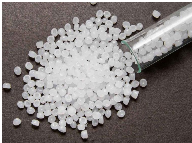
Slika 1. Polietilen [5]

Polivinil klorid ima dobru kemijsku i antikorozivnu postojanost na vodu, otpadnu vodu, lužinu, benzin, ulje, kao i na slabe kiseline, odnosno slabo kisele otopine. Koncentrirane kiseline i čitav niz otapala negativno djeluju na polivinil klorid. Temperaturna postojanost polivinil klorida zadovoljavajuća je do odprilike 60 °C.