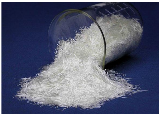
Slika 2. Staklena vlakna [6]