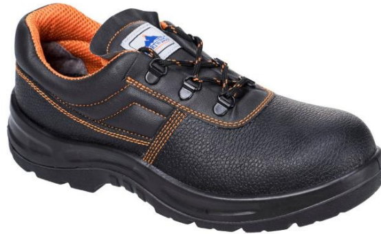
Slika 15. Zaštitne cipele zaštitne cipele [17]