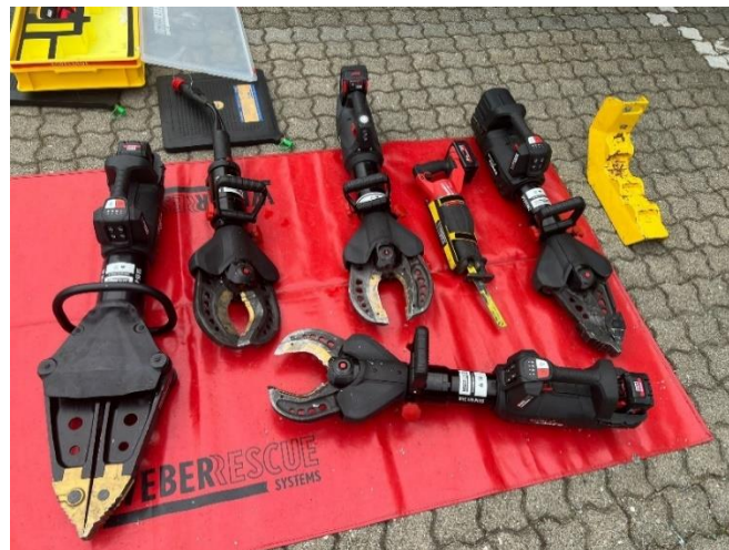
Slika 4. Weber akumulatorski hidraulički alat

Oprema koja se koristi u spasilačko-vatrogasnoj službi je ista koju koriste Javne vatrogasne postrojbe, Dobrovoljna vatrogasna društva i druge postrojbe određene Člankom 30. Zakona o vatrogastvu (NN 125/19, 114/22).[9] Jedina razlika su vozila zato što vozila spasilačko-vatrogasne službe moraju biti prilagođena kretanju po nepristupačnim terenima sa velikom količinom sredstava za gašenje i opreme za spašavanje.