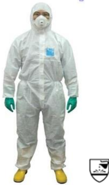
Slika 19: Odijelo za zaštitu od prskanja i aerosola [22].