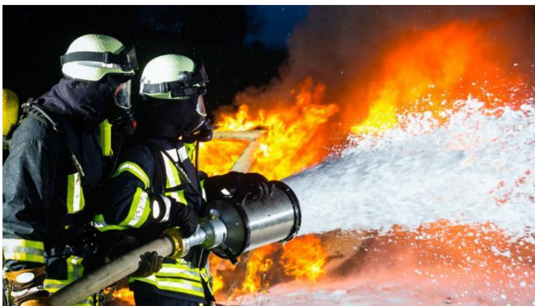
Slika 10: Primjer gašenja požara pjenom [12].

Kemijska pjena najbolji učinak ima za gašenja požara lako zapaljivih tekućina (slika 10). Zračnu pjenu dobivamo miješanjem zraka, vode i pjenila. Zračna pjena nastaje uvođenjem zraka u otopinu vode i pjenila, tako da su mjehurići pjene ispunjeni zrakom. Zračne pjene dobivamo korištenjem raznih pjenila i ekstrakta. Broj opjenjenja pokazuje koliko je volumen nastale pjene veći od volumena otopine od koje je proizvedena. Pjene dijelimo na tešku, srednje tešku i laku pjenu. Sto je više zraka u sastavu pjene, to je pjena lakša.