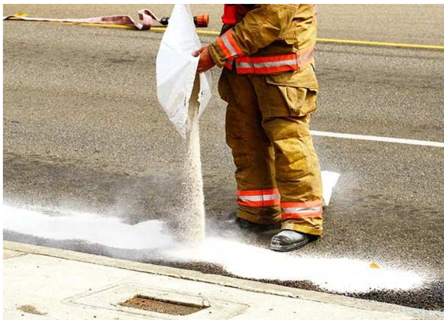
Slika 12: Ograđivanje na kopnu [15].