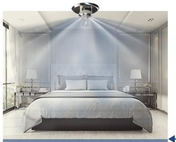
Slika 22: Primjer razlike između standardnih prskalice i HI-FOG sistema [27].