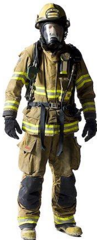
Slika 14: Osobna zaštitna oprema vatrogasaca [19].

Kožne zaštitne čizme s ojačanim potplatom štite noge i stopala vatrogasaca od topline, ranjavanja, požara i doticaja sa različitim opasnim tvarima. Zaštitna kaciga je vrlo važan čimbenik u zaštiti vatrogasaca. Izrađena od polikarbonatnih i drugih suvremenih materijala štiti glavu i lice od opasnih tvari te omogućuje nesmetano komuniciranje. Zaštitna obrazina se izrađuje od miješane gume, dok je priključak za dišnu spravu s normalnim tlakom izrađen je od oblog navoja standardne veličine a priključak za aparate s pretlakom s kosim navojem. Na priključku se nalazi udišni ventil. Izdišni ventil je gumena membrana većeg presjeka radi omogućavanja lakšeg izdisanja. Unutrašnja maska ima dva razvodna ventila, a govorna membrana omogućuje dobro razumijevanje govora.