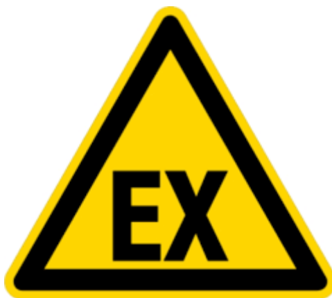
Slika 4: Oznaka EX [8].

Procjena rizika je važan čimbenik u sprječavanju požara i eksplozija. Ona donosi vrlo bitna poboljšanja u samom radnom procesu i osigurava sigurnost radnika i tvrtke.