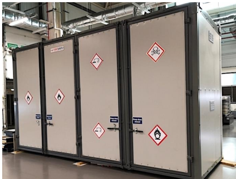
Slika 7: Primjer vatrootpornog spremnika [11].

Zapaljivi materijal je rezultat karakterističnog procesa ili neophodan dio procesa što ga čini u većini slučajeva nezamjenjivim. Količina zapaljivog materijala na radnom mjestu mora biti svedena na minimum te se mora pohraniti u odgovarajućim vatrootpornim spremnicima, na propisani način označiti i udaljiti od izvora paljenja (slika 7). Zapaljivi materijal se ne smije skladištiti sa nekompatibilnim materijalima sa kojima može kemijski reagirati i inicirati eksploziju. Kontrola veličine čestice zapaljivog materijala se može koristiti za smjesu prašina/zrak. Ukoliko su čestice zapaljivog materijala dovoljno velike, npr. veće od 0,5 mm, smanjena je mogućnost nastanka eksplozivne smjese. Uvijek uz grube mogu biti prisutne i fine čestice koje se mogu pojaviti i kao rezultat trenja [7].