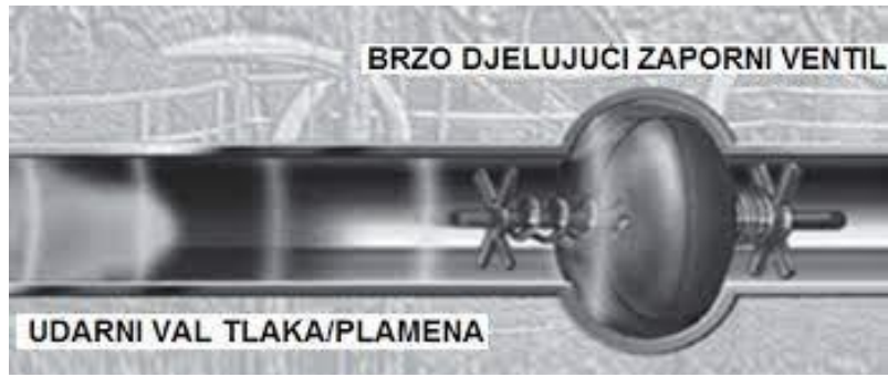
Slika 9: Primjer izoliranja eksplozije sa brzo djelujućim ventilom [7].

Postupak izoliranja eksplozije sa brzo djelujućim ventilom potrebno je prostorno ili preprekama odvojiti inkompatibilne kemikalije, kao što su zapaljive tvari od oksidansa, kiseline od lužina, tvari koje s vodom daju opasne plinove ili burno reagiraju od vode. Kemijski opasne tvari je potrebno odvojiti od procesa ili uređaja koje mogu izazvati iskru, a električne instalacije je potrebno izvesti na najsigurniji način.