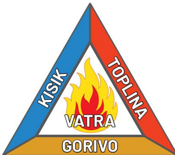
Slika 1: Trokut gorenja [2].

Zapaljive tekućine klasificiraju se kao izuzetno zapaljive, visoko zapaljive i zapaljive. Izuzetno zapaljive tekućine imaju plamište niže od 0°C i vrelište niže ili jednako 35°C. Visoko zapaljive tekućine imaju plamište ispod 21°C, ali nisu izrazito zapaljive. Zapaljive tekućine imaju plamište jednako ili veće od 21°C i manje od ili jednako 55°C i podržavaju gorenje kada se ispituju na propisani način na 55°C.