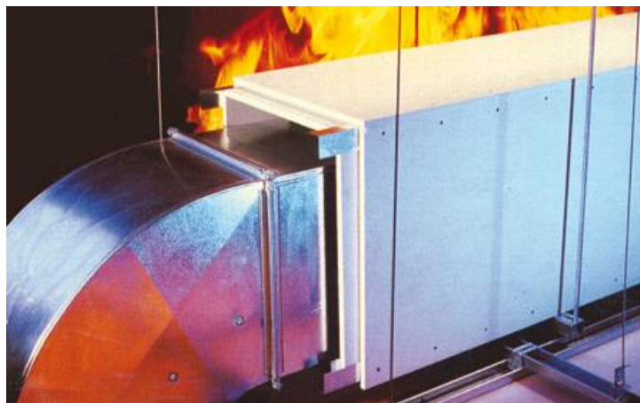
Slika 5: Primjer protupožarne zaštite [9].

Aktivna zaštita od požara obuhvaća poboljšanje postojećih sustava ili novih sustava inteligentnog nadzora, detektora požara i plina, sprinkler sustava, drenažnih sustava (vodena magla, sprinkler, vodeni sprej) i plinovitih sustava za gašenje (slika 6). Aktivnom protupožarnom zaštitom treba obuhvatiti sve prostore u kojima može istjecati zapaljiva tekućina. Sustavi zadržavanja mogu uključivati drenažu za hitne slučajeve koja se odvodi u sekundarno područje zadržavanja kako bi se pomoglo u uklanjanju ispuštene tekućine i ispuštene vode u područje nakupljanja koje se nalazi daleko od opreme i zgrada.