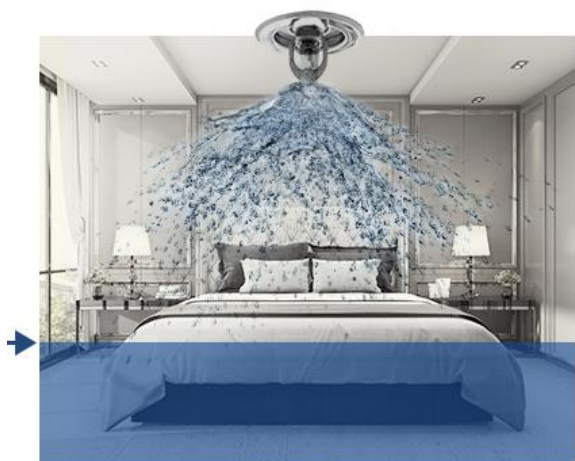
Traditional water sprinkler system