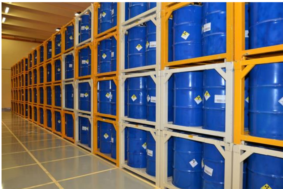
Slika 13: Primjer skladištenja kemijskih tvari [16].

Opasne kemikalije mogu se skladištiti u samostojećim, pokretnim ili podzemnim spremnicima smještenim na nepropusno ozidanom mjestu s prihvatnim bazenom te s nadstrešnicom ili sustavom za prikupljanje oborinskih voda. Podzemni spremnici moraju imati posebnu zaštitnu izolaciju ili dvostruku stijenku. Pravna osoba koja upotrebljava opasnu kemikaliju te pravna osoba koja obavlja djelatnost proizvodnje i prometa opasne kemikalije obvezna je kemikalije držati u posebnim spremnicima, prostorijama i postrojenjima. Na svim vratima prostorija i ormara u kojima se drže opasne kemikalije mora stajati znak opasnosti i natpis kojima se upozorava na vrstu opasnih kemikalija. Potrebno je obratiti pozornost na one spojeve koji moraju ostati vlažni ili mokri kako ne bi postali eksplozivni (pikrinska kiselina, 2,4-dinitrofenil hidrazin, itd.). Važno je pratiti stanje kemikalija i spremnika u kojem su skladište. Neki od znakova mogućeg istjecanja ili nesreće su propadanje vanjske strane spremnika, promjena boje kemikalije i kristalni rast unutar ili izvan spremnika.