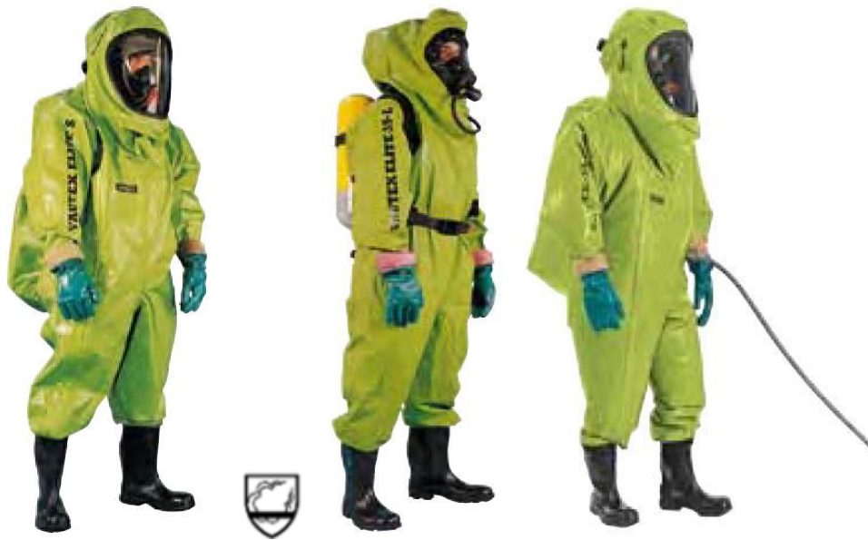
Slika 16: Odijelo za zaštitu od kemikalija a) tip 1a, b) tip 1b, c) tip 1c [22].

Kemijska zaštitna odijela tip 3 i tip 4 (slika 17):