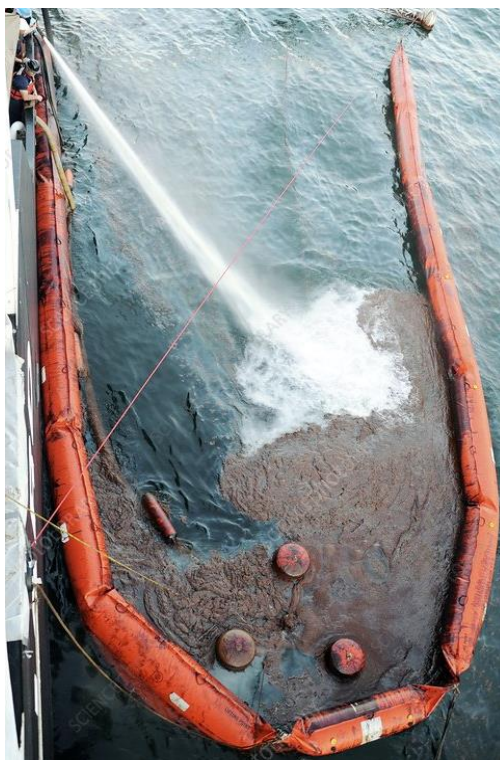
Slika 11: Ograđivanje na vodi [14].

Pješčana brana zaustavit će svaku tekuću kemikaliju i imobilizirati upijanjem [13].