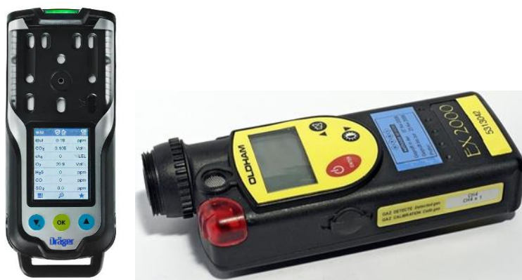
Slika 15: Primjer kemijskog detektora(lijevo)[20] i eksplozimetra(desno) [21].

služi za čišćenje od bioloških agensa i bojnih otrova. Za sveopću skupnu dekontaminaciju koristi se vatrogasna oprema: pumpe, autocisterne, cijevi, mlaznice i hidranti, te druga oprema i uređaji [18].