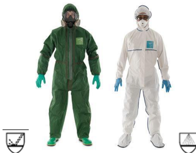
Slika 17: Odijelo za zaštitu od kemikalija u tekućem obliku tip 3 i tip 4 [22]