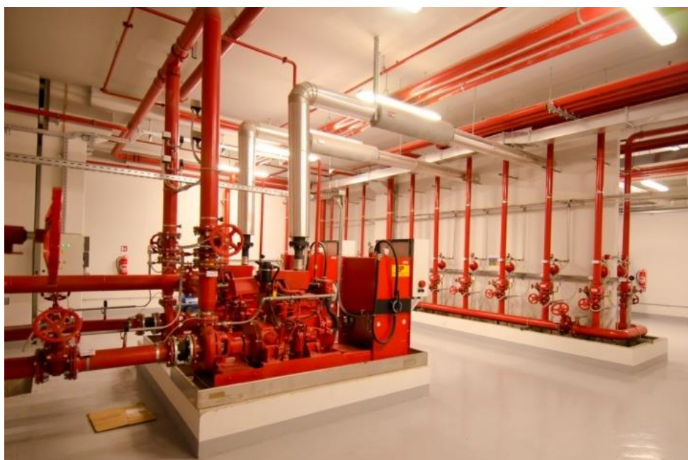
Slika 6: Primjer sprinkler sustava [10].

Aktivna zaštita od požara obuhvaća poboljšanje postojećih sustava ili novih sustava inteligentnog nadzora, detektora požara i plina, sprinkler sustava, drenažnih sustava (vodena magla, sprinkler, vodeni sprej) i plinovitih sustava za gašenje (slika 6). Aktivnom protupožarnom zaštitom treba obuhvatiti sve prostore u kojima može istjecati zapaljiva tekućina. Sustavi zadržavanja mogu uključivati drenažu za hitne slučajeve koja se odvodi u sekundarno područje zadržavanja kako bi se pomoglo u uklanjanju ispuštene tekućine i ispuštene vode u područje nakupljanja koje se nalazi daleko od opreme i zgrada.