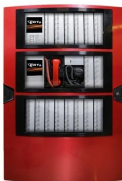
Slika 21: Primjer protupožarnog alarmnog sustava EST4 [26].

Krajem 2019. godine proizvođači protupožarnih alarmnih sustava Notifier i Edward su izdali proizvode koji glasovnu evakuaciju podižu na viši nivo. Sistem ima ugrađene dvonaponske zvučnike koji nude visoku jačinu zvuka, imaju mogućnost montaže na zid i plafon. Napredni zvučnici ovog tipa savršeni su za velika skladišta, visoko naseljena ili izuzetno bučna područja u kojima mogu postići pravovremenu evakuaciju velikog broja ljudi. Platforma EST4 „Glavni sistem za hitne komunikacije“, čuva 250 audio poruka za reprodukciju i podržava parametre oglašavanja i kontrolne prekidače (slika 21) [25].