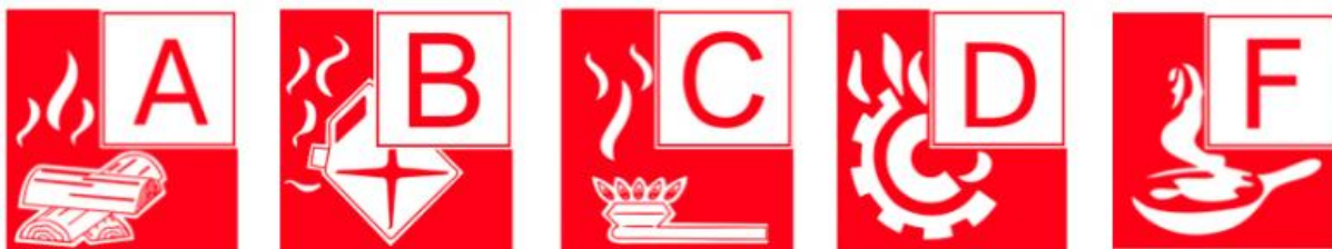
Slika 2: Klase požara [4].

Promjenom norme EN 2:1992/A1:2004 u siječnju 2005. godine uvedena je i klasa požara F. U klasu F pripadaju požari biljnih i životinjskih ulja i masti(slika 2)[3].