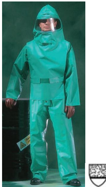
Slika 18: Odijelo za zaštitu od čvrstih kemijskih čestica u zraku [22].

Kemijsko zaštitno odijelo tip 6 (slika 19):