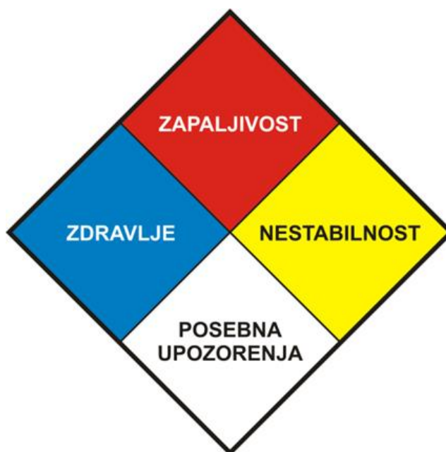
Slika 3: Dijamant opasnosti [5].

opasnosti. Dijamant opasnosti dizajniran je u obliku romba, čija je površina podijeljena na četiri polja različitih boja u kojima su brojevi od 0 do 4. Brojevi u rombu predstavljaju stupnjeve opasnosti. Porast broja ukazuje na porast opasnosti danog polja. Boje unutar romba su karakteristične i imaju određena značenja, pa je tako lijevim plavim poljem u rombu predstavljena opasnost po zdravlje, gornjim crvenim poljem predstavljena je požarna ili eksplozivna opasnost, dok je desno žuto polje oznaka za nestabilnost, a donje bijelo polje rezervirano je za posebne obavijesti (slika 3) [5].