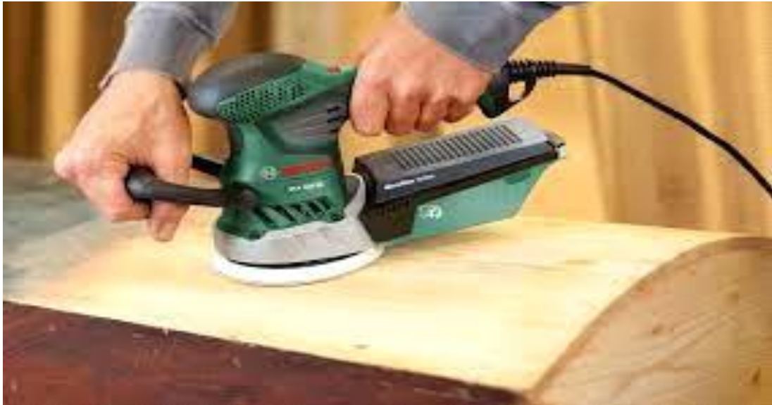
Slika 5. Brusilica

Brusilice (slika 5) se koriste za glađenje i poliranje drvenih površina. Različiti tipovi brusilica uključuju brusilice za trake, vibracijske brusilice i brusilice s rotirajućim diskom.