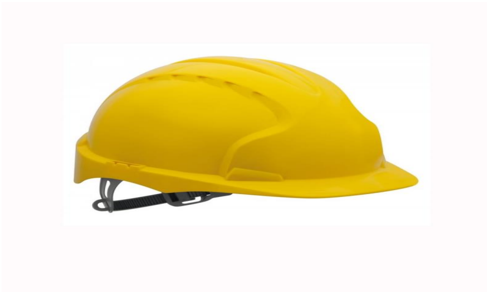
Slika 12. Kaciga