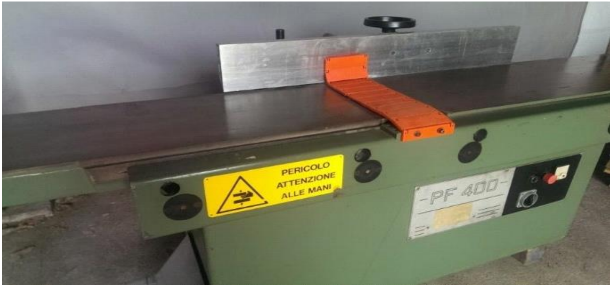
Slika 8. Ravnalica