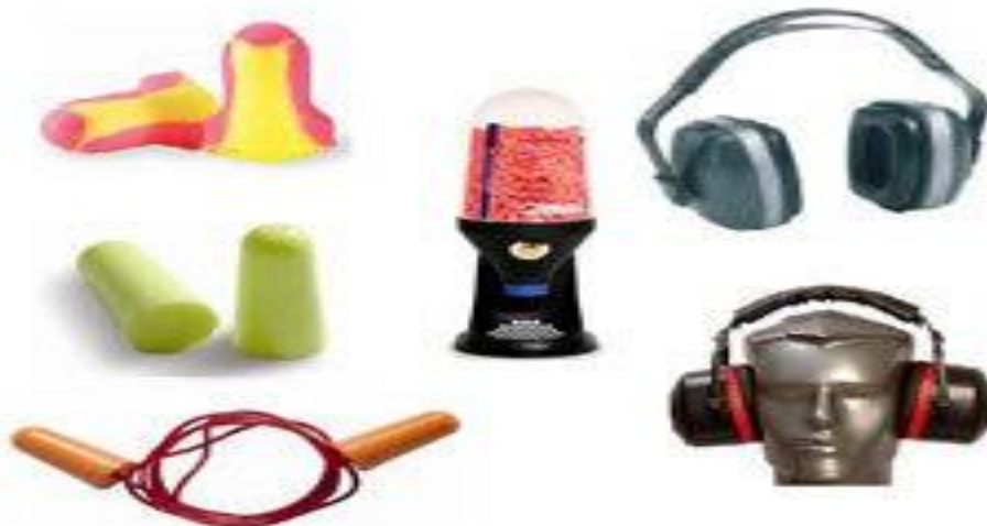
Slika 14. Sredstva za zaštitu sluha