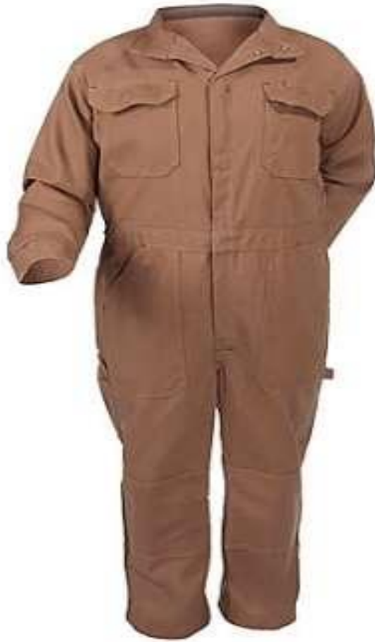
Slika 18. Sredstva za zaštitu tijela