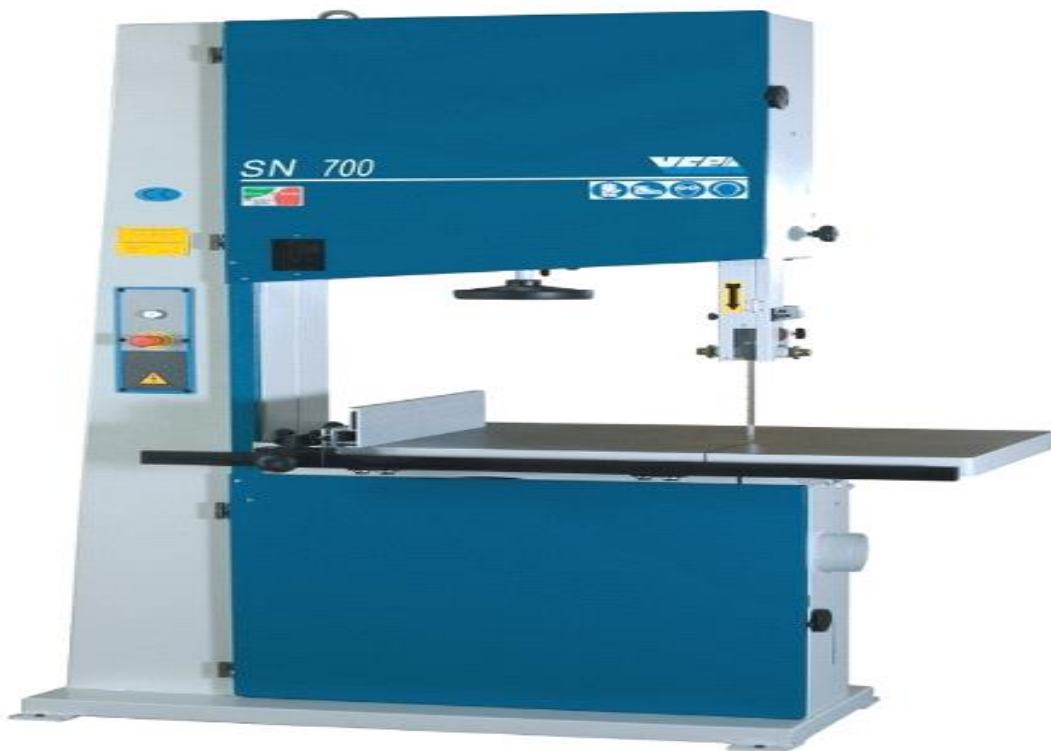
Slika 1. Tračna pila

Štitnici moraju biti tako namješteni da se donji rub štitnika nalazi neposredno iznad obratka koji se reže. Za vrijeme potiskivanja komada koji se obrađuju, ruke je potrebno držati izvan dohvata trake s prstima povijenim uz šaku. Tračne pila trebaju biti opremljene uređajima za kočenje koji zaustavljaju list pile u roku maksimalno deset sekundi [3]. Potrebno je postaviti upute za siguran rad na stroju te osobito napomenuti da rukovatelj prije početka rada provjeri napetost tračne pile. Tijekom piljenja potrebno je koristiti paralelni graničnik ukoliko je to moguće. Paralelni graničnik uvijek mora biti paralelan s trakom pile [4].