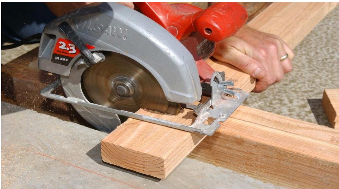
Slika 2. Ručna kružna pila

Kružne pile mogu biti namijenjene za rad u hladnom i toplom stanju. Glavno gibanje izvodi pila, preko mehaničkog prijenosnika kojeg pokreće elektromotor. Pomoćno gibanje izvodi također pila i ono je pravocrtno, najčešće putem hidrauličnog pogona. Predmet obrade je stegnut u napravu i miruje za vrijeme piljenja [5].