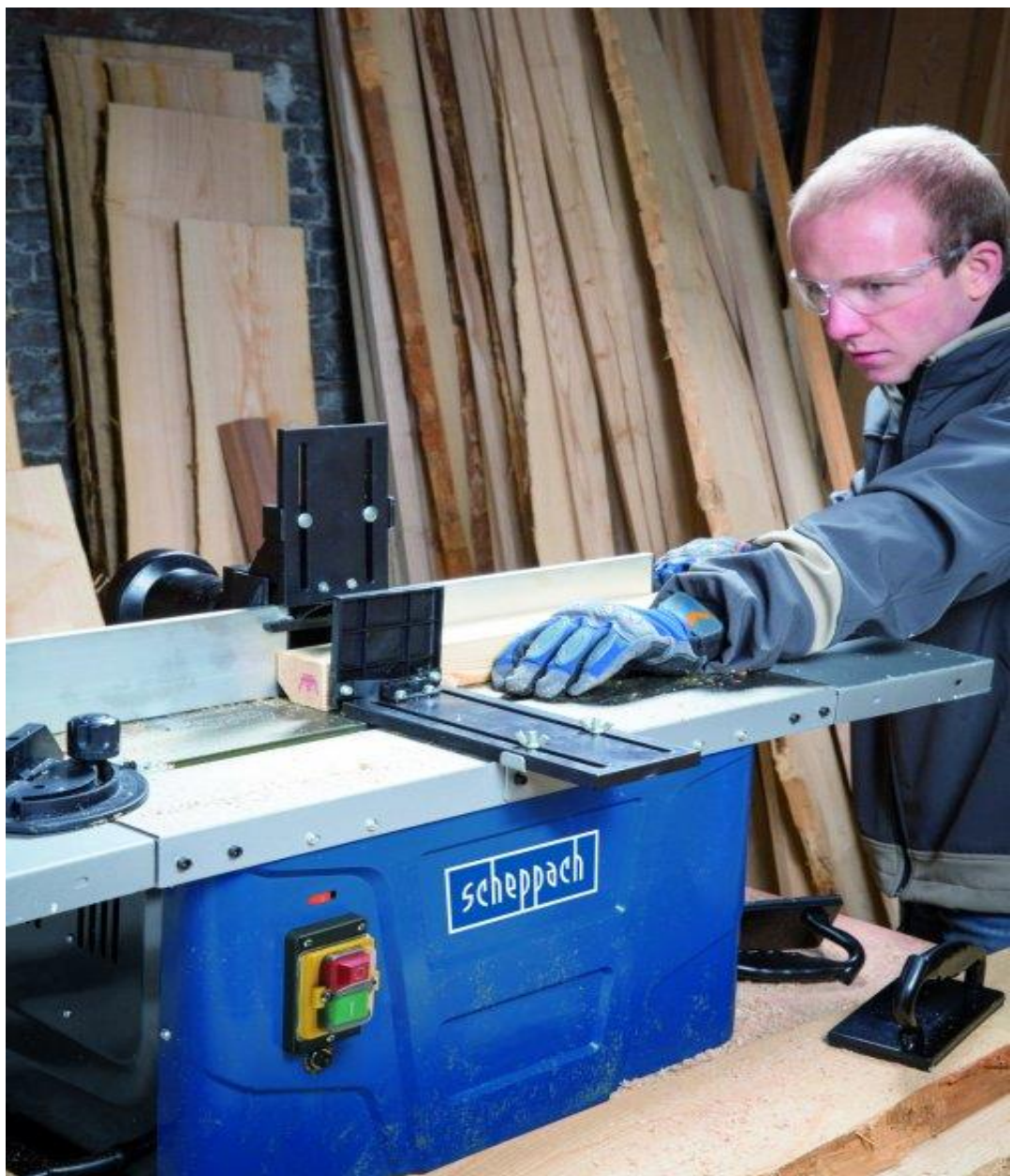
Slika 4. Glodalica

Glodalice (slika 4) su strojevi za precizno rezanje i oblikovanje. Mogu se koristiti za stvaranje utora, kanala, reljefa i različitih oblika. Glodalice se dijele prema orijentaciji glavnog okretnog alata odnosno vretena na vertikalne i horizontalne. Prema veličini, glodalice se proizvode od tako malih da stanu na stol pa sve do veličine veće sobe, a upravljanje im može biti ručno ili automatski. Automatsko upravljanje može biti mehaničko ili digitalno uporabom računala (CNC - engl. Computer Numerical Control). Glavno gibanje je uvijek rotacijsko, dok je posmično gibanje pravocrtnog ili kružnog oblika i uvijek je okomito ili pod nekim kutom na os rotacije [7].