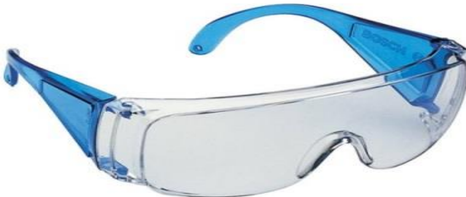
Slika 13. Zaštitne naočale