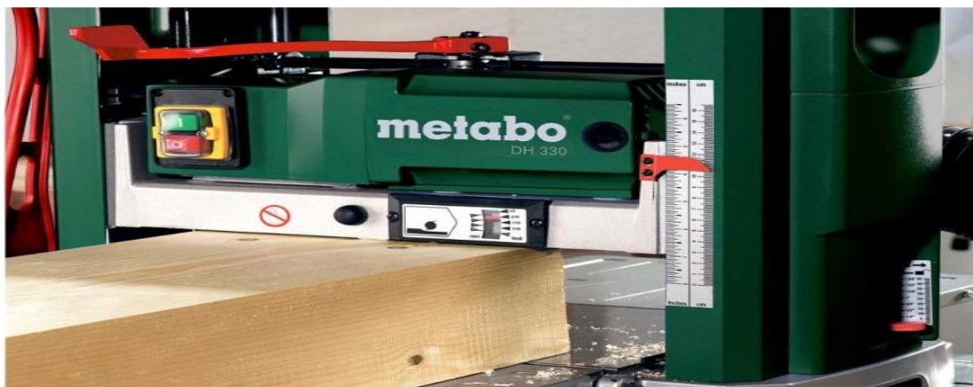
Slika 9. Debljača

Debljača (slika 9) je stroj koji se koristi za obradu drva ili drugih materijala radi postizanja određene debljine. Ovaj stroj koristi oštrice ili noževe kako bi ravnomjerno smanjio debljinu materijala i stvorio glatku površinu. Debljače su često korištene u drvoprađivačkoj industriji i stolariji za pripremu drveta za različite građevinske ili dekorativne svrhe.