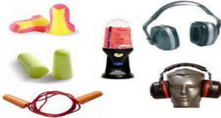
Slika 14. Sredstva za zaštitu sluha