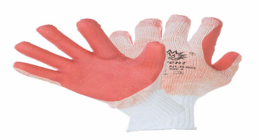
Slika 16. Zaštitne rukavice