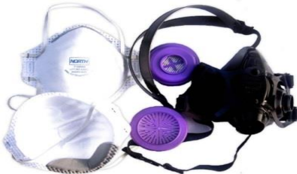
Slika 15. Sredstva za zaštitu dišnih organa