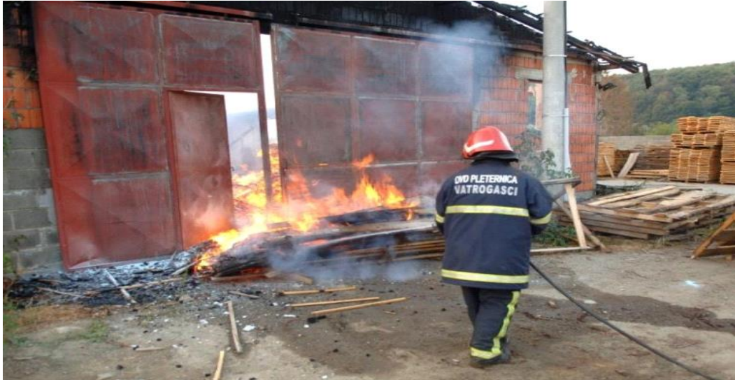
Slika 10. Požar u drvnoj industriji