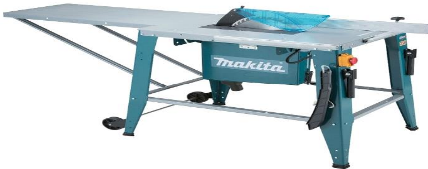
Slika 3. Stolna kružna pila

Dobra praksa preporučuje označavanje opasnog područja drugom bojom (najbolje crvenom) na radnom stolu. To područje obuhvaća 300 mm obostrano u odnosu na lista pile. Rukovateljeve ruke ne bi smjele niti u jednom trenutku biti u tom opasnom području [6].