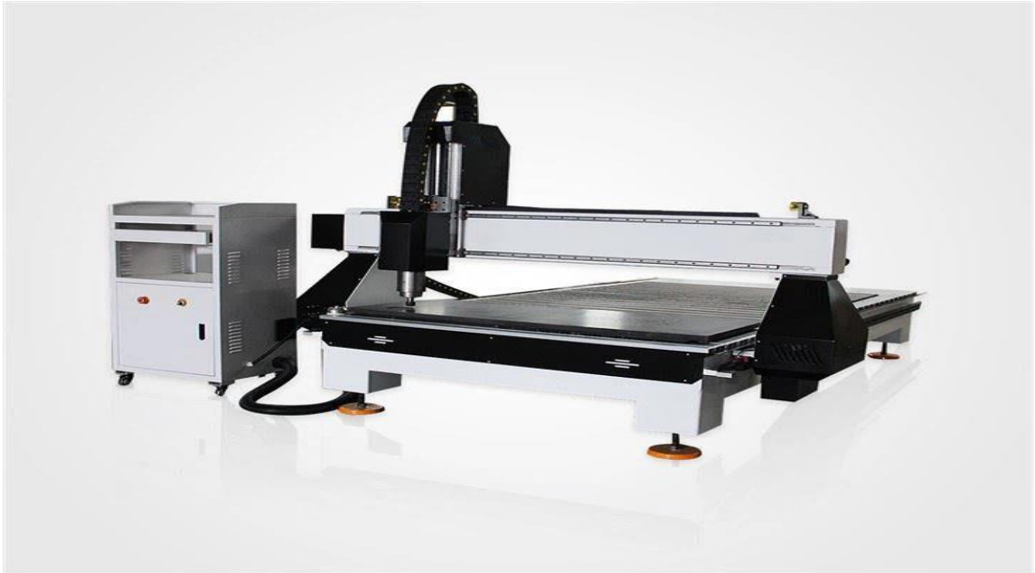
Slika 6. CNC stroj za obradu drva