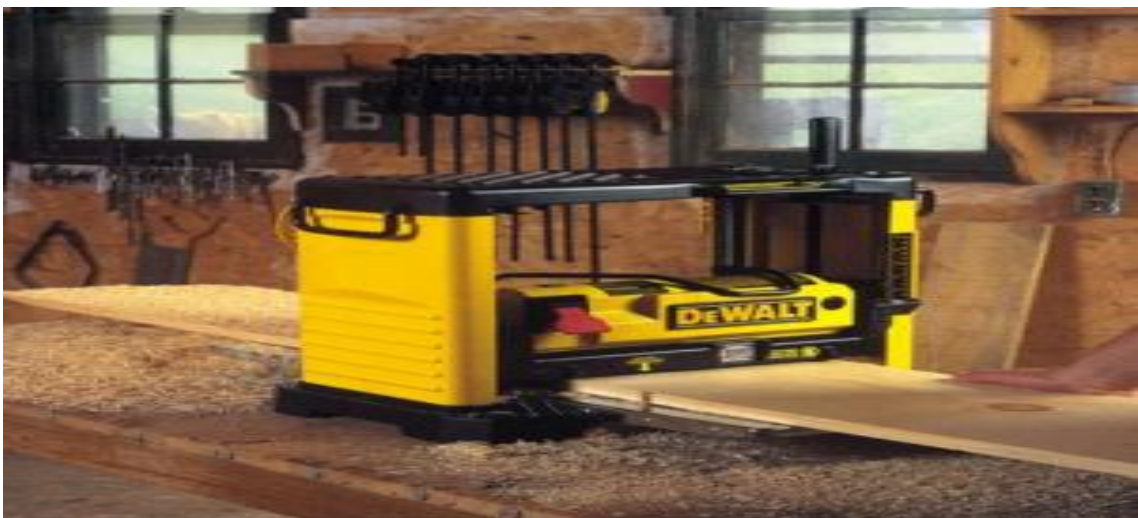
Slika 7. Blanjalica

Blanjalice (slika 7) su strojevi za obradu drveta skidanjem strugotine pravocrtnim gibanjem alata prema izratku ili obratno. Blanjalice se dijele na ravnalice, debljače i višestране blanjalice.