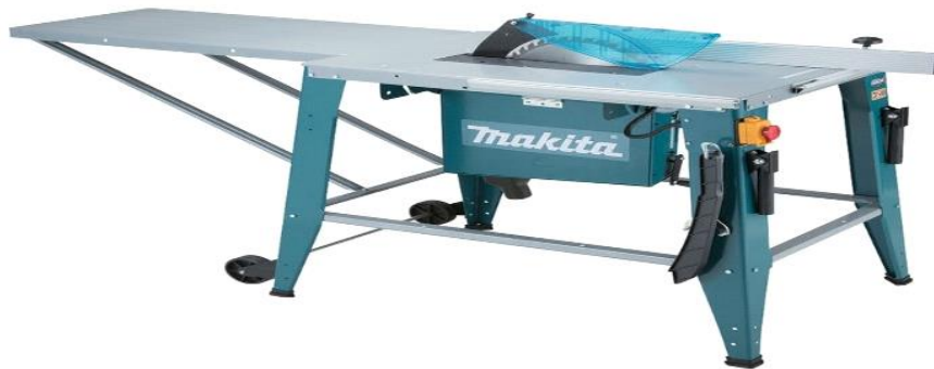
Slika 3. Stolna kružna pila

Dobra praksa preporučuje označavanje opasnog područja drugom bojom (najbolje crvenom) na radnom stolu. To područje obuhvaća 300 mm obostrano u odnosu na listu pile. Rukovateljeve ruke ne bi smjele niti u jednom trenutku biti u tom opasnom području [6].