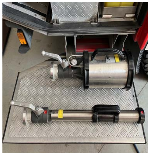
Sl.8. Mlaznice za srednje tešku i tešku pjenu.[4]

Generator lake pjene namijenjen je za gašenje požara zatvorenih prostora. Zbog velike ekspanzije pjene postiže se brzo ispunjanje prostora pjenom. Izrađuje se sa ili bez ugrađenog mješača. Ima i mrežu za stvaranje pjene. Radni tlak za dobivanje najbolje pjene je od 5 do 7 bara.