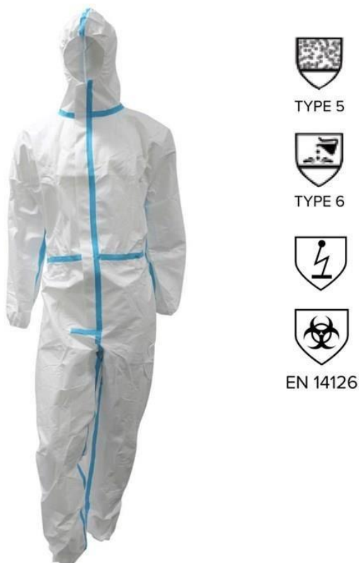
Sl. 2 Jednokratni kombinezon SPFH [2]

U narednom dijelu slijedi opis svakog dijela zaštitne opreme koja se koristila u vrijeme epidemije/pandemije. Sva oprema je proizvedena po važećim standardima i normama EU.