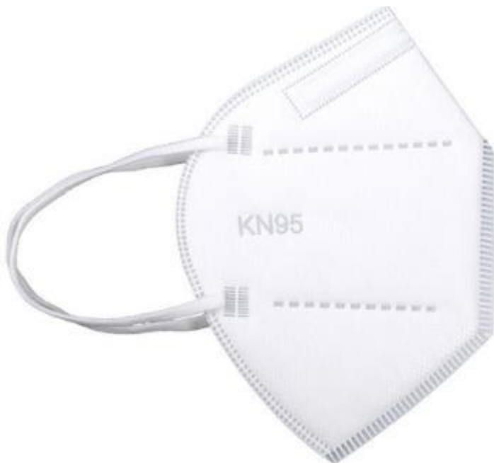
Sl.11 Zaštitna maska N95 [11]