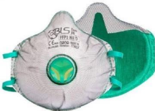
BLS031 ZERO FFP3 respirator