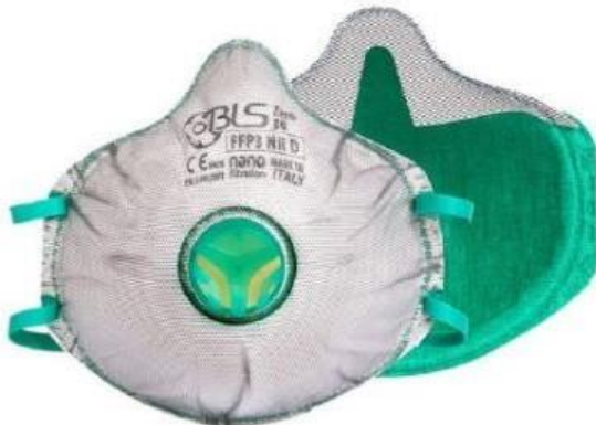
BLS031 ZERO FFP3 respirator