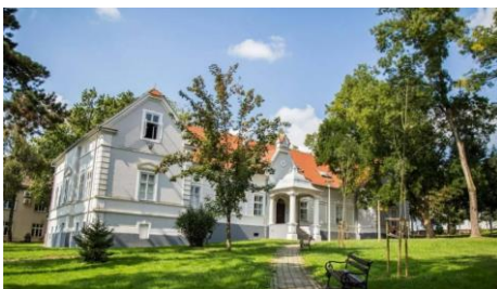
Slika 6 Muzej Moslavine