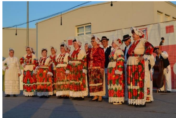
Slika 1 Kulturno umjetničko društvo "Sveti Florijan" Poljana Lekenička