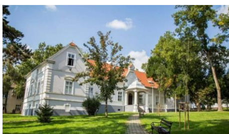
Slika 6 Muzej Moslavine

Izvor: Muzej Moslavine, https://experiences.moslavina.travel/hr/products/muzej-moslavine (1.7.2023.)