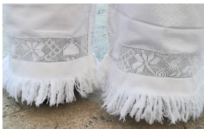
Slika 2 Vez pukan'ca