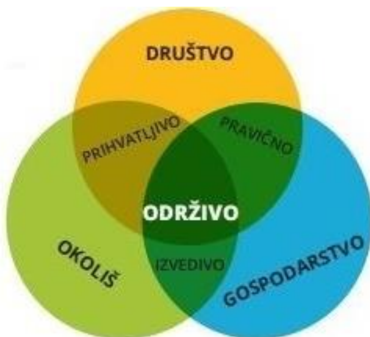
Slika 1. Koncept održivog razvoja