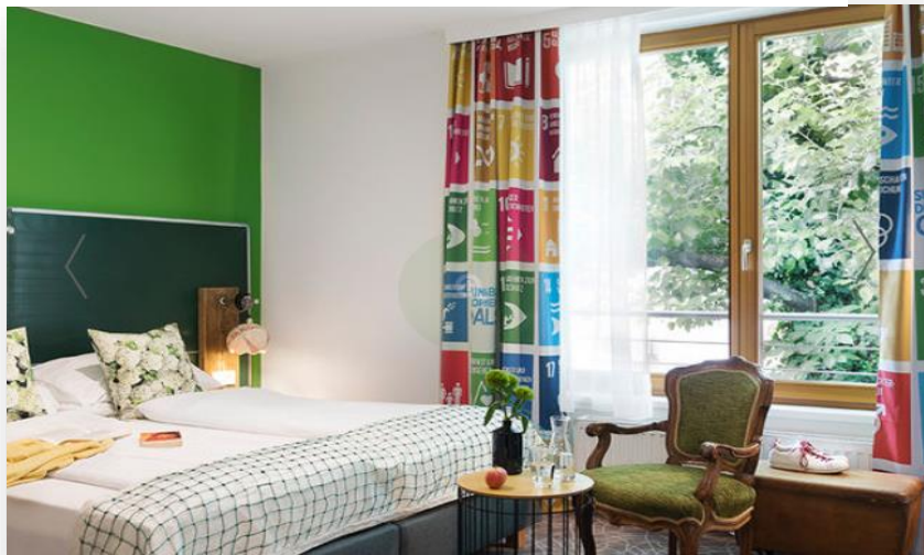
Slika 16. Komfort soba