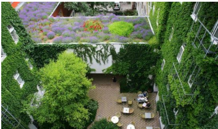
Slika 14. Pogled na krovni vrt Boutique Hotela Stadthalle