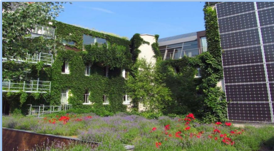
Slika 13. Boutique Hotel Stadthalle