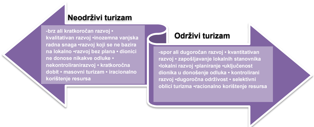
Slika 1. Usporedba održivog i neodrživog turizma

Resursi se uvelike troše iracionalno i prisutan je nemar za buduće generacije. U svome djelovanju nema detaljnog i razrađenog plana kako treba postupiti u pojedinim situacijama, plan nije fleksibilan i nije prisutna briga o zapošljavanju lokalnog stanovništva. Slika 1 prikazuje razliku održivog turizma u odnosu na neodrživi turizam.