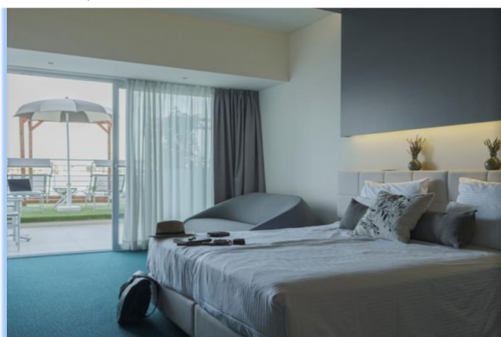
Slika 10. Triple Terrace soba

🛏 Room service 🧺 Laundry service 🌊 Sea view 🌊 Sea view 🏠 Terrace 🌬 Air condition 🚿 Private bathroom & toilette 💨 Hair dryer 🍹 Mini bar 🗳 Safe deposit box in room 📺 TV 📶 Wi-Fi 🧣 Bathrobe 🅇 Parking