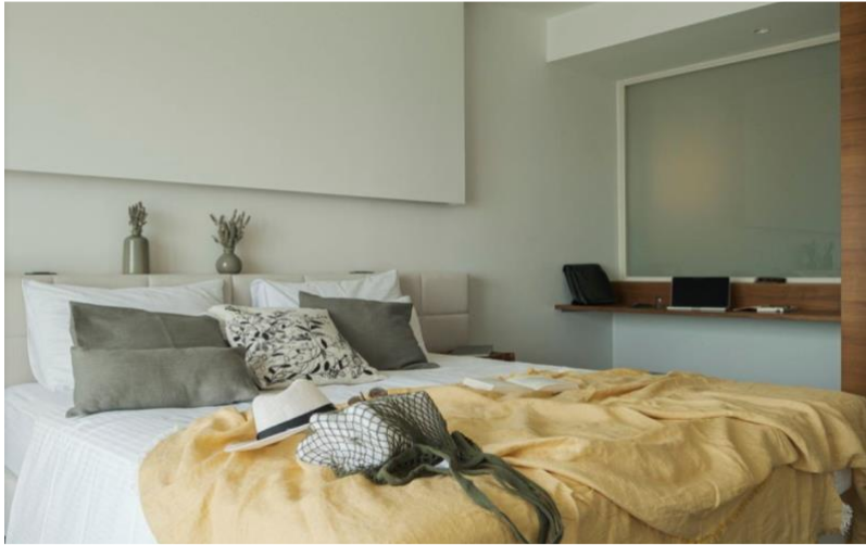
Slika 11. Superior Terrace soba

Room service Laundry service Sea view Terrace Air condition Private bathroom & toilette Hair dryer Mini bar Safe deposit box in room TV Wi-Fi Bathrobe Parking