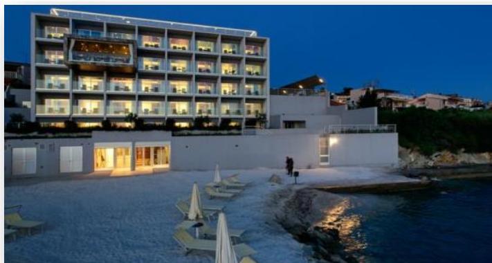
Slika 7. Hotel Split