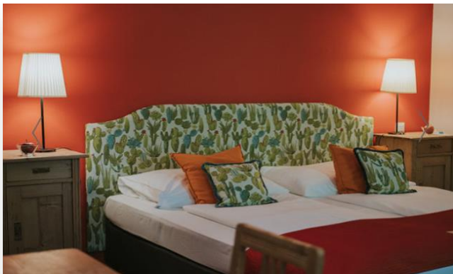
Slika 17. Superior soba