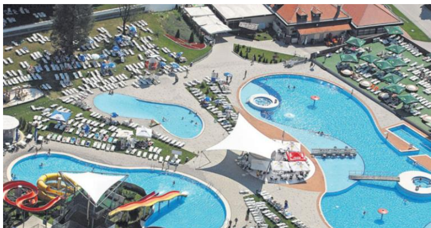
Slika 19. Toplice Sveti Martin