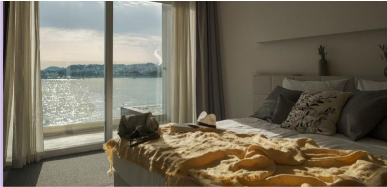
Slika 12. Obiteljska soba