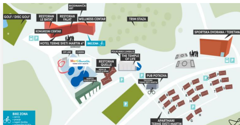
Slika 20. Toplice Sveti Martin

Izvor slike: https://www.termesvetimartin.com/hr/lokacija/ (8.3.2023.)