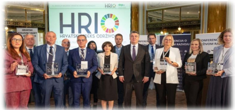
Slika 5. Dobitnici nagrade sa predsjednikom RH