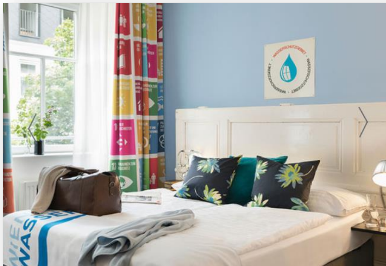
Slika 15. Standard soba