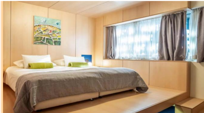
Slika 9. Standardna soba i ponuda sobe

🛏 Room service 🧺 Laundry service 🌊 Sea view 🌬 Air condition 🚿 Private bathroom & toilette 💨 Hair dryer 🍹 Mini bar 🗳 Safe deposit box in room 📺 TV 📶 Wi-Fi 🧣 Bathrobe 🧦 Slippers 🅇 Parking