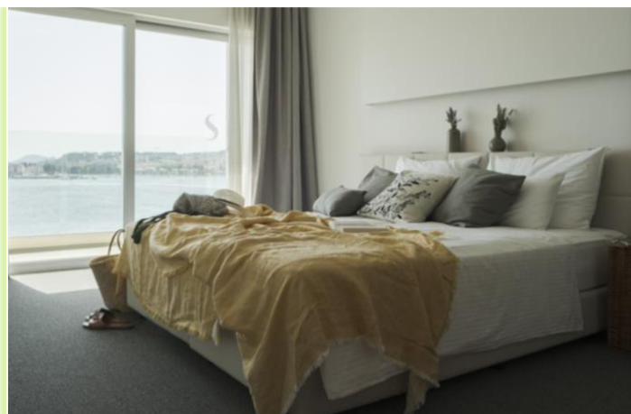
Slika 8. Superior soba i ponuda

Svaka soba je sa vrhunskim pogledom na Jadran u kojem se zrcale sunce, nebo i otoci. S tim udobnostima, gosti se pogledu dive iz svog kreveta ili sa vlastitog balkona.