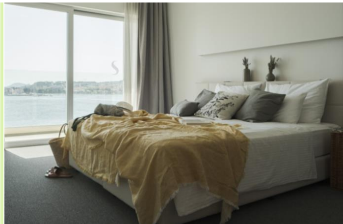
Slika 8. Superior soba i ponuda

Svaka soba je sa vrhunskim pogledom na Jadran u kojem se zrcale sunce, nebo i otoci. S tim udobnostima, gosti se pogledu dive iz svog kreveta ili sa vlastitog balkona.