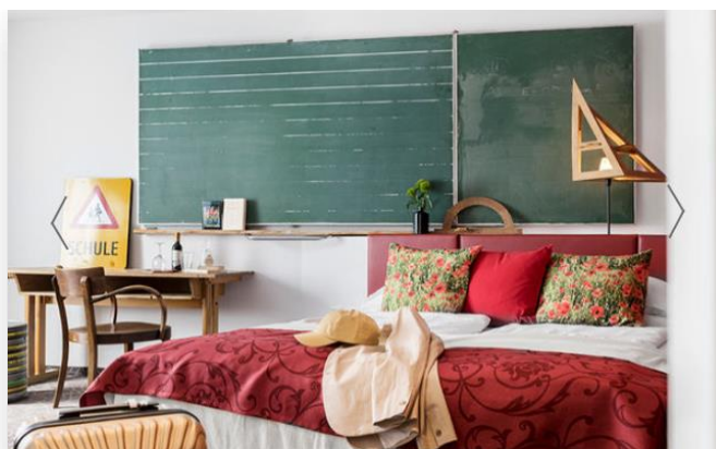
Slika 18. Superior soba