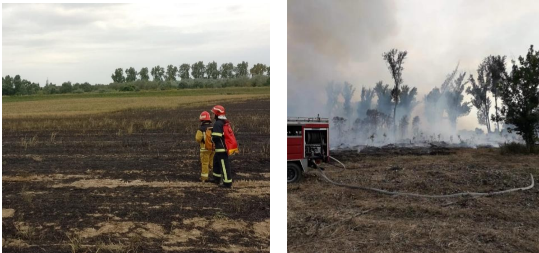
Sl. 6. Požar otvorenog prostora u Parku prirode Kopački rit (fotografije iz arhiva DVD Retfala Osijek)

Na ovoj intervenciji su se primijenili i drugi načini gašenja požara, između ostalog događavalo se pomoću naprtnjača u kojima se nalaze klipne ručne pumpe (Sl. 9).