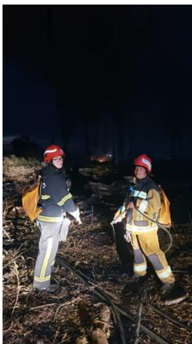
Sl. 9. Dogašavanje pomoću naprtnjača

(lijevo na slici je autorica rada)