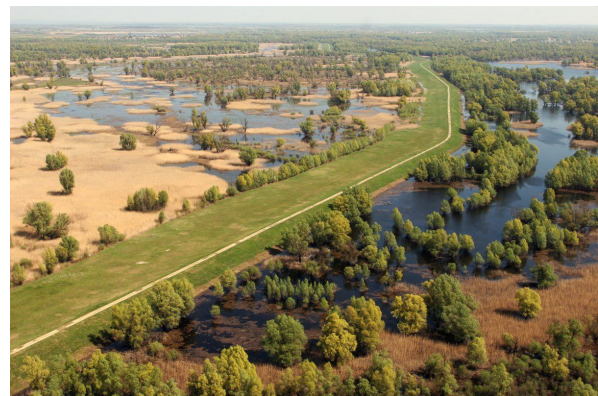
Sl. 5. Park prirode Kopački rit [16]