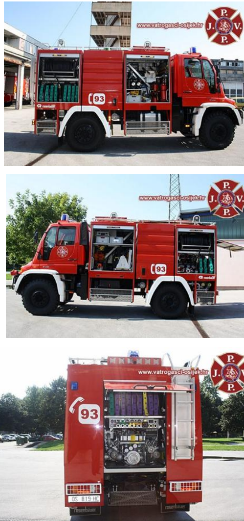
Sl. 7. Vatrogasno vozilo za gašenje šumskog požara s opremom i pumpom Ziegler 40-250 u stražnjem dijelu vozila [21]