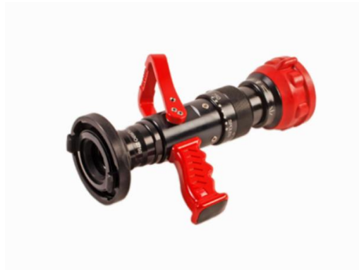
Sl. 10. AWG Turbo 2235 mlaznica [23]

Naprtnjača za gašenje početnih požara s punjenjem od 25 l koristi se na način da ručnu pumpu treba izvaditi iz leđnog držača ili iskopčati iz nosača, te je zajedno sa spojnom cijevi priključiti na naprtnjaču. Istezanjem i stezanjem ručne pumpe aktivira se naprtnjača. Pomakom mlaznice iz srednjeg u krajnji položaj dobiva se puni ili raspršeni mlaz vode. Primjena naprtnjača osim za gašenje početnih požara, prvenstveno je namijenjena za lokaliziranje te gašenje šumskih požara, a može se koristiti za početne požare krutih tvari (razred A) [22].