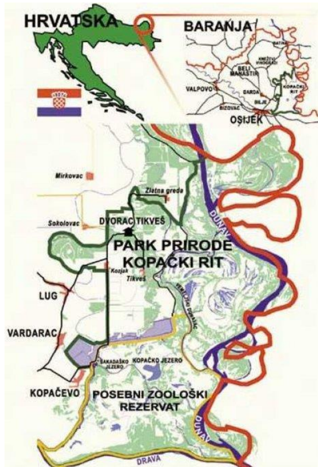
Sl. 4. Položaj Parka prirode Kopački rit [19]