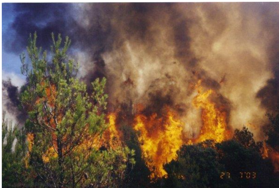
Sl. 2. Ovršni požar

Cilj je rada na osnovi analize Pravilnika o zaštiti od požara Javne ustanove "Park prirode Kopački rit" i analize gašenja požara na otvorenom prostoru Parka dati sugestije za poboljšanja sadašnjih mjera zaštite od požara u ovom zaštićenom području.