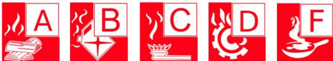
Sl. 3. Klasifikacija požara prema vrsti gorive tvari [7]

U novijoj literaturi govori se i o petoj klasi - Klasa F (Sl. 3) - požari biljnih i životinjskih ulja i masnoća [7].