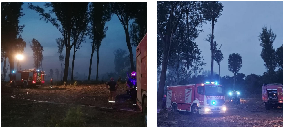
Sl. 8. Vatrogasna vozila: "šumarko" i tri autocisterne na požarištu u Parku prirode Kopački rit (slika desno prikazuje kružno hidrofiranje)