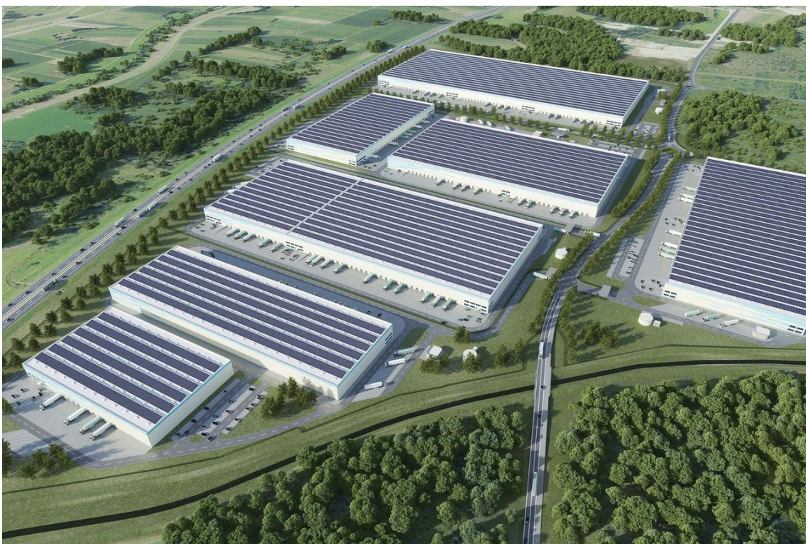
Slika 3 Industrijski kompleks [14]

Projektiranje industrijskog kompleksa zahtijeva pažljivo planiranje i integraciju različitih komponenti kako bi se postigla maksimalna učinkovitost, sigurnost i održivost. Proces uključuje nekoliko ključnih koraka. Potrebno je znati što postrojenje obuhvaća. Uobičajeno je da se promatra kompletna cijelina odnosno oprema koja bi se trebala nalaziti unutar postrojenja. To uključuje vrstu proizvodnje, tok sirovine, logističke zahtjeve, veza sa vanjskim prometnicama, broj zaposlenih i tehnološke zahtjeve. Prilikom projektiranja sagledavaju se svi zakonski i regulativni zahtjevi uključujući standarde za sigurnost, zaštitu na radu, zaštitu od požara, zaštitu okoliša i urbanističke planove. Definiiraju se različite zone unutar kompleksa (proizvodne, skladišne, logističke, administrativne, tehničke, servisne i zelene zone.) Nakon toga dolazi prometna infrastruktura, vodovodna mreža, kanalizacija, električna mreža, plin, telekomunikacije i druge potrebne komunalne usluge. Dolazimo do faze gdje izrađujemo arhitektonski nacrt objekata unutar kompleksa uzimajući u obzir funkcionalnost, sigurnost i estetiku. Osiguranje da svi objekti budu strukturno stabilni i otporni na lokalne