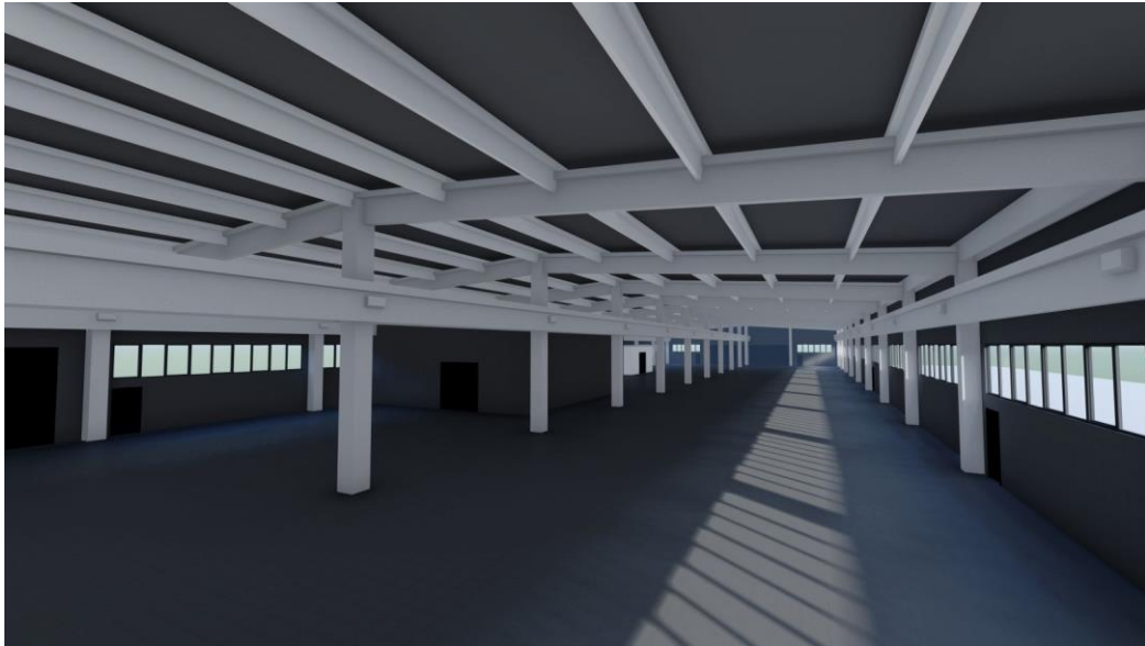
Slika 7 Prizemni industrijski objekti [18]