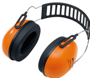
Slika 5: Ušni štitnici

Druga uobičajena osobna zaštitna sredstva za zaštitu sluha su slušalice s aktivnom redukcijom buke. Ove slušalice koriste tehnologiju za detekciju i smanjenje buke, pružajući korisnicima udobnu i učinkovitu zaštitu od štetnih zvukova.