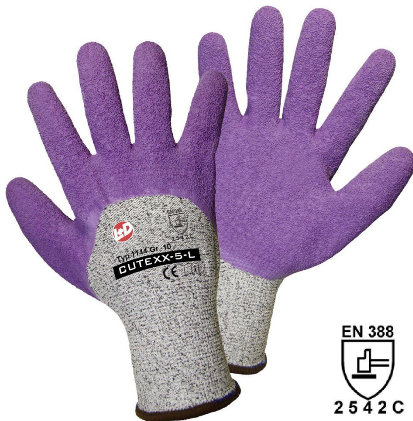
Slika 12: Rukavice otporne na rezanje

Rukavice otporne na rezanje koriste se tijekom rada s vrlo oštrim predmetima kao što su limovi, crjepovi, staklo i slični materijali koji mogu izazvati ozbiljne porezotine. Ove rukavice izrađene su od polietilenskih vlakana s dodatkom elastina, što ih čini sigurnijima i praktičnijima za korištenje. Nisu teške niti glomazne, čime omogućuju udobnost i fleksibilnost tijekom rada, dok istovremeno pružaju visoku razinu zaštite, kao i tekstilne rukavice prema normi HRN EN 1082-1:2001. [19]