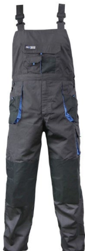
Slika 15: Radne hlače sa tregerima