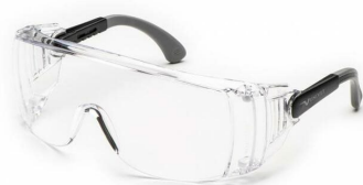
Slika 8: Zaštitne naočale

Zaštitne naočale se primjenjuju prilikom obavljanja manjih poslova s motornom pilom ili za kratkotrajno korištenje alata poput brusilica i bušilica. Njihova svrha je zaštita od potencijalnih ozljeda uzrokovanih raspršenim materijalom ili iskrama tijekom rada s tim alatima. [8].