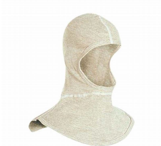
Slika 3: Zaštitno pokrivalo za glavu

Svaka od ovih vrsta zaštitnih pokrivala dizajnirana je s ciljem smanjenja rizika od ozljeda i pružanja sigurnog radnog okruženja za radnike u različitim industrijama. Važno je osigurati da zaštitna pokrivala odgovaraju propisima i standardima te da se koriste u skladu s uputama proizvođača kako bi se osigurala maksimalna učinkovitost i sigurnost.