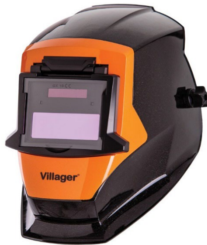
Slika 9: Prikaz zavarivačke maske

Za dodatnu zaštitu od kemikalija i drugih tekućina, koriste se zaštitne naočale s bočnim zaštitama ili lica s vizirima. Ovi proizvodi pružaju potpuniju pokrivenost očiju i lica, sprječavajući kontakt s potencijalno opasnim tvarima. [8].