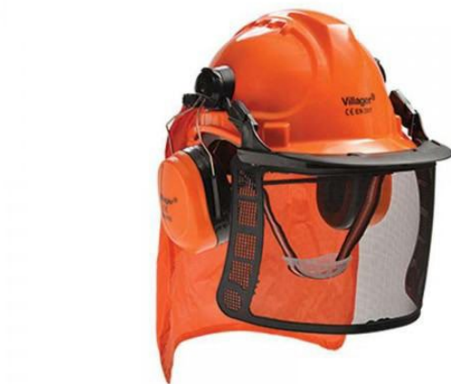
Slika 6: Zaštitna kaciga sa dodatcima

Osim toga, postoji i niz drugih proizvoda za zaštitu sluha, uključujući preklopne čašice za uši i specijalne slušalice dizajnirane za specifične industrijske uvjete. Važno je odabrati odgovarajuća osobna zaštitna sredstva ovisno o razini buke na radnom mjestu i individualnim potrebama radnika, pri čemu se uzima u obzir i primjena inovativnih materijala radi osiguranja najbolje zaštite i udobnosti. Redovita inspekcija i održavanje opreme također su ključni kako bi se osigurala pouzdana zaštita od buke i očuvala slušna sposobnost radnika.