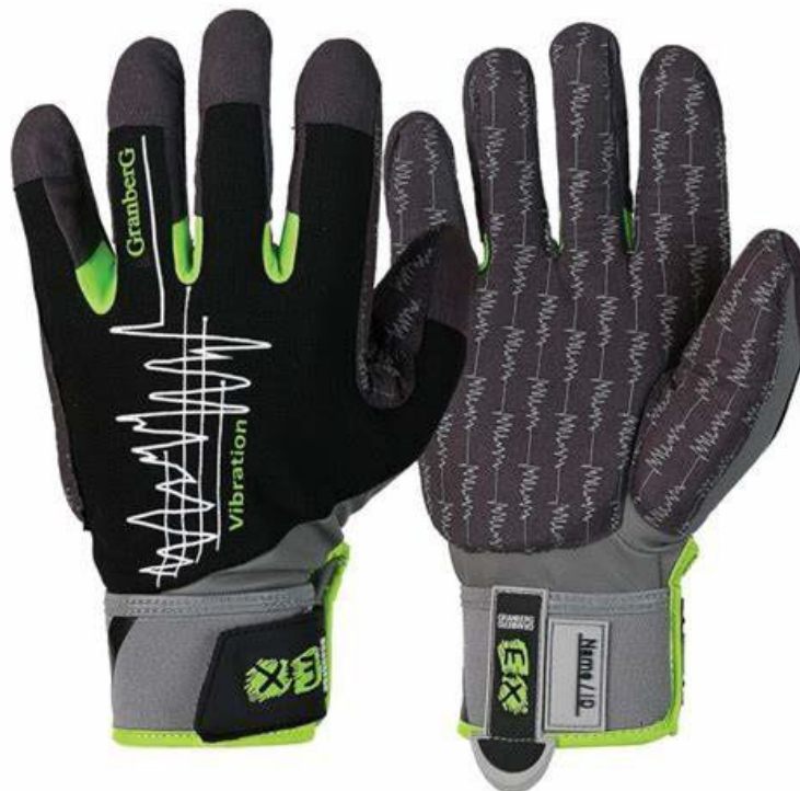
Slika 11: Rukavice za zastitu od vibracija

Jedna od učinkovitih mjera za zaštitu od pretjerane izloženosti vibracijama koje se prenose na ruke je korištenje antivibracijskih rukavica. Ove rukavice, namijenjene za rad s vibrirajućim alatima, moraju ispuniti nekoliko važnih kriterija. Prvo, trebaju biti fleksibilne kako bi omogućile lakše rukovanje alatima i smanjile silu potrebnu za držanje, čime se smanjuje prijenos vibracija na ruke korisnika. Drugo, moraju imati dobra toplinskoizolacijska svojstva kako bi spriječile pothlađivanje ruku, čime se smanjuje osjetljivost na štetne učinke vibracija. Osim toga, moraju osigurati potrebnu razinu zaštite od mehaničkih ozljeda i, na kraju, moraju učinkovito prigušivati vibracije u skladu s normom HRN EN ISO 10819:2000. [18]