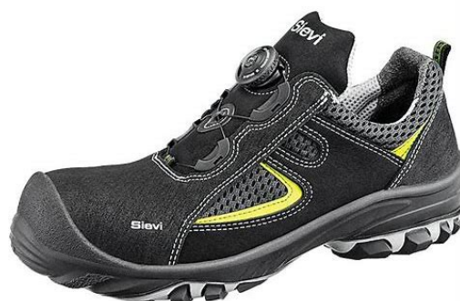
Slika 19: Radne cipele sa kapicom