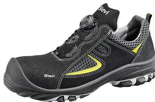
Slika 19: Radne cipele sa kapicom