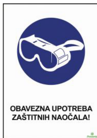
Slika 7: Obavezna upotreba zaštitnih naočala

Zaštitne naočale se primjenjuju prilikom obavljanja manjih poslova s motornom pilom ili za kratkotrajno korištenje alata poput brusilica i bušilica. Njihova svrha je zaštita od potencijalnih ozljeda uzrokovanih raspršenim materijalom ili iskrama tijekom rada s tim alatima. [8].