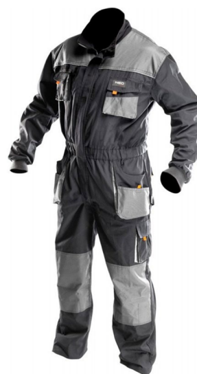
Slika 16: Radni kombinezon