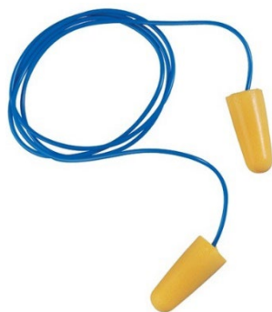
Slika 4: Ušni čepovi

Jedno od najčešće korištenih osobnih zaštitnih sredstava za zaštitu sluha su čepići za uši. Oni su obično izrađeni od mekog, fleksibilnog materijala poput pjene ili silikona te se umetaju u uho kako bi se blokirali ili smanjili ulazak buke. Čepići za uši su jednostavni za korištenje i pružaju prilagodljivu razinu zaštite ovisno o vrsti i jačini buke na radnom mjestu.