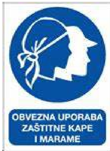
Slika 2: Oznaka o obaveznoj uporabi zaštitne kape / marame

Ova kapa obično je izrađena od tkanine i opremljena krutom plastičnom školjkom koja pruža dodatnu zaštitu. Mrežice za kosu, s druge strane, namijenjene su zaštititi kose od ulaska u rotirajuće dijelove strojeva. [9].