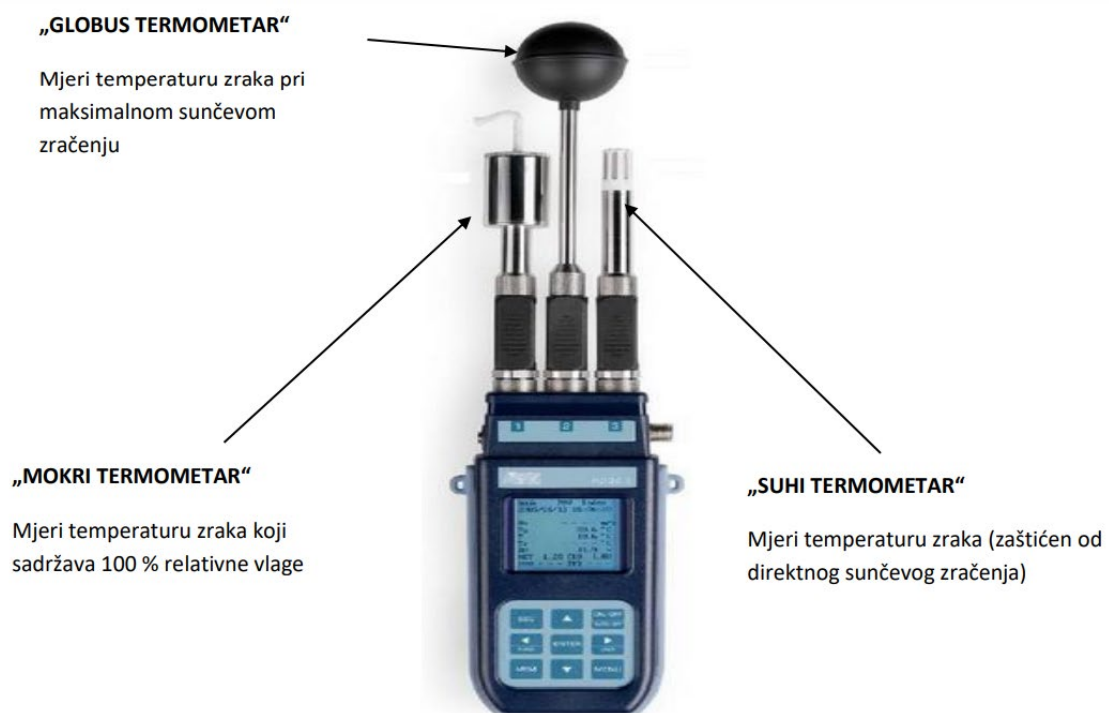
Slika 23: Uređaj za mjerenje TVT indexa

TVT indeks uzima u obzir mikroklimatske čimbenike, poput temperature zraka, vlažnosti i brzine strujanja zraka, koji doprinose percepciji topline kod ljudi. Na radnom mjestu gdje se radi na direktnom suncu, toplina sunčevog zračenja uključuje se u izračun TVT indeksa. [24]