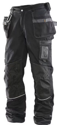
Slika 14: Radne hlače