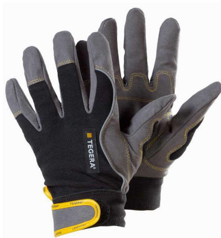
Slika 10: Rukavice za zaštitu od mehaničkih opasnosti

Ovi testovi osiguravaju da rukavice pružaju odgovarajući stupanj zaštite od različitih mehaničkih opasnosti, čime se povećava sigurnost radnika na radnom mjestu.