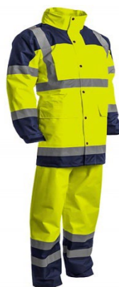
Slika 17: Kišno radno odjelo

Ovi zahtjevi osiguravaju da zaštitna odjeća pruža adekvatnu zaštitu i udobnost radnicima koji su izloženi nepovoljnim vremenskim uvjetima.