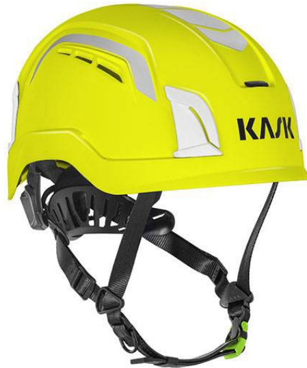
Slika 1: Industrijska zaštitna kaciga

Školjke industrijskih kaciga izrađene su od tvrdog, glatkog materijala koji daje oblik kacige. [8]