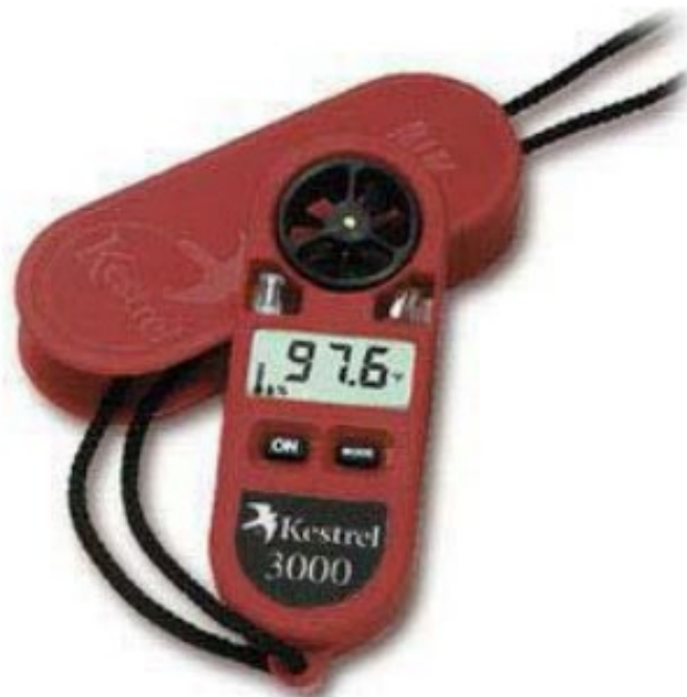
Slika 20: Uređaj za mjerenje wind chill indexa