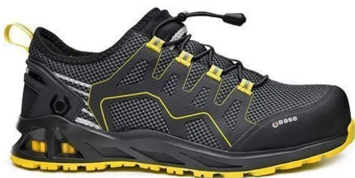
Slika 18: Radne cipele bez kapice

Za zaštitu nogu koriste se različite vrste radnih cipela, sa ili bez zaštitne kapice, uključujući antistatičke i protuklizne cipele. Postoje plitke radne cipele (do gležnja) i duboke radne cipele (iznad gležnja), prilagođene specifičnim potrebama radnog okruženja. [22]