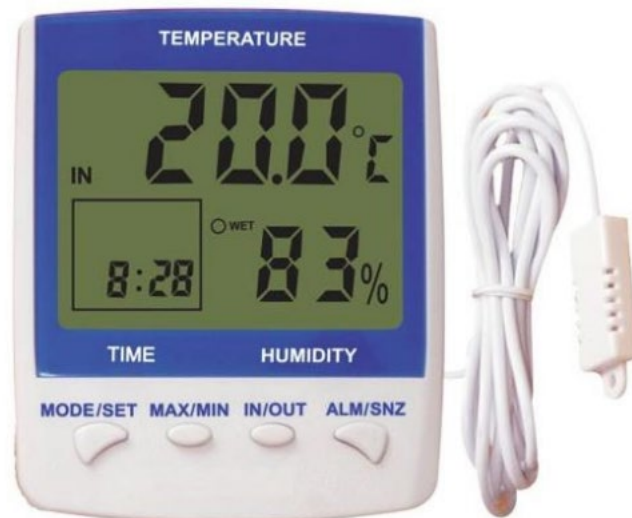
Slika 24: Termalni higrometar

U Kanadi se Humideks indeks koristi za analizu radnih uvjeta na radnim mjestima gdje su radnici izloženi toplinskom stresu, primjenom tzv. humideks plana. Humideks plan je sustav koji uključuje izračun toplinskog stresa na temelju Humideks indeksa, mjere za sprječavanje toplinskih bolesti te procjenu učinkovitosti tih mjera. Plan započinje mjerenjem temperature i vlage na radnom mjestu, a za mjerenje Humideksa koristi se termalni higrometar. [24]