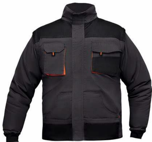
Slika 13: Radna jakna

Ovi zahtjevi osiguravaju da zaštitna odjeća pruža adekvatnu zaštitu, udobnost i funkcionalnost, čime se povećava sigurnost radnika u različitim radnim okruženjima.