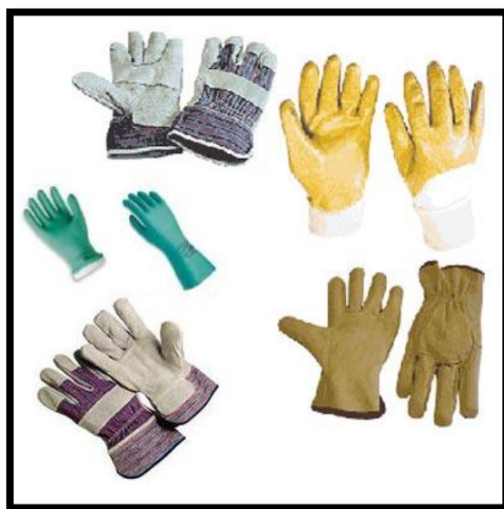
Sl. br. 28 Sredstva za zaštitu ruku