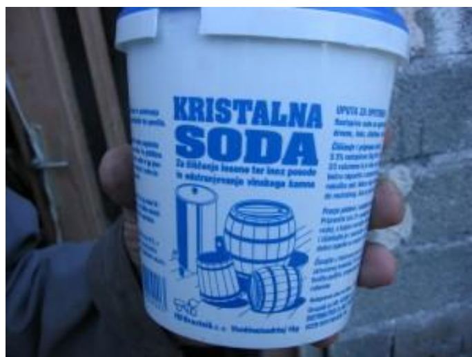
Sl. br. 3 Kristalna soda

To radimo tako da bačvu prvo napunimo hladnom vodom i ostavimo je tako napunjenu 2 - 3 dana. Nakon toga izlijemo vodu i bačvu ovinjavamo vrelom (prokuhanom) vodom u kojoj je otopljen natrijev karbonat (soda) 4 - 5 kg/100 litara. Bačvu zatvorimo i valjamo dok se voda ne ohladi. Vrlo je bitno da se voda u bačvi ohladi jer se hlađenjem vode u bačvi stvara podtlak koji iz duga izvlači tanin i druge nepoželjne tvari.