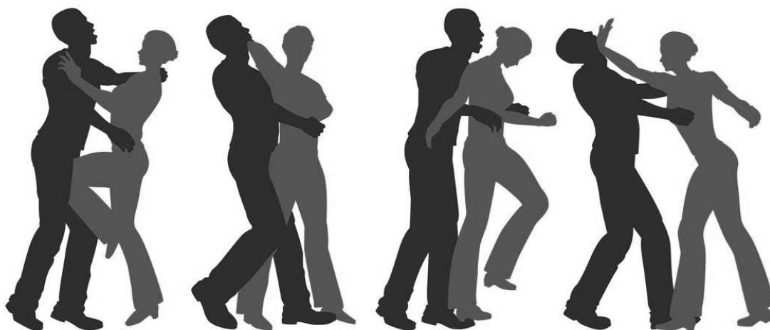
Slika 6 Prikaz obrane od napada [20]

druge od napada. Kod samoobrane jako je važno da se uči od osposobljenih osoba u suradnji s djelatnicima koji imaju stvarna iskustva u primjeni ove ovlasti. Jako je bitno da se uče samo one tehnike i taktike koje su primjenjive u praksi. Prilikom učenja treba poštivati faze usvajanja, usavršavanja, stabilizacije i automatizacije. Da bi dobili potrebne vještine potrebno je motorički zadatak puno puta ponavljati u različitim uvjetima. Ti uvjeti simuliraju stvarne situacije koje omogućuju uvid težine primjene različite tehnike i pružanja otpora kod samoobrane. Za primjenu tjelesne snage i zahvata boričkih vještina mora se redovito usavršavati, razvijati i vježbati. [11]