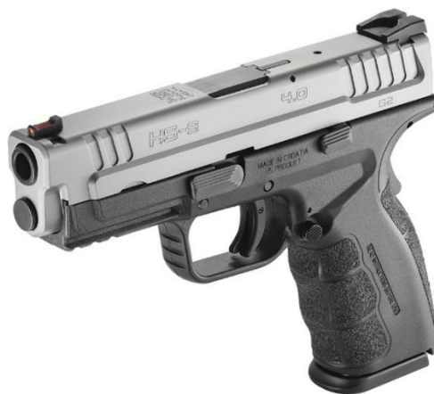
Slika 7 Vatreno oružje [20]

te osobe znaju zakonsku regulativu, kada mogu primijeniti svoje ovlasti ali i da posjeduju potrebno znanje i vještine. Praktična uporaba pištolja mogla bi se definirati kao motorička vještina koja čini niz pokreta koje izvodi osoba određenim slijedom. Ti pokreti sastoje se od: zauzimanja stava, hvata oružja, punjenja, korištenja funkcionalnih poluga, dovođenje oružja u visinu očiju, ciljanja, okidanja, otklanjanja zastoja i pražnjenje oružja. Pored ovih motoričkih radnji potrebno je znati i nositi pištolj i spremnik, položaj ruku i ostali elementi neverbalne komunikacije. [11]