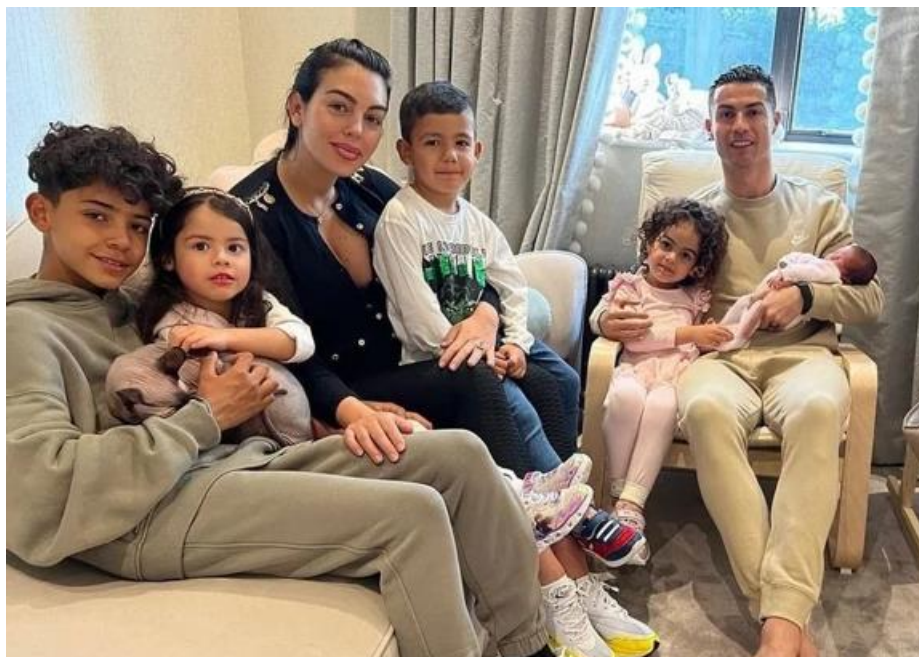
Slika 13 Ronaldo njegova partnerica i petero djece [27]

ostvario neki utjecaj na njega dovoljno je iskoristiti njegove najbliže i tako dolazi do opasnosti njega i njegove obitelji. Zato je bitna dobra komunikacija i pravilno ophođenje s članovima obitelji, a taktika i provođenje mjera je isto kao i kod zaštite Ronalda. [26]