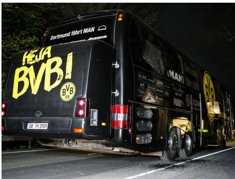
Slika 4 Autobus poslije napada [10]

Napad na autobus nogometaša Borussije Dortmund dogodio se 11. travnja 2017. godine, neposredno prije utakmice Lige prvaka protiv AS Monaca. Dok je autobus prevozio igrače na stadionu Signal Iduna Park u Njemačkom gradu Dortmund – u tri eksplozije su se dogodile u blizini, ranivši braniča Marca Bartra i jednog policajca koji je vozio službeni motor uz autobus. Zbog prijeloma ruke Bartra je bio operiran. Istraga je pokazala da je napad bio motiviran financijskim interesima. Sergej Venergold je imao dvojno državljanstvo, Njemačke i Rusije, uhićen je i kasnije osuđen za napad. Njegov plan je bio izazvati pad vrijednosti dionice Borussije Dortmund kako bi profitirao putem opcije dionice koju je prethodno kupio. Sergej Venergold pokušao je prikazati napad kao teroristički napad, ostavivši lažne tragove koji bi upućivali na islamističke teroriste, ali je ubrzo otkriven i osuđen na 14 godina zatvora za pokušaj ubojstva i izazivanje eksplozije. Ovaj napad istaknuo je važnost sigurnosti u sportu, posebno kada se radi o prijevozu igrača na utakmici. Nakon napada, sigurnosne mjere za sportske timove dodatno su pojačane, uključujući detaljnije sigurnosne provjere i povećanu prisutnost policije tijekom prijevoza igrača. [9]