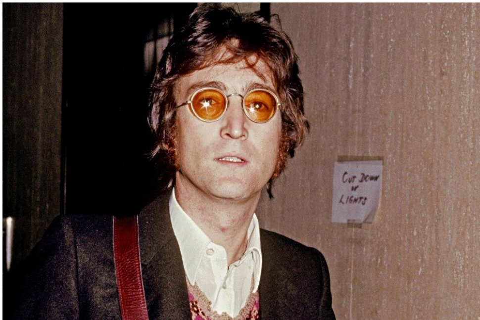
Slika 2 John Lennon [5]

da sigurnosni protokoli nisu bili dovoljno strogi ili efikasni. Kao poznata osoba, Lennon je primio brojne prijetnje tijekom svoje karijere. Prijetnje slavnim osobama mogu dolaziti od opsjednutih obožavatelja, nezadovoljnih bivših suradnika ili ljudi s mentalnim poremećajima. U slučaju Marka Davida Chapmana, njegova mentalna nestabilnost i opsesija Lenonom doveli su do tragičnog ishoda. Važnost praćenja i odgovaranja na prijetnje slavnim osobama tada nije bila na razini koja je danas standardna. Unatoč određenim sigurnosnim mjerama, Lennona je bilo moguće napasti zbog kombinacije faktora uključujući njegovu pristupačnost, nedostatak tjelohranitelja u ključnom trenutku i neadekvatne sigurnosne protokole zgrade. Ovi faktori su omogućili Chapmana da izvede svoj plan bez većih prepreka. Lennonova smrt naglasila je potrebu za boljim zaštitnim mjerama za slavne osobe. Danas, slavne osobe često koriste usluge profesionalnih sigurnosnih timova koji uključuju tjelohranitelje, napredne sigurnosne sustave i suradnju s lokalnim vlastima kako bi se osigurala njihova sigurnost. [4]