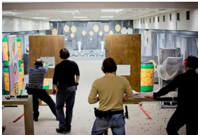
Slika 8 Trening gađanja iz pištolja [22]

korištenje pištolja će biti sigurnije. Navedeno nije dovoljno za poznavanje uporabe pištolja. U cilju prevencije bitno je da se pištolj nosi na pojasu na način koji će omogućiti da se može upotrijebiti na lak i brz način kao i pričuvni spremnici. Da bi osoba uvježbala praktičnu uporabu pištolja, potrebna je volja i trud za ponavljanjem radnji. Preporučuju se treninzi na suho i vježbe instinktivnog gađanja meta. Konačni produkt ovih treninga su psihička i fizička priprema za uporabu oružja. Uporaba vatrenog oružja je u stvarnosti jako stresno iskustvo. Uvježbavanjem taj se stres smanjuje i veća je vjerojatnost pravilnog postupanja u stvarnoj situaciji. [11]