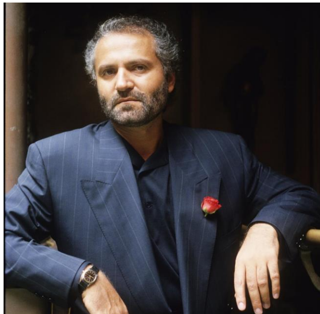
Slika 1 Gianni Versace [3]

ubojica Andrew Cunanan mogao lako pratiti i napasti na javnom mjestu. Versaceova svakodnevna rutina mogla je biti poznata njegovim obožavateljima i potencijalnim prijetnjama, što je Cunanu olakšalo da ga locira i planira napad. Ovo ukazuje na potrebu za promjenom rutine i povećanjem sigurnosnih mjera za javne osobe kako bi se smanjila njihova predvidljivost. U današnje vrijeme mnoge slavne osobe koriste napredne sigurnosne sustave, uključujući kamere, senzore i sustave za kontrolu pristupa. Dok su takvi sustavi možda bili dostupni i 1997. godine, njihova implementacija i učinkovitost u Versacevom domu bile su očito nedostatne. Suradnja s lokalnim vlastima može biti ključna za sigurnost slavnih osoba. Ovo uključuje brzo i učinkovito reagiranje na prijetnje i potencijalne opasnosti. Ubojstvo Giannija Versacea istaknulo je važnost sveobuhvatnih i učinkovitih sigurnosnih mjera za slavne osobe. Unatoč određenim postojećim mjerama, kombinacija predvidljive rutine, nedovoljno učinkovitih sigurnosnih sustava i možda nedostatak suradnje s lokalnim vlastima doprinijela je tragičnom ishodu. Danas, slavne osobe i njihovi sigurnosni timovi mogu učiti iz ovih događaja kako bi osigurali bolju zaštitu i prevenciju sličnih tragedija u budućnosti. [2]