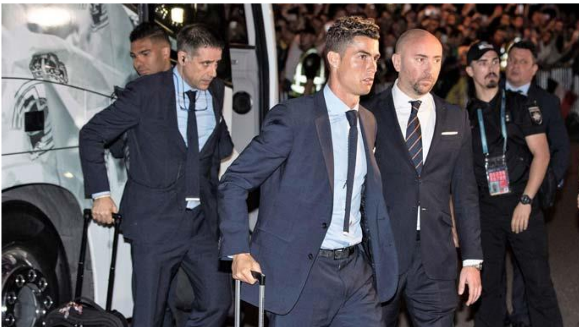
Slika 11 Ronaldo u pratnji osiguranja i policije na putu [24]

Tijekom davanja izjava medijima voditelj zaštite nalazi se u neposrednoj blizini Ronalda. Promatraju kretanje i reakcije novinara i snimatelja te reaguju ako dođe do ulaska u zonu koja predstavlja rizik za štíćenu osobu. [11] 33