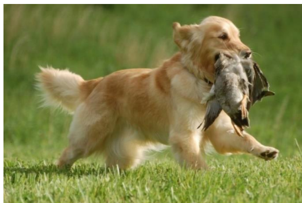
Slika 10. Zlatni retriver