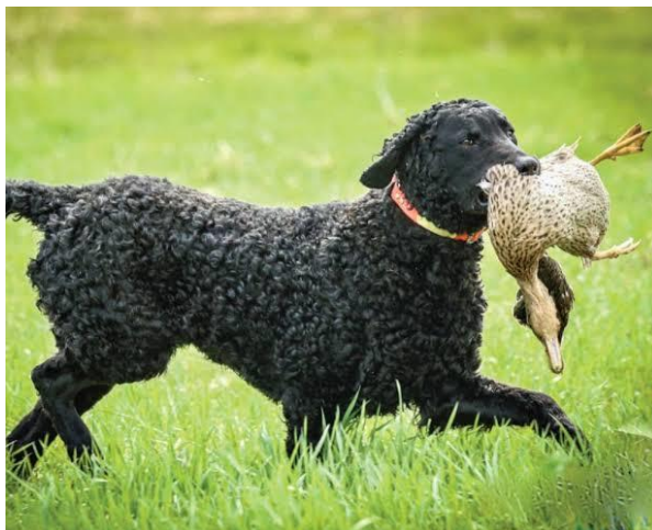
Slika 8. Kovrčavi retriver