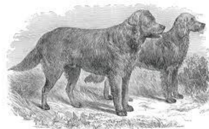
Slika 1. Ilustracija psa svetog Johna