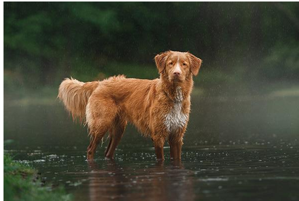
Slika 7. Tolling retriver

„Povijest retrivera je vrlo kratka u usporedbi s ostalim vrstama pasa, a u slučaju onih koje su uzgojile plemićke obitelji na britanskom otočju, većina podrijetla je dobro dokumentirana (ANONYMOUS, 2023).“ Zbog toga, usprkos čestom mišljenju, labrador nije jedina vrsta retrivera. Međunarodna kinološka federacija (FCI), u svojoj osmoj grupi, osim labrador retrivera, službeno priznaje i: tolling retrivera, kovrčavog retrivera, ravnodlakog retrivera, zlatnog retrivera i retrivera zaljeva Chesapeake . Američki kinološki klub također priznaje ovih pet rasa retrivera.