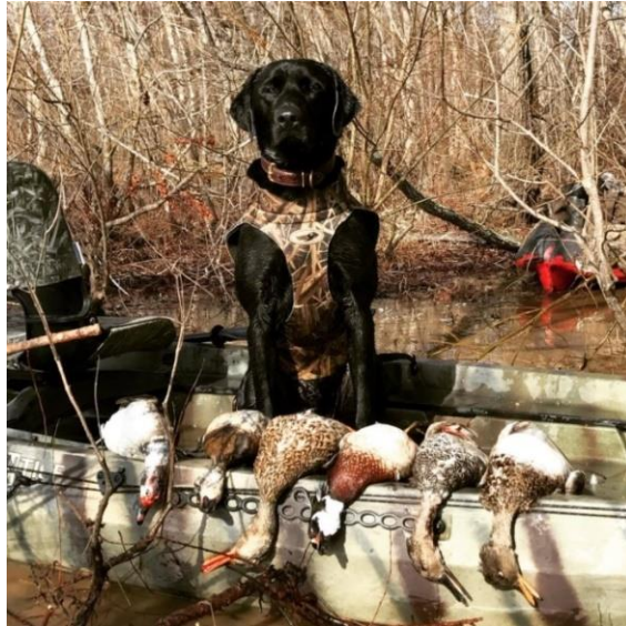
Slika 5. Labrador s ulovom

Osim za upotrebu u lovu na fazana, još se koriste i za lov na divlju patku, jarebicu, prepelicu i zeca, a mogu se koristiti i kao krvosljednici za pronalaženje odbjeglih i ranjenih divljači.