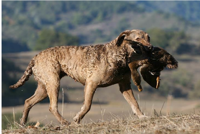
Slika 11. Retriver zaljeva Chesapeake