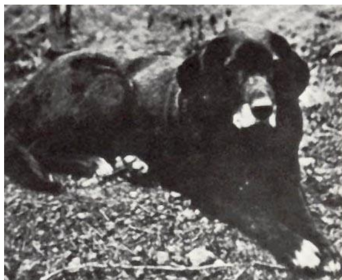
Slika 2. Pas svetog Johna