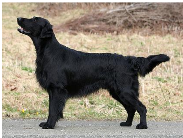
Slika 9. Ravnodlaki retriver