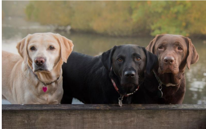
Slika 3. Prikaz boja kod labradora