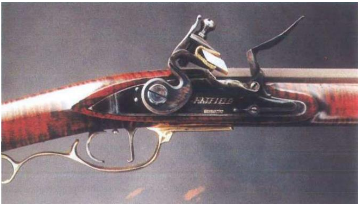
Slika 5: Puška kremenjača

nazvane kolašice. Ovaj model se zbog mehanizma koji je bio složen, skup i težak uskoro napušta. Daljnji napredak je sustav kremenjača. Kokot je u svom rascjepu držao kremen, iskra se stvarala udarom kokota. Otkrićem živina fulminata koji ima osobinu samopaljenja pod utjecajem mehaničkog udara, došlo se do kapisle i pušaka kapislara. Te su puške također punjene barutom i kuglom od naprijed (nabijača, prednjača). Kapsilare su vrhunac razvoja nabijača. U 17. stoljeću izrađuje se prva puška olučenom cijevi (spiralno bušenje). Prvu uporabljivu stražnjaču (ostragušu), tj. pušku koja se punila cijelim nabojem sa stražnjeg kraja cijevi konstruirao je Lefaucheux početkom 19. stoljeća, na bazi naboja s iglom ugrađenom okomito u rub naboja.“