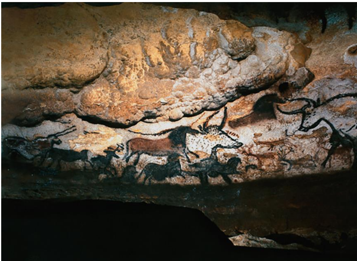
Slika 1: Slika lova u špilji Lascaux

Prvi su se ljudi hranili samo biljnom hranom, da bi kasnije (kad su počeli iz kamena praviti oruđe i oružje) potražili i drugi izvor prehrane – životinje, koje su pružale ogromne količine mesa i krzna (DARABUŠ i JAKELIĆ, 1996). Dragocjene podatke o životinjama toga vremena i sredstvima lova dala su nam razna arheološka iskapanja posebno u špiljama te špiljski crteži (GARDAŠ, 2017).