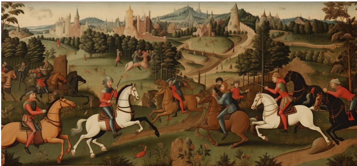
Slika 3: Lov za vrijeme srednjeg vijeka

njen uzgoj se nije nitko brinuo (BLAGAIĆ, 2002). Regalna prava (lat. iura regalia) su ovlaštenja koja su u feudalnom razdoblju predstavljala izraz vladareve suverenosti i donosila su im imovinski prihod (JANICKI i sur., 2004). Srednji vijek je tako doba apsolutne vlasti kraljeva i plemstva kada se razvija regalno pravo lova koje ostaje stoljećima na snazi u Europi. Zemljište i sve ostalo je u vlasništvu kraljeva kojima je pripadalo isključivo pravo lova dok je ostalom stanovništvu (puku i tada još malobrojnom građanstvu) lov bio zabranjen pod prijetnjom strogih sankcija (DARABUŠ i JAKELIĆ, 1996; DARABUŠ i sur., 2012; GARDAŠ i HAMAN, 2017; GARDAŠ i ALEBIĆ, 2018).