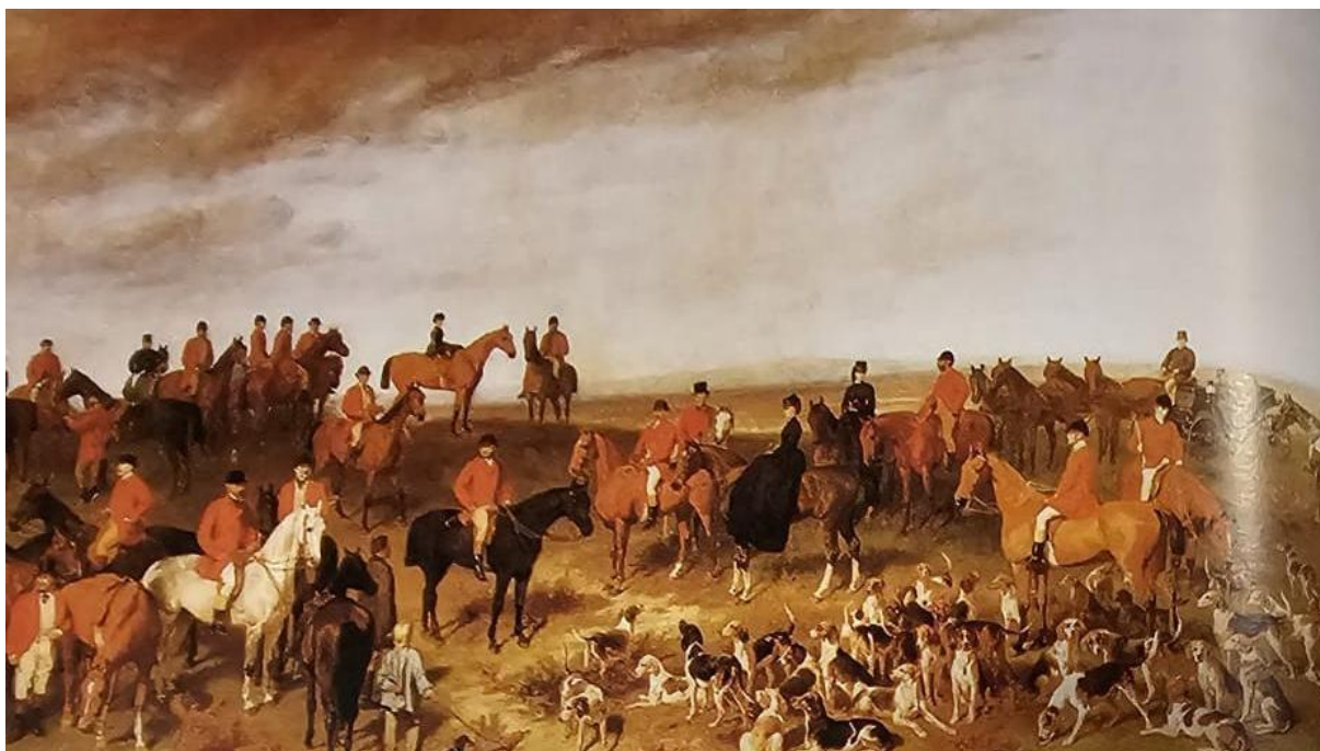
Slika 4: Wilhelm von Kobell, Lov na zečeve (preuzeto iz Bluchel, 2011)

Lov nije bio samo zabava, nego i izvor hrane, budući da je divljač bila posebno važan dio plemićkog jelovnika (PONGRAC, 2004) te je i kao posebna poslastica zauzimala značajno mjesto na srednjovjekovnim stolovima (GARDAŠ i HAMAN, 2017). Na dvorovima se najčešće jela svinjetina, jeleni i mladi zečevi. Ptice su bila prikladna hrana jer su se mogle jesti i za vrijeme posta, jer se smatraju vodenim životinjama. Konzumirao se veliki broj divljih ptica: čaplje, ždralovi, rode, kormorani, galebovi, čvorci, kosovi, divlje patke, fazani, prepelice, jarebice, vrane, drozdovi i kukavice. A od uzgojenih su najčešće konzumirane guske, kokoši i patke. Najcjenjeniji su bili labudovi i paunovi, koji su se posluživali na gozbama ukrašeni vlastitim perjem (PONGRAC, 2004).