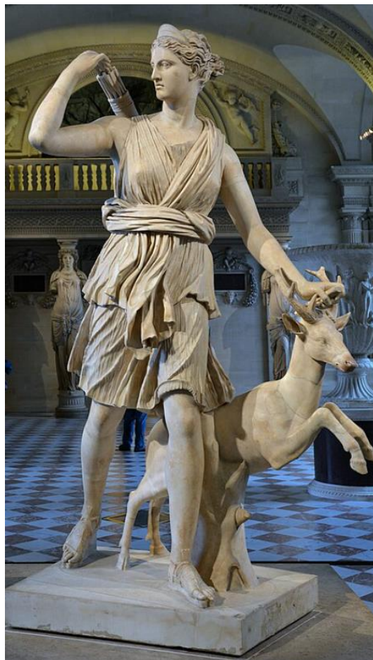
Slika 2: Artemida, rimska mramorna skulptura, 1./2. stoljeće

U starom vijeku (koje je trajalo od pojave prvog pisma oko 3500. g. pr. Kr. do pada Zapadnog rimskog Carstva 476. g) kada se do glavnih izvora hrane dolazilo prvenstveno zemljoradnjom i stočarstvom, značaj se lova kao izvora hrane potiskuje u drugi plan (CEPELIĆ i GARDAŠ, 2004). Lov postaje razonoda i dopunski izvor kvalitetne hrane te vježba za ratne vještine (DARABUŠ i JAKELIĆ, 1996). U to doba su nastala i božanstva koja štite lov i lovce – u Babilonu to je bog Nimrod, u Grčkoj božica Artemida kojoj bjehu posvećeni košuta i jelen, a u Rimu božica Dijana (DARABUŠ i sur., 2012).