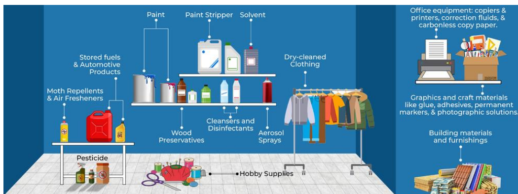
Slika 2 Hlapljivi organski spojevi u blizini čovjeka. [22]

Slika 2. u nastavku prikazuje ilustraciju izvora hlapljivih organskih spojeva u blizini čovjeka.