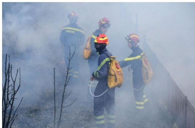
Slika 3. Vatrogasci na gašenju šumskih požara [29]