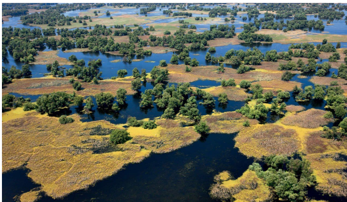
Slika 8: Kopački rit