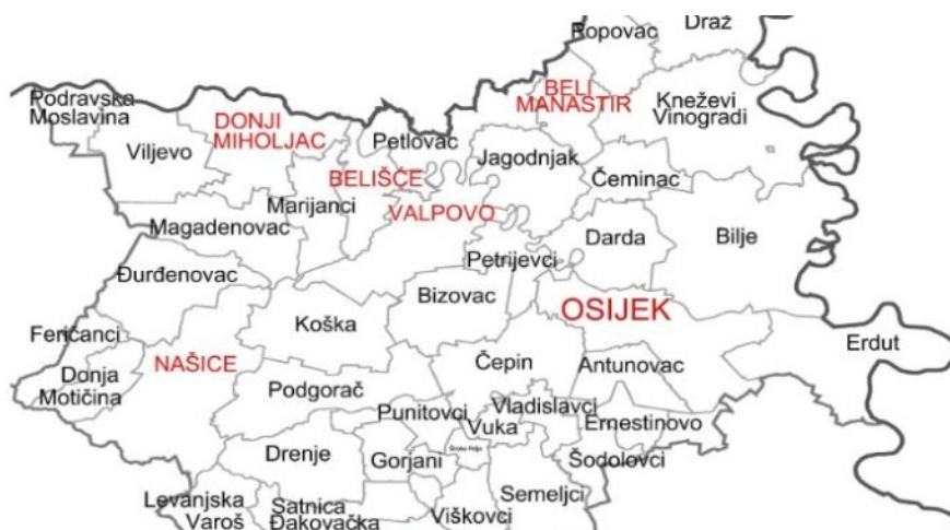
Slika 7: Osječko - baranjska županija