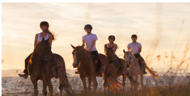
Slika 3: Trail jahanje