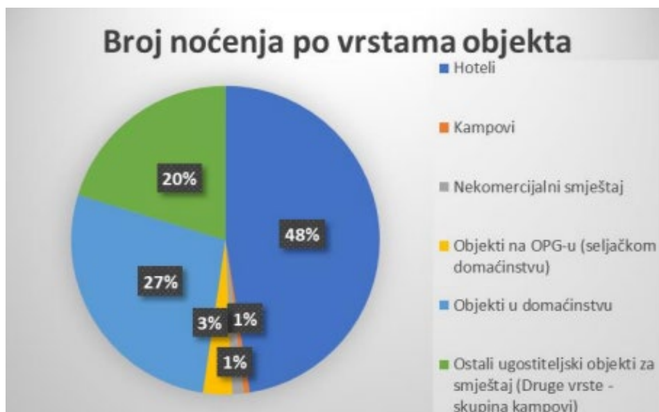
Grafikon 2: Broj noćenja po vrstama objekata