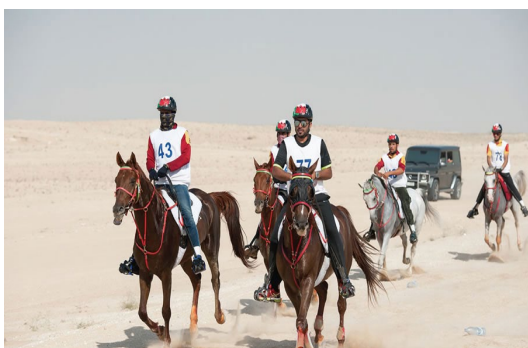
Slika 5: Trekking jahanje