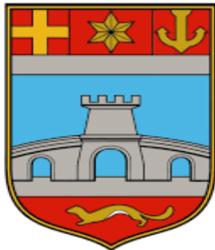
Slika 6: Grb Osječko- baranjske županije