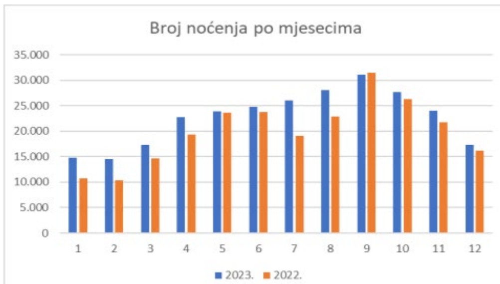
Dijagram 1: Prikaz broja noćenja po mjesecima za 2023. i 2022. godinu