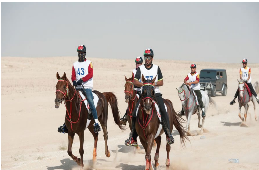
Slika 5: Trekking jahanje