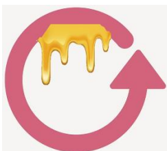
Slika 10. Re-fill naljepnica

Medovina ili gvirac dolazi u običnoj staklenoj boci. Ipak, „Košnica Žalac“ želi uključiti i ekološku osviještenost potrošača. Osmislili su posebnu „refill“ naljepnicu koja se nalazi na njihovim plastičnim bocama. Tako kada kupci kupe medovinu, ukoliko žele mogu istu tu bocu donijeti i napuniti je ponovno. Boca je volumena od 1 litre. Naljepnica je zelene boje te s nje u unutrašnjosti kapa med.