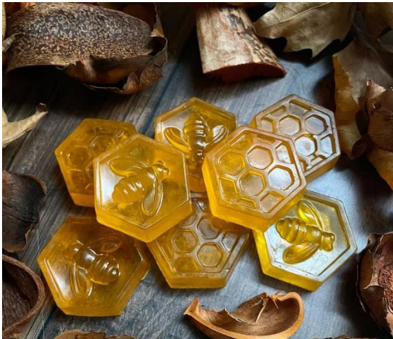
Slika 16. Sapun od meda