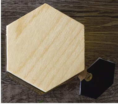
Slika 6. Drveni dodatak za čep