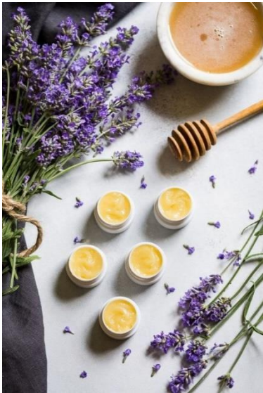
Slika 14. Ambalaža balzama od lavande