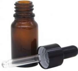
Slika 8. Staklena bočica sa pipetom