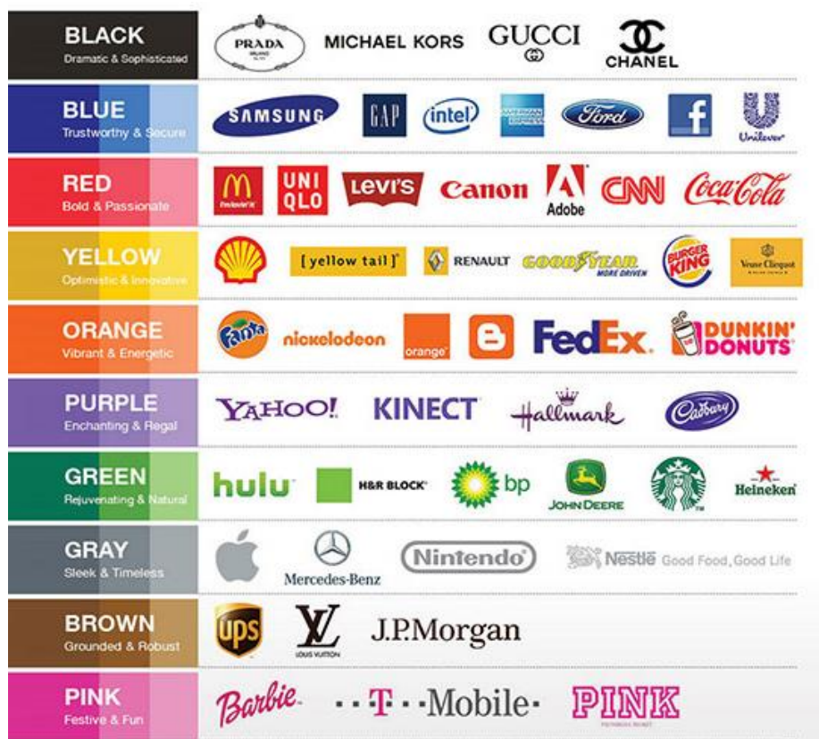
Slika 2. Primjeri logotipa po bojama