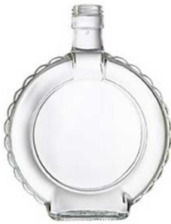
Slika 11. Čaturica

Izvor: Čaturica, https://www.glassmarket.rs/proizvod/cutura-0-75l/ (27.11.2023.)