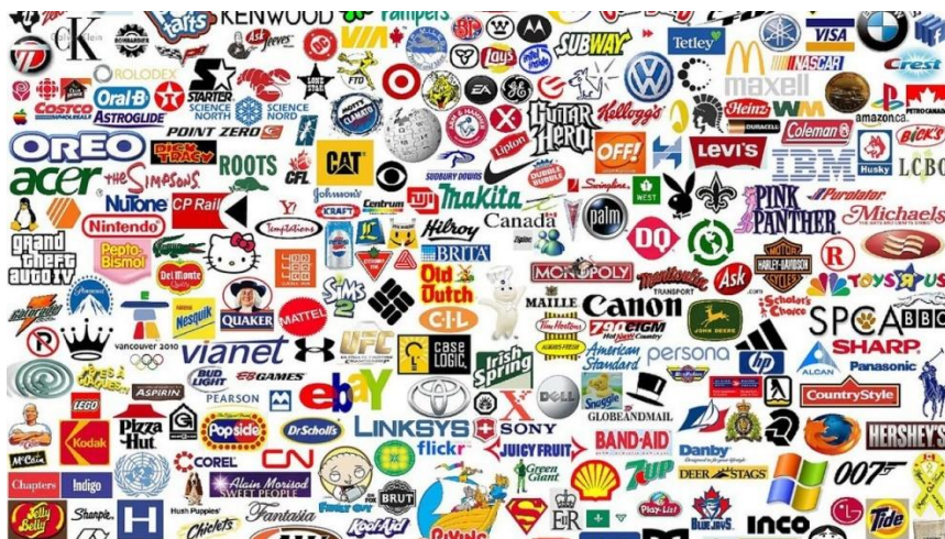
Slika 1. Razni logotipi