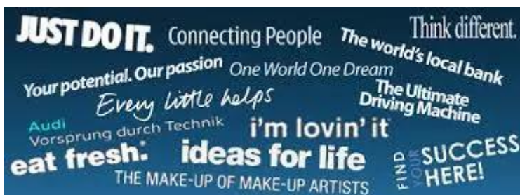
Slika 3. Poznati slogani