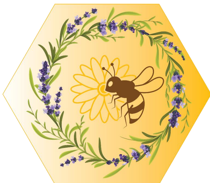
Slika 21. Slogan s logom

Košnica Žalac Od naše košnice do Vaše smočnice