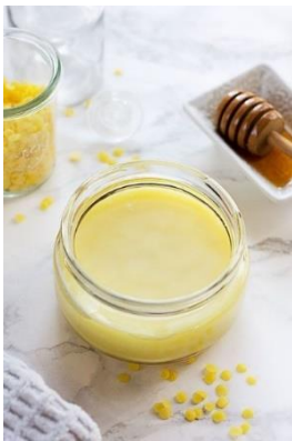
Slika 13. Ambalaža medenog balzama