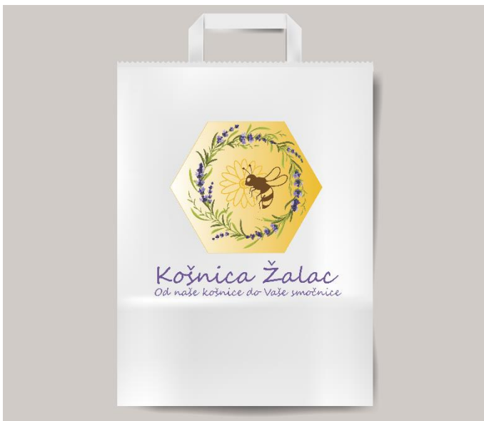
Slika 17. Papirnata vrećica

Kako brinemo o ekološki prihvatljivoj ambalaži tako brinemo i o vrećicama u kojima šaljemo proizvode ili ukoliko se kupuju direktno kod nas. Koristimo papirnate vrećice koje možete vidjeti na slici ispod. Na njoj se nalazi naš logo, naziv te slogan da bude prepoznatljivo.