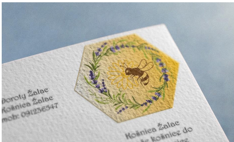
Slika 20. Logo Košnice Žalac