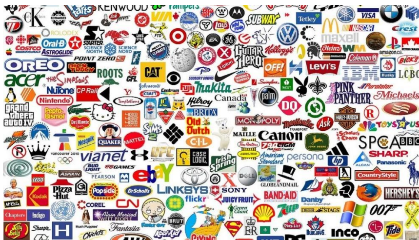
Slika 1. Razni logotipi