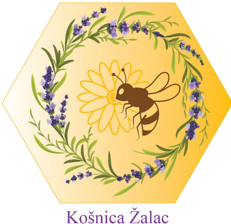
Slika 19. Logo s natpisom

Logo Košnice Žalac sastoji se od šesterokutnog (heksagonog) oblika u kojem se nalazi simbol pčele, lavande te suncokreta. Šesterokutni oblik predstavlja saće. Unutar njega u samoj sredini nalazi se simbol pčele koja leti. Ona predstavlja djelatnost pčelarstva. Simbol lavande koje je u obliku vijenca te suncokret koji je skriva iza simbola pčele. Oba cvijeta su izabrana jer se nalaze u velikom broju naših proizvoda te posjedujemo polja lavande i suncokreta. Cijeli logo je u boji. Imamo i logo na kojem se nalazi naziv Košnica Žalac.