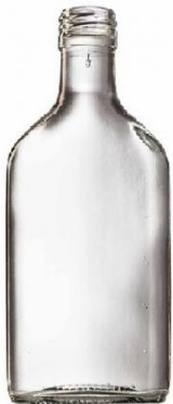
Slika 12. Flask