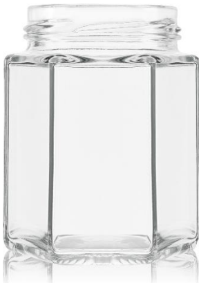
Slika 5. Staklenka u obliku saće