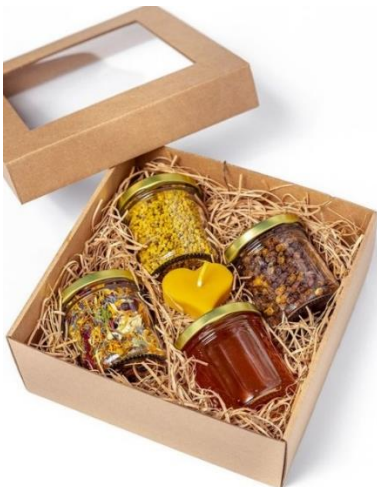
Slika 15. Kutija sa papirnatim punjenjem