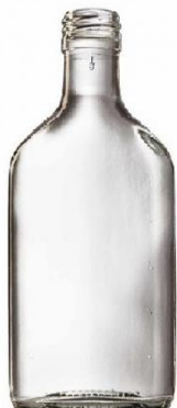
Slika 12. Flask