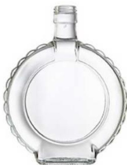
Slika 11. Čaturica