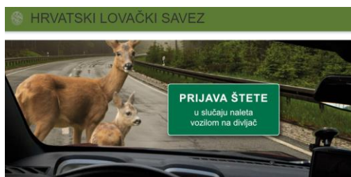
Slika 3. Prijava štete, Hrvatski lovački savez [43]

Oštećenik, tj. vlasnik vozila koje je naletjelo na divljač, mora ispuniti obrazac „Prijava štete“ koji je dostupan na internetskim stranicama Hrvatskog lovačkog saveza (Slika 3). Prijava se dostavlja elektronski putem e-maila ili u fizičkom obliku poštom na adresu Hrvatskog lovačkog saveza (Slika 4) [44].