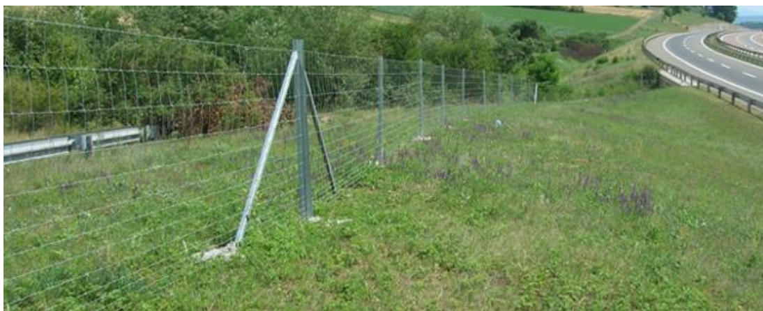
Slika 8. Zaštitna ograda od divljači [62]

Visoke ograde su učinkovite za sprječavanje ulaska većih životinja poput jelena ili srna, dok niže barijere mogu biti dovoljne za manju divljač. Na slici 8 prikazana je zaštitna ograda od divljači uz autocestu. Također, integracija posebnih prolaza za životinje ispod ili uzduž ograde može omogućiti divljači da sigurno pređe cestu bez opasnosti za promet.