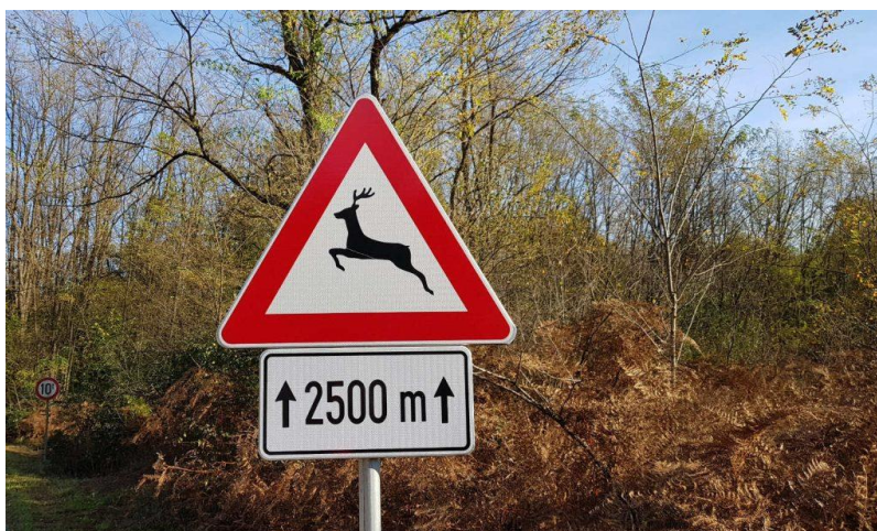
Slika 7. Znak „Opasnost – divljač na cesti“ s dopunskom pločom [61]

kritične dionice od 2500 metara. Time se vozačima jasno daje do znanja na kojem dijelu ceste je povećan rizik od susreta s divljači.