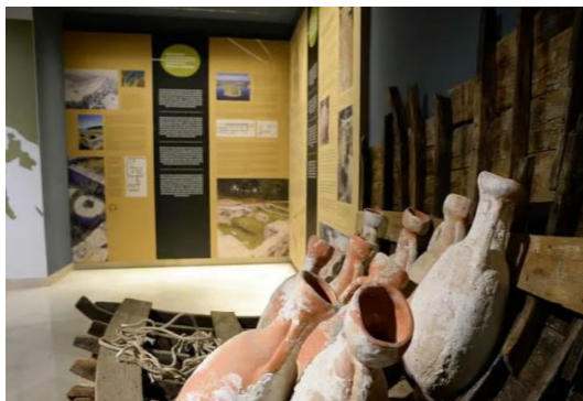
Slika 13. Unutrašnjost muzeja istarskog maslinovog ulja