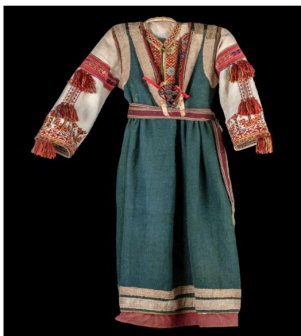
Slika 6. Perojska nošnja