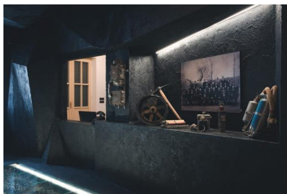
Slika 10. Unutrašnjost kovarske kuće Arsia