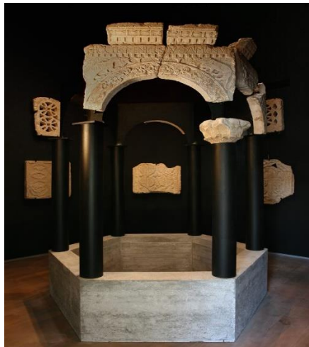
Slika 15. Replika nekadašnje krstionice u novigradskoj katedrali