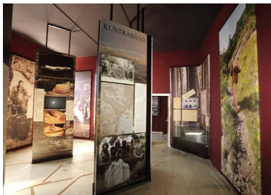
Slika 3. Unutrašnjost muzeja Vlaški puti

Izvor: Istra https://www.istra.hr/hr/dozivljaji/kultura/muzeji-i-zbirke/3488 (10.06.2023.)