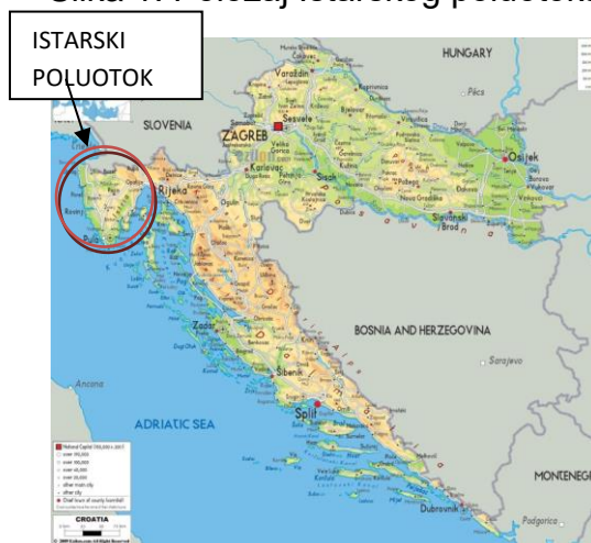
Slika 1. Položaj Istarskog poluotoka