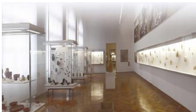
Slika 4. Unutrašnjost arheološkog muzeja