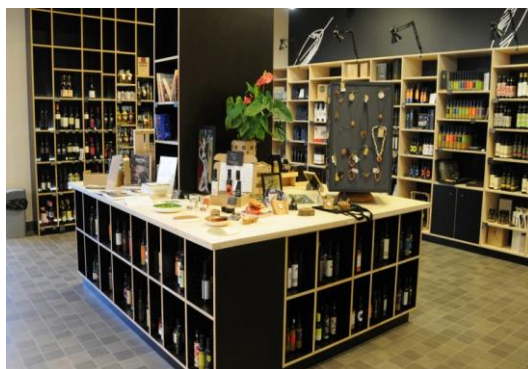
Slika 12. Prodaja maslinovog ulja