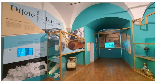
Slika 8. Likovna zbirka