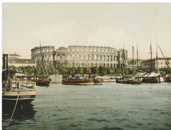
Slika 9. Fotografija Istre iz druge polovice 19. st.