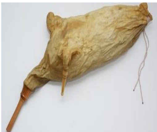
Slika 7. Mušnice s mjehurom