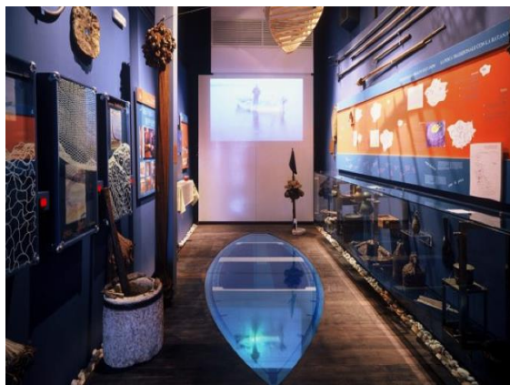
Slika 2. Unutrašnjost Eko-muzeja Batana