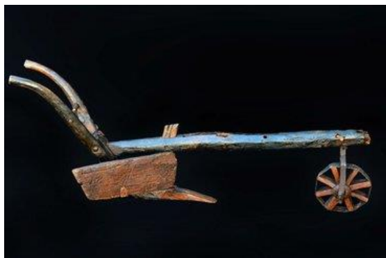
Slika 5. Plug