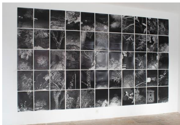
Slika 16. Izložba „Ursulin vrt“