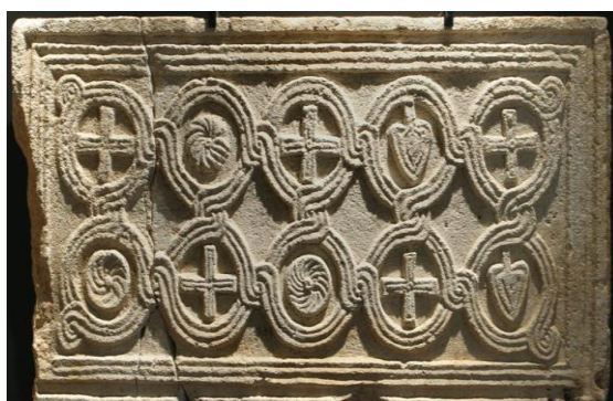
Slika 14. Plutej oltarne ograde