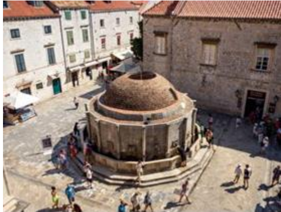
Slika 20. Velika Onforijeva česma