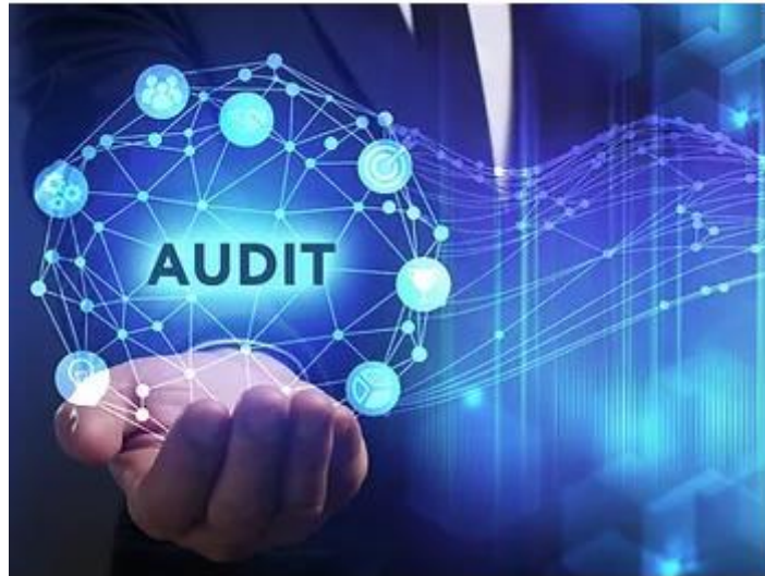
Slika 8. Ilustracija – auditom saznati iz „prve ruke“