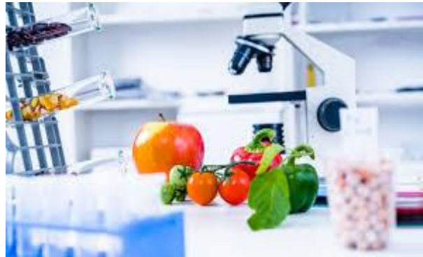
Slika 10. Zdravstvena kontrola hrane, izvor; (Đokić i sur., 2024).

Proizvodnja hrane usko je povezana s uporabom pesticida s argumentom da pesticidi štite usjeve od bolesti i štetnika, čime se povećavaju prinosi i kvaliteta hrane. Međutim, ova tvrdnja nije široko prihvaćena, prvenstveno zbog rizika koje izloženost pesticidima predstavlja za ljude. Prisutnost ostataka pesticida u hrani danas se smatra značajnim globalnim zdravstvenim problemom (Đokić i sur., 2024).