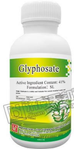
Slika 2. Pakiranje glifosata za primjenu u poljoprivredi

Do danas javnost zna za 41. vrstu kod koje je potvrđena otpornost (Ostojić i sur., 2018).