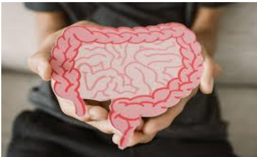
Slika 7. Složenost probavnog trakt kod ljudi.

Butirat je glavni izvor energije za ljudske kolonocite, može izazvati apoptozu stanica raka debelog crijeva te aktivirati crijevnu glukoneogenezu, imajući tako pozitivan učinak na homeostazu glukoze i energije. Raznolikost crijevnog mikrobioma pokazatelj je zdravlja dok slabija raznolikost primijećena je kod ljudi s upalnim bolestima crijeva, dijabetesom, celijakijom, pretilošću itd.