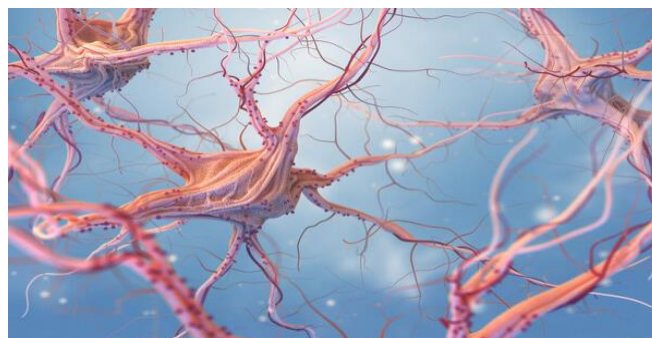
Slika 9. Nervus Vagus -10. moždani živac, najduži i najsloženiji od kranijalnih živaca, izvor; https://meddox.com/hr/blog/Zivac-vagus-Koja-je-njegova-uloga-i-kako-stimulirati-najduzi-zivac-u-tijelu~p13591