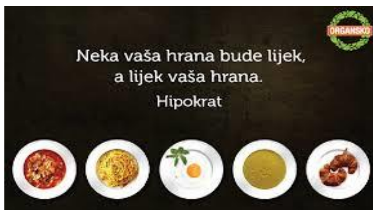
Slika 11. Prisutnost glifosata u svim analiziranim uzorcima, izvor; (Soares i sur., 2021).