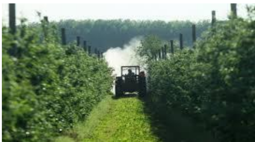
Slika 15. Korištenje glifosata u voćnjacima, izvor: (Jenčić Bojanić, 2023).

Odbor za zakonodavstvo Hrvatskog sabora 11. ožujka 2020. godine odbio je prijedlog Zakona na temelju mišljenja Vlade RH od 17. listopada 2019., u kojem Vlada ističe kako na temelju znanstvene procjene nije dokazano da postoji veza između glifosata i pojava karcinoma u populaciji. Stoga se u RH, na temelju propisa EU mogu koristiti samo one tvari za koje postoje dokazi da su sigurne za upotrebu (Jenčić Bojanić, 2023).