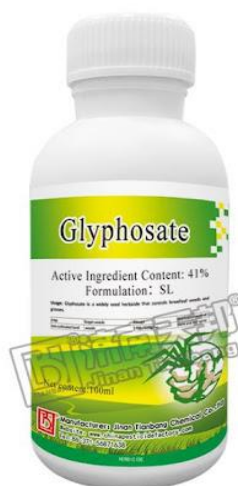
Slika 2. Pakiranje glifosata za primjenu u poljoprivredi

Do danas javnost zna za 41. vrstu kod koje je potvrđena otpornost (Ostojić i sur., 2018).