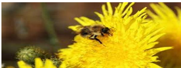
Slika 5. Negativan utjecaj glifosata i AMPA na zdravlje biljaka i životinja, izvor; (Van Bruggen i sur., 2017).

Glifosat se koristio dugi niz godina pod pretpostavkom da ima minimalne nuspojave, međutim posljednjih godina u cijelom svijetu porasla je zabrinutost zbog potencijalnih širokih izravnih i neizravnih učinaka na zdravlje. Ostaci glifosata pronađeni su u mnogo različitih vrsta voća i povrća, te su otkriveni čak i u obranim namirnicama koje su zasađene nekoliko mjeseci nakon primjene glifosata.