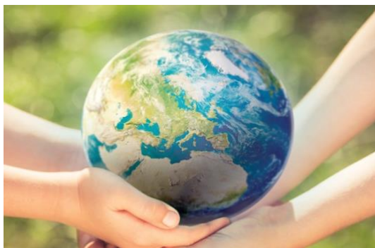
Slika 14. Globalni problem vezan uz upotrebu glifosata, izvor; (Jenčić Bojanić, 2023).

Glifosat je prvi put odobren za uporabu u EU davne 2002. godine i ubrzo je postao jedan od najraširenijih herbicida u cijeloj regiji. EU prema akcijskom planu preispituje odobrenje aktivnih tvari poput glifosata svakih 10 godina. Ovim procesom upravljaju Europska agencija za sigurnost hrane (EFSA) i Europska agencija za kemikalije (ECHA), koji procjenjuju sigurnost i utjecaj tvari na okoliš. Godine 2017-te nakon opsežne rasprave i znanstvenog pregleda, Europska komisija obnovila je odobrenje glifosata za još pet godina, produživši njegovu upotrebu do prosinca 2022. godine. Ta je odluka bila kontroverzna i naišla je na protivljenje nekoliko država članica EU-a, kao i organizacija civilnog društva, zbog zabrinutosti za sigurnost zdravlja ljudi i životinja (Robinson, 2012). Europska komisija (EK) je odgovorna za određivanje MRL-ova tj. dopuštenih koncentracija rezidua u hrani unutar Europe, a te se granice povremeno preispituju. EFSA je 2019. godine na zahtjev EK-a izvršila reviziju MRL-a za glifosat, no za sada se čini da EK nije prihvatila te vrijednosti, pa je to bitno učiniti što prije (Soares i sur., 2021). Europska unija odobrava aktivne tvari, dok države članice odobravaju sredstva za zaštitu bilja (Ostojić i sur., 2018).