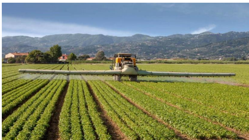
Slika 4. Prskanje sadnica herbicidom pomoću mehanizacije.

Zbog ovih zabrinutosti, uporaba glifosata je podložna sve većoj regulatornoj kontroli i u nekim slučajevima ograničenjima ili zabranama u određenim zemljama i regijama (Harker i O'Donovan, 2013).