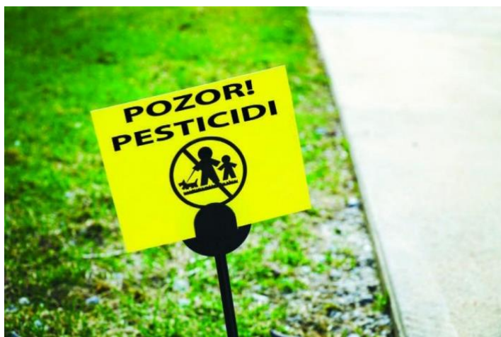
Slika 13. Znak koji pokazuje zagađenost tla pesticidima, izvor; (Ješić-Drinković, 2022).

Glifosat je bio predmet redovitih procjena nacionalnih i međunarodnih regulatornih agencija. Utvrđeno je da glifosat ima relativno nisku toksičnost kod sisavaca (Tarazona i sur., 2017). U ožujku 2015. Svjetska organizacija za istraživanje karcinoma (IARC) objavljuje Monografiju o toksikologiji 5 organofosfornih insekticida i o glifosatu, kojom ga se klasificira (skupina A2) kao tvar koja „vjerojatno uzrokuje karcinom kod ljudi“.