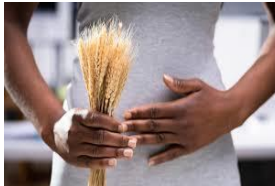
Slika 12. Celijakija - neizlječiva bolest probavnog sustava, izvor: (Ješić-Drinković,2022).

S druge strane, još i do danas nije u potpunosti razjašnjen mehanizam nastanka malignih komplikacija (Soares i sur., 2021). Stoga je potrebno provesti istraživanja na većem broju ispitanika, koja će dati detaljniji uvid u navedenu problematiku te donijeti konačan sud o nužnosti doživotne bezglutenske prehrane i u asimptomatskih bolesnika, iako se ona danas preporučuje svim bolesnicima kojima je dokazana celijakija.