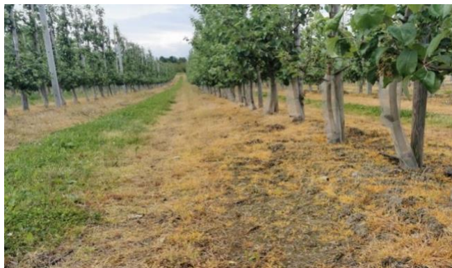
Slika 6. Utjecaj glifosata na korov i travu u voćnjaku izvor; (Van Bruggen i sur., 2017).

Glifosat se adsorbira odnosno plinski ili tekući rastvor akumulira se na površini čvrstog materijala ili, rjeđe, tekućine (adsorbenta), formirajući molekularni ili atomski film (adsorbat), u ovom slučaju najčešće na glinu i organsku tvar te tako usporava njegovu razgradnju mikroorganizmima iz tla i dovodi do akumulacije u tlu tijekom vremena. Kao rezultat toga glifosat i njegov produkt AMPA mogu postojati dulje od godinu dana u tlu s visokim udjelom gline, ali se mogu brzo isprati iz pjeskovitog tla. U prošlosti se glifosat nije smatrao problemom za podzemne i površinske vode jer ima relativno nizak potencijal da se kreće kroz tlo i zagađuje izvor vode. Međutim, unatoč vezanju za glinu i organsku tvar, dijelovi glifosata i njegovog metabolita AMPA završavaju u otopljenoj fazi u podzemnim vodama nakon jake kiše (Van Bruggen i sur., 2017).