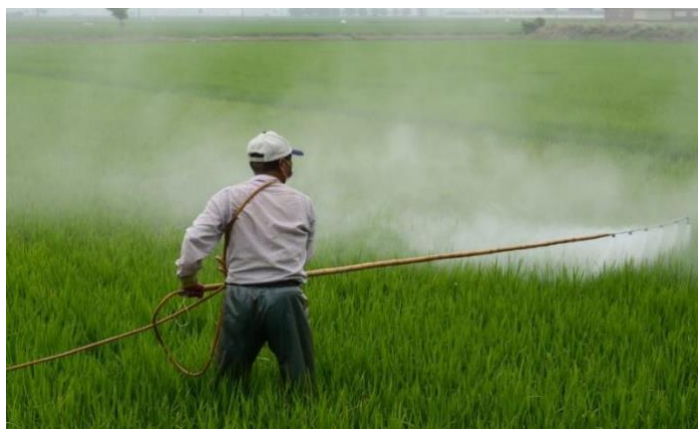
Slika 3. Primjena Glifosata, poluraspad 6 do 41 dan

Glifosat djeluje sistematski, što znači da se apsorbira kroz lišće i prenosi kroz cijelu biljku (Beckie i sur., 2020).