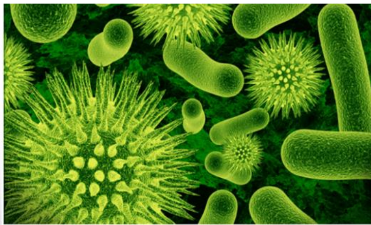
Slika 8. Crijevni mikrobiom, izvor; (Han i Xiao, 2020).

Zdravi crijevni mikrobiom prosječne osobe sastoji se od 160 vrsta bakterija, a neke od njih su: Clostridium , Lactobacillus , Bacillus , Enterococcus , Ruminococcus , Bacterioides , Prevotella , Bifidobacterium (Berding i sur., 2021).