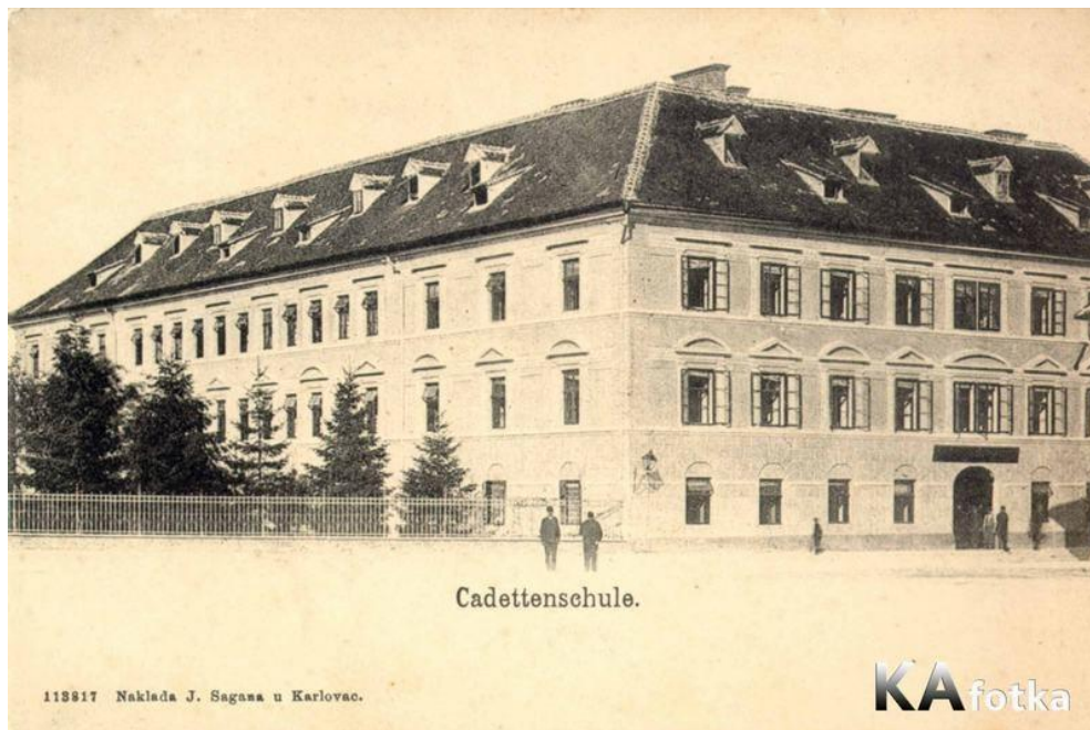
Slika [1] Veleučilište ili kadetska škola Karlovac 1900-1940