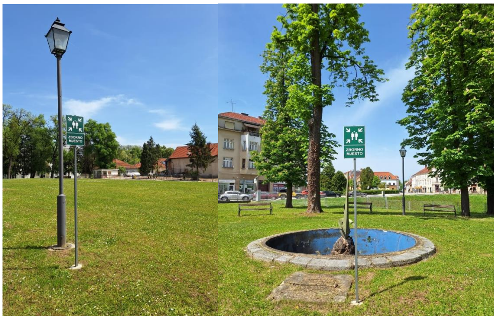
Slika [11] Zborno mjesto parkiralište