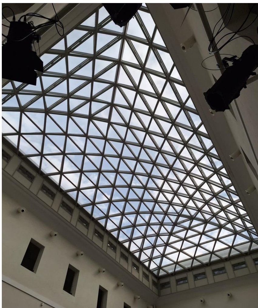
Slika [9] Svjetlarnik

otvora s poda. Kad su prozori, svjetlarnici, otvori za provjetravanje i drugi otvori otvoreni, ne smiju predstavljati rizik za radnike i druge osobe. Prozori, svjetlarnici i ostakljene površine moraju biti izvedene i opremljene napravama odnosno opskrbljene pomoćnim sredstvima i uređajima (pomične ljestve ili platforme, pomične staze, itd.) za lako, učinkovito i sigurno čišćenje i održavanje, bez rizika za radnike koji obavljaju te poslove odnosno osobe prisutne u i oko građevine. Prozori, bez ili s niskim parapetima te vanjska i balkonska vrata i slični otvori, moraju biti osigurani ogradama ili zaštićeni na drugi odgovarajući način.[14]