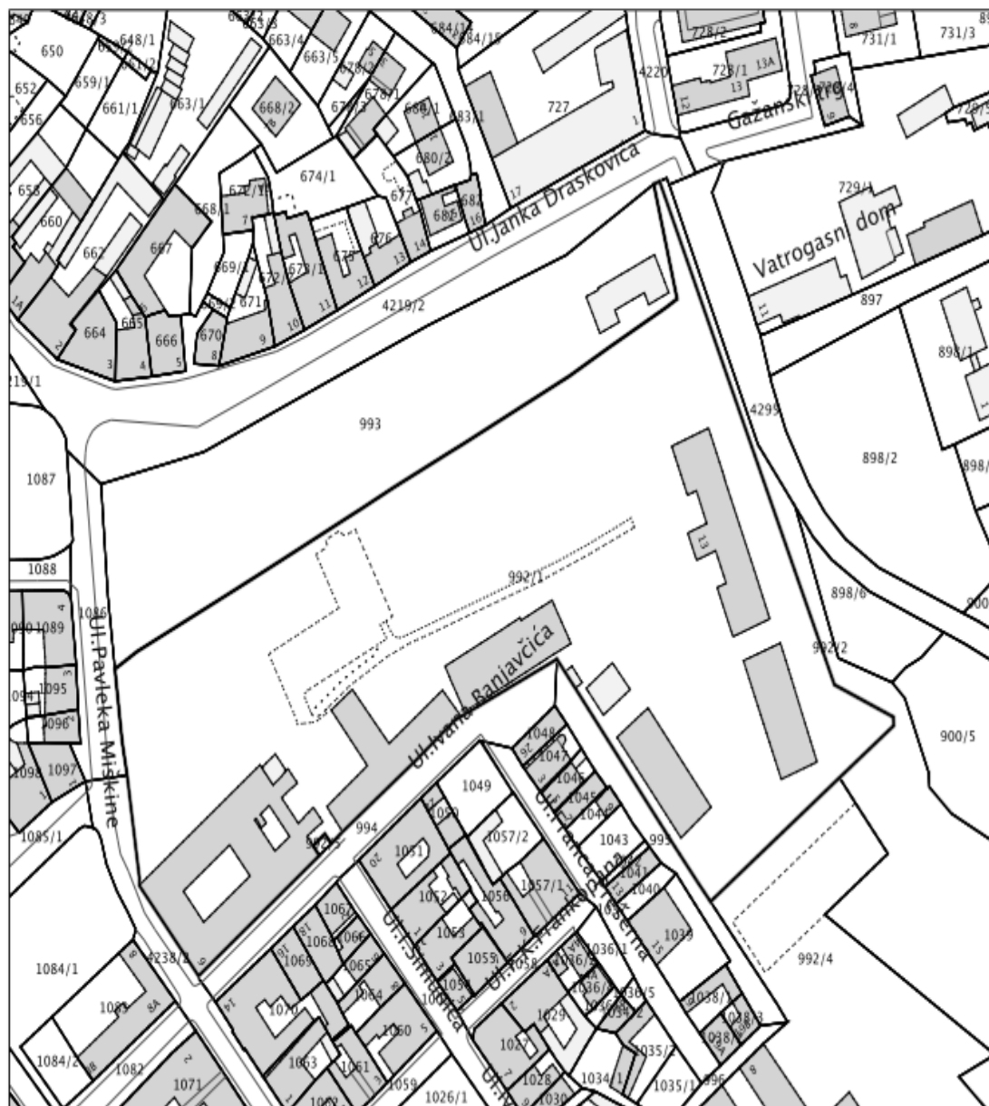
Slika [5] Kopija katastraskog plana Veleučilišta