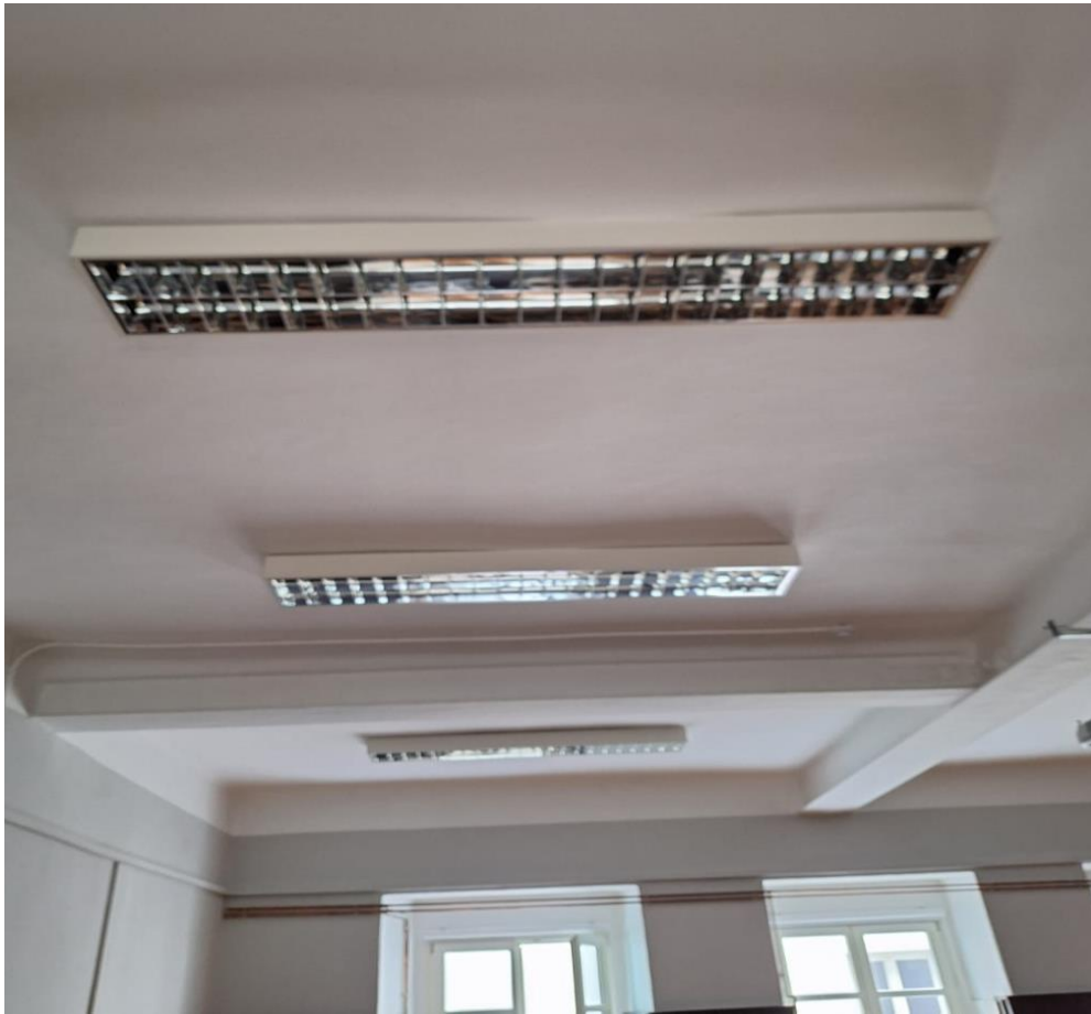
Slika [8] Umjetna rasvjeta Veleučilišta