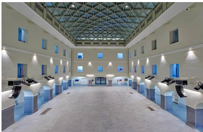
Slika [2] Unutrašnjost Veleučilišta

Godine 2019. Veleučilište je dobilo na dar dvije nekretnine (od RH, Ministarstva državne imovine) – Bosanski magazin i staru Vojnu bolnicu u Zvijezdi. Te nekretnine će se koristiti za proširenje kapaciteta studentskog doma i izgradnju restorana studentske prehrane. Za obje nekretnine ishođena je građevinska dozvola, te će njihova rekonstrukcija dodatno poboljšati životni standard studenata.