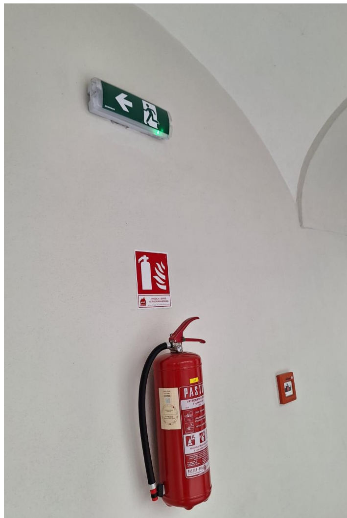
Slika [15] Vatrogasni aparat