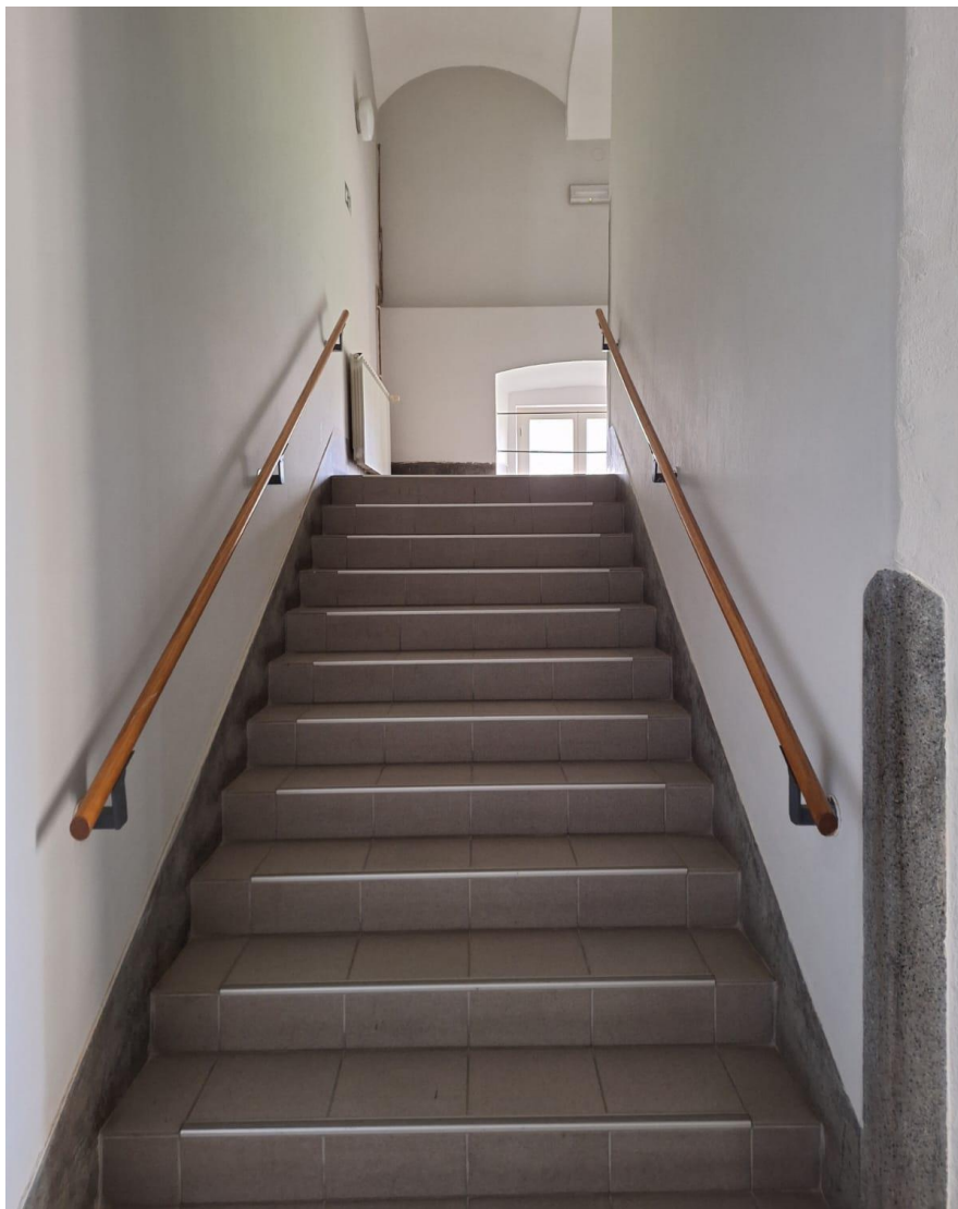
Slika [6] Stepenište na Veleučilištu

Ove smjernice osiguravaju sigurnost i funkcionalnost stepeništa unutar veleučilišta, pridonoseći udobnosti i sigurnosti korisnika.[14]