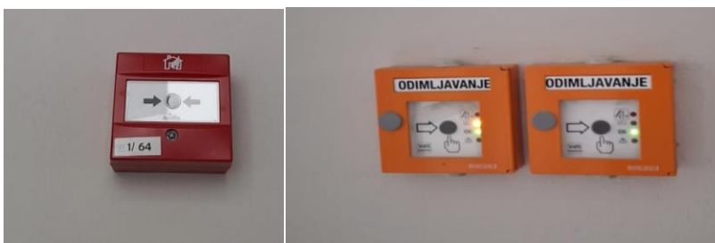
Slika [13] Dojava požara

Upravljačke ploče za dojavu požara obično se nalaze u električnoj sobi ili sobi za panele. Sustavi za dojavu požara koriste vizualne i zvučne signale kako bi upozorili stanare zgrade. Neki sustavi za dojavu požara također mogu onesposobiti liftove, koji su obično nesigurni za korištenje tijekom požara pod većinom okolnosti. [11]