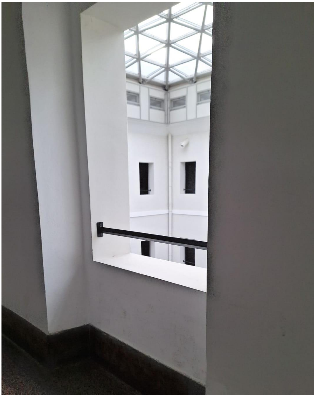
Slika [7] Zaštitna ograda na Veleučilištu