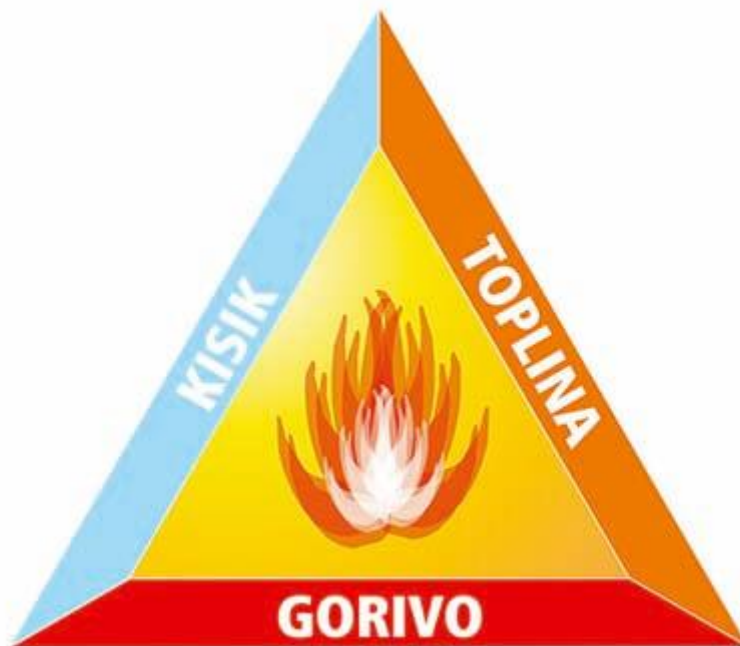
Slika 1. Trokut gorenja [2]

Požar je svako nekontrolirano gorenje te spada među prirodne katastrofe. Također je najveći neprijatelj svim naporima i dostignućima ljudskog rada. Čovjek je međutim najčešći uzročnik nekontrolirane vatre. Više od tri četvrtine svih požara uzrokuje subjektivni faktor, među kojima su nepažnja, površnost ili korištenje propisanih zaštitnih mjera. Međutim, za nastavak požara, važna je prisutnost takozvanih elementa trokuta gorenja (goriva tvar, kisik i temperatura paljenja) kao što i prikazuje Slika 1.. Uklanjanjem nekog od navedenih elemenata, gorenje će prestati. Gorenje je proces nastajanja oksidacije gorive tvari prilikom čega nastaje burna reakcija gorive tvari i kisika prilikom čega nastaje toplina, produkti izgaranja i svjetlost. Požari prouzrokuju velike materijalne i nematerijalne štete od stradavanja ljudi, štete na stambenim i poslovnim objektima do erozije tla.