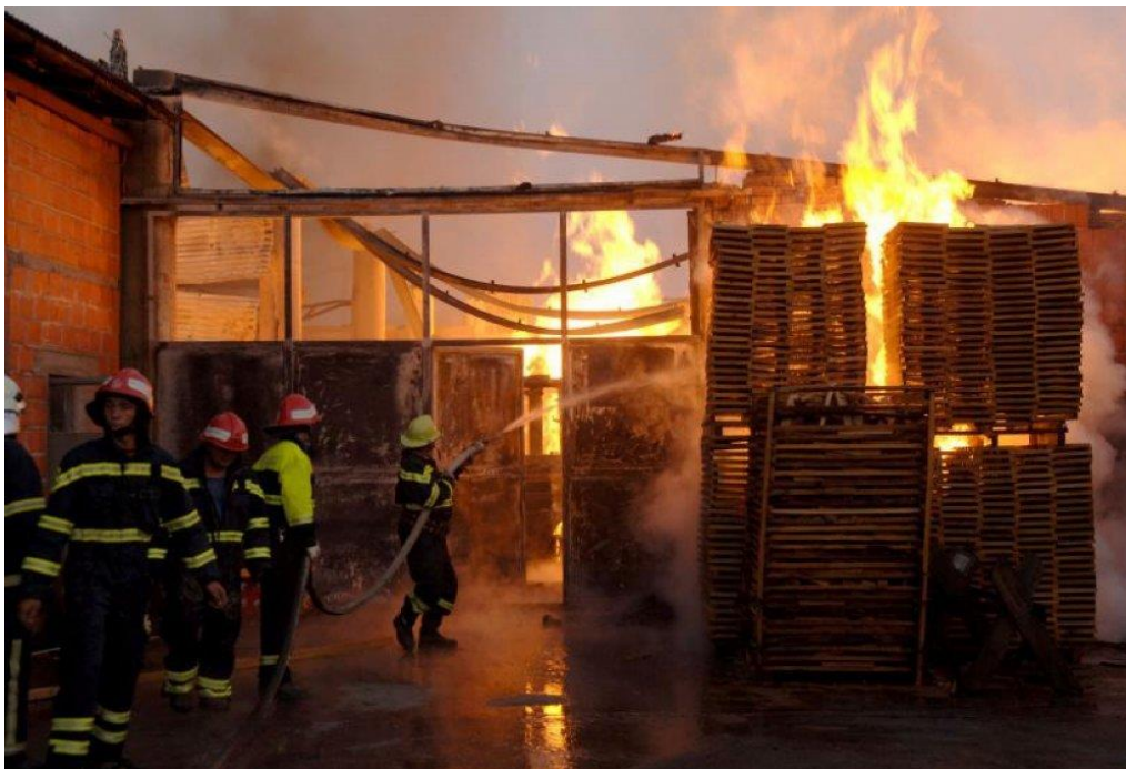
Slika 12. Požar u tvornici namještaja [16]