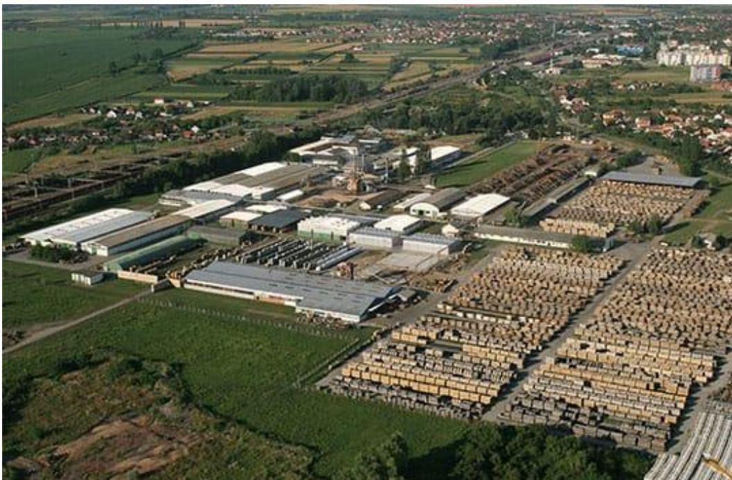
Slika 9.Pogled iz zraka na kompleks drvne industrije [12]

Opasnost nastanka požara u pilanama uvjetovana je materijalom koji se obrađuje drvetom te otpacima. I sami strojevi predstavljaju opasnost za požar, jer se pri procesu paljenja javlja toplina od pregrijavanja pila, koja je već u mnogim slučajevima dovela do požara. Pored drveta, opasnost su ulja i maziva koja se upotrebljavaju za podmazivanje. Međutim, najveće opasnosti za izbijanje požara su prateće građevine u sastavu pilane. Svaka pilana pored prostorije za piljenje ima skladište trupaca te skladište piljene građe na otvorenom prostoru gdje može izbiti požar koji se tada proširi na pilanu. Od pomoćni prostorija najopasnije su kotlovnice, bravarske radionice u kojima se često upotrebljava otvoreni plamen, dok manju opasnost predstavljaju radionica za oštrenje, alatnica i skladište materijala za održavanje. Najmanju opasnost predstavljaju administrativne zgrade i restorani, jer se oni izvode kao samostalne građevine, obično dostatno udaljene od pogona. Pilane se obično smještaju na ravnom terenu uz neki magistralni put i u blizini izvora materijala ili njegove poluzavršne i završne obrade.