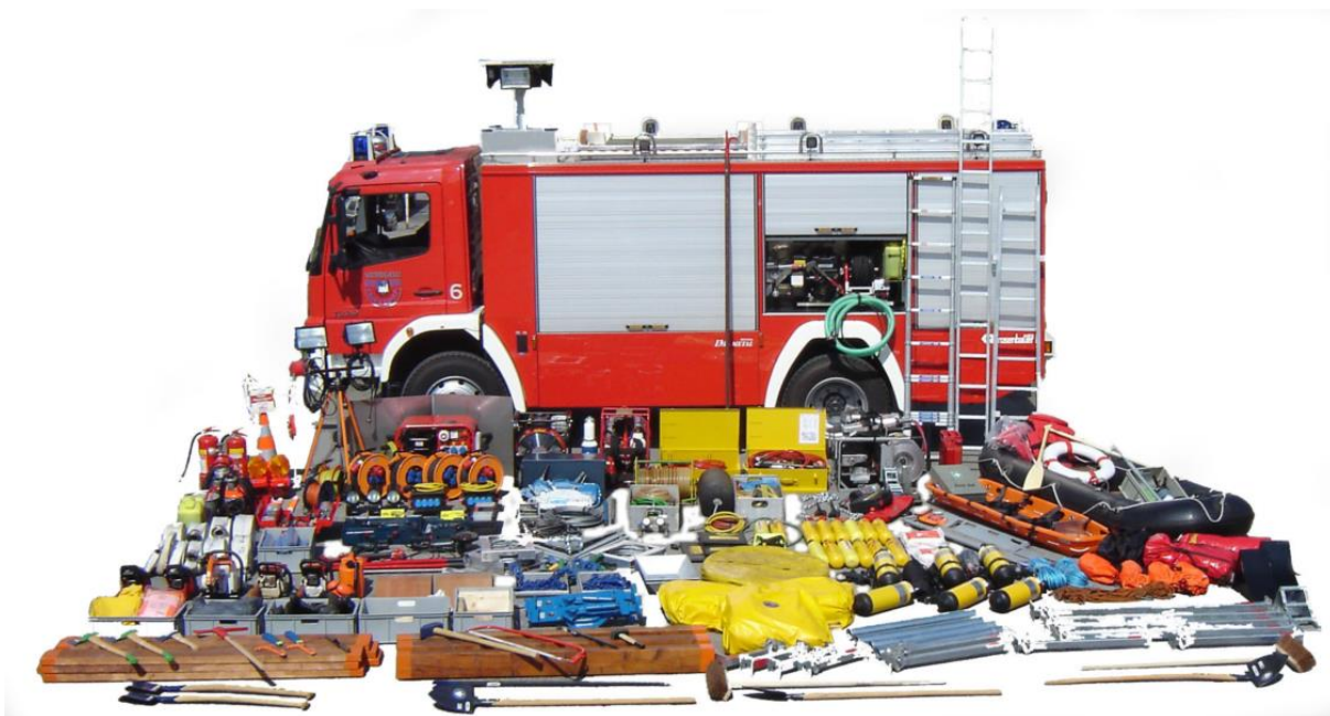
Slika 13. Potrebna oprema za gašenje požara [19]