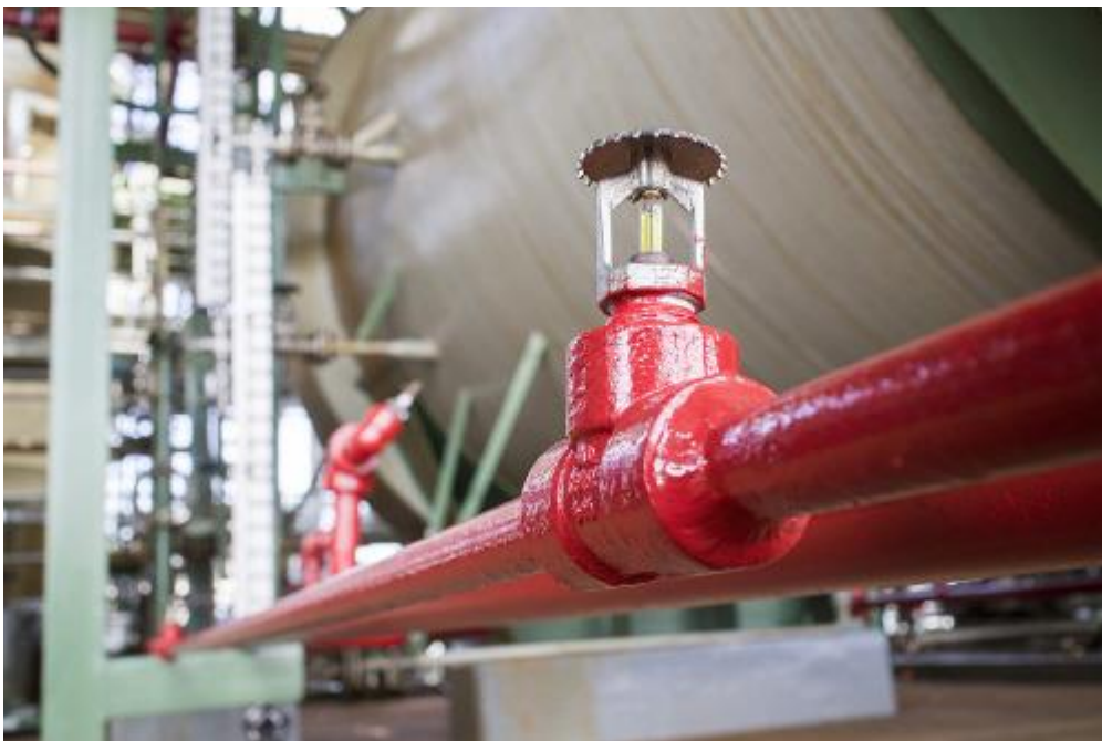
Slika 11. Sprinkler sustav [14]

Za zaštitu prostora treba ugraditi bacače za vodu ili drenčer sustav. Nakon sušenja drvo ide na završnu obradu gdje se raspiljuje na točno određene veličine, uklanjaju nedostaci i sl. Zgrada u kojoj se to odvija treba imati sprinklersku zaštitu. Nakon završne obrade drvo se skladišti, u zatvorenim skladištima ili na otvorenom prostoru. Zatvorena skladišta trebaju imati sprinklersku zaštitu primjer kao na Slici 6., a otvorena skladišta zaštitu s bacačima vode [1].