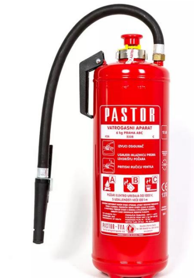
Slika 8. Vatrogasni aparat [9]