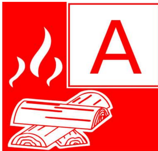
Slika 2. Klasa požara A – piktogram [4]

Plamen nastaje kao posljedica raspadanja tvari iz ove skupine na kruti dio koji gori žarom te plinoviti dio koji gori plamenom. Raspadanje krutih tvari se odvija pri visokoj temperaturi i u uvjetima u kojima nema dovoljno kisika za gorenje plinova koji nastaju raspadanjem. Klasa požara A prikazana je na slici 2. [3].