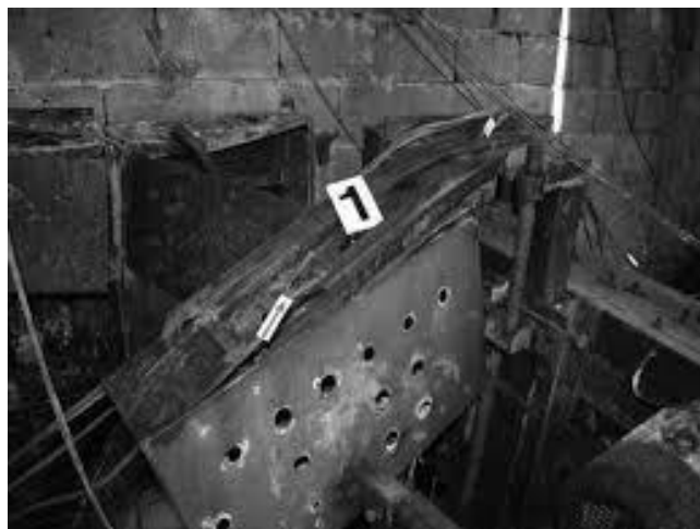
Slika 12. Kabel s tragovima termičkog oštećenja i prekid [1]