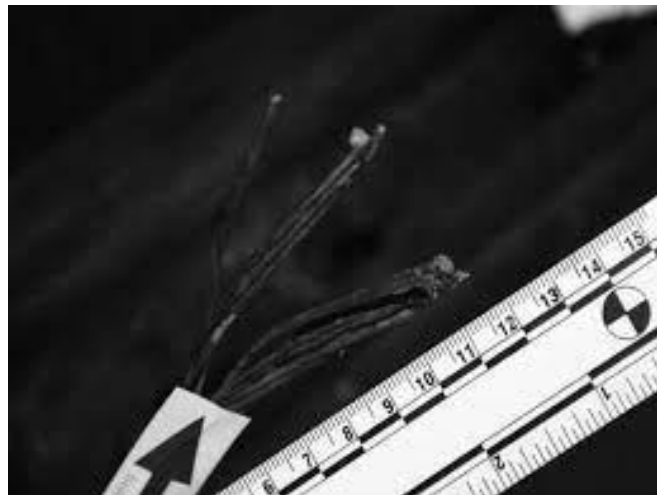
Slika 15. Tragovi taljenja vodiča na mjestu prekida [1]

Pregledom navedenog kabela utvrđeno je da se radi o četverožilnom kabelu koji je termički oštećen u obliku potpunog gorenja izolacije kabela i vodiča, a na jednom mjestu se nalaze tragovi prekida i taljenja jednog od vodiča kabela. Detaljnim pregledom na mjestu prekida vodiča višežičnog poprečnog presjeka nalaze se tragovi taljenja u obliku kuglica. Kabel je bio položen u metalnoj kanalici koja se nalazila na zidu iznad razvodnih ormarića. Dio električnog kabela s pronađenim tragovima zabilježen je fotografijom i izuzet od strane kriminalističkog tehničara. Pregledom električne instalacije na zidu iznad razvodnih ormarića, utvrđeno je da su električni kabeli bili smješteni u metalnim kanalicama koje su se nalazile na zidu iznad razvodnih ormarića u blizini stropa prostorije [1].