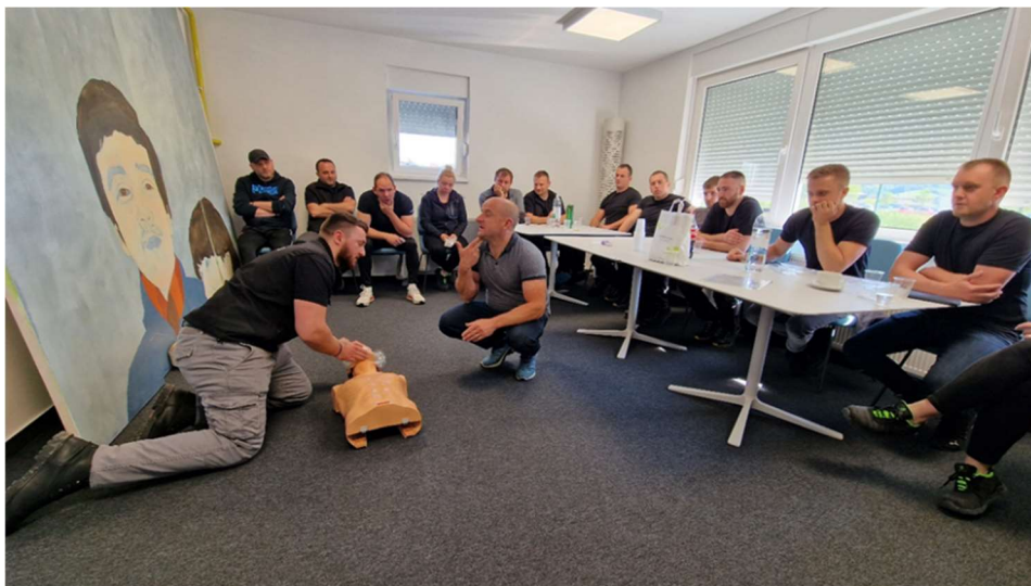
Slika 3: Tečaj prve pomoći

kojem su rizici svedeni na minimum, a radnici osposobljeni za pravilno pružanje prve pomoći u slučaju nesreće.