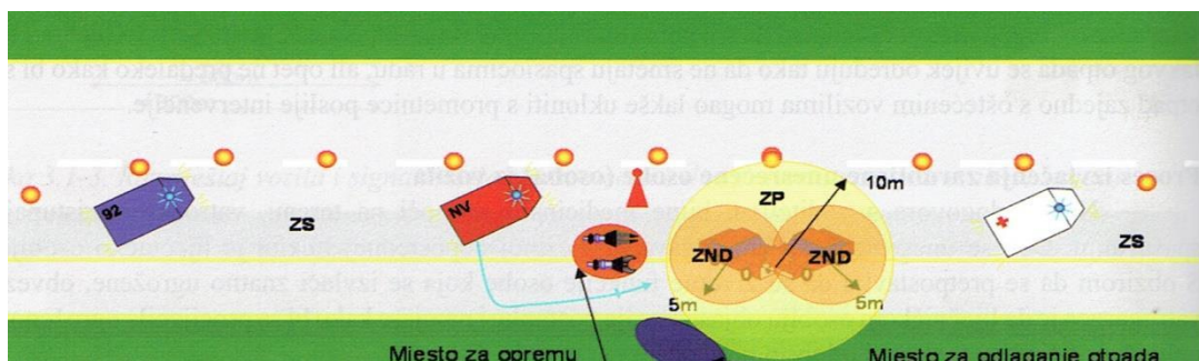
Slika 12: Zone djelovanja [6]

Zona rada je područje na mjestu intervencije u kojem se neposredno odvija pružanje prve pomoći i oslobađanje unesrećenih osoba. U ovu zonu, koja je relativno mala, smiju ulaziti samo vatrogasci i medicinsko osoblje koje neposredno radi na oslobađanju ili pružanju prve pomoći unesrećenim osobama. Zona se ograđuje i paravanima kojima se sprječava pogled na samo mjesto rada i unesrećene osobe, ukoliko uvjeti zahtijevaju takvu prepreku. [6]