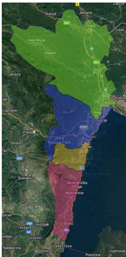
Slika 1: Područje djelovanja Javne vatrogasne postrojbe Opatija [2]

Na slici 1 prikazano je područje djelovanja JVP Opatija koje obuhvaća područje Grada Opatije i 3 općine (Matulji, Lovran, Mošćenička Draga). Grad Opatija i navedene općine ujedno su i suosnivači postrojbe. [3]