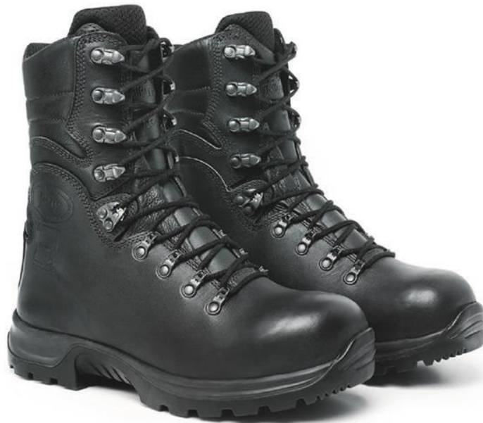
Slika 19: Vatrogasne čizme za gašenje požara otvorenog prostora [16]