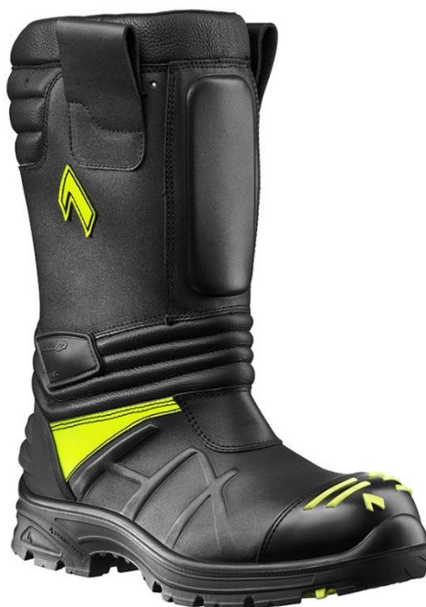
Slika 18: Vatrogasne čizme za strukturne požare [15]

Tip 3 pogodan je za uporabu pri posebnim rizicima, primjerice intervencije gdje su prisutne opasne tvari (ispuštanje opasnih kemikalija u okoliš i slično) kao i za sve druge vrste požarnih intervencija. Ova obuća smije biti izrađena jedino od gume. [14]