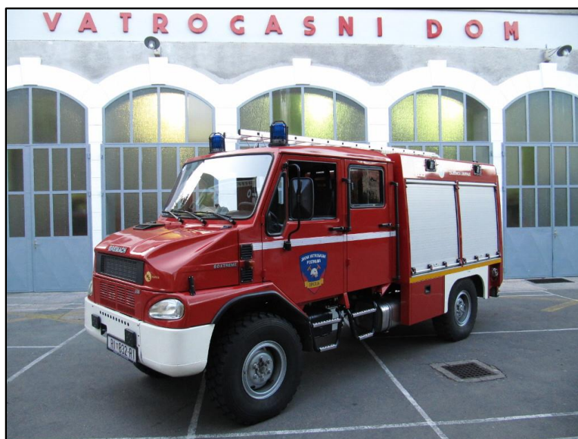
Slika 4: Malo navalno vozilo OP-3 [2]

OP-3 malo navalno vozilo Bremach. Zbog svojih gabarita namijenjeno je za gašenje požara u urbanim sredinama, kao i požara u brdskim ruralnim područjima. Opremljeno je sa 1100 litara vode i 20 litara pjenila. Kapaciteta je