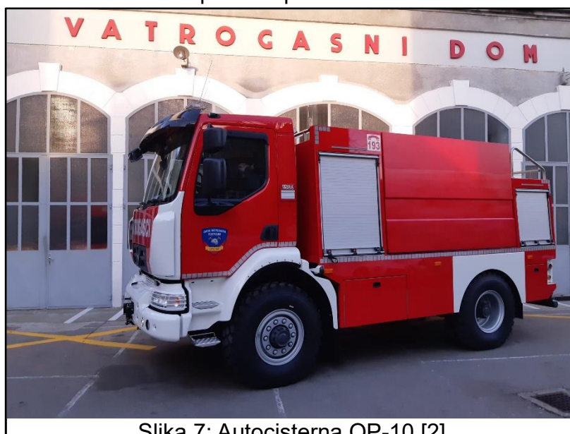
Slika 7: Autocisterna OP-10 [2]

OP-10 autocisterna na Renault šasiji uz pogon 4x4. Namijenjena je za gašenje požara i transport vode. Opremljeno je blokadama svih diferencijala za pristup teškim terenima, stalnog pogona na četiri kotača. Također ima i bacač vode na krovu kapaciteta 1000 l/min. Kapacitet spremnika vode ima 5500 litara.