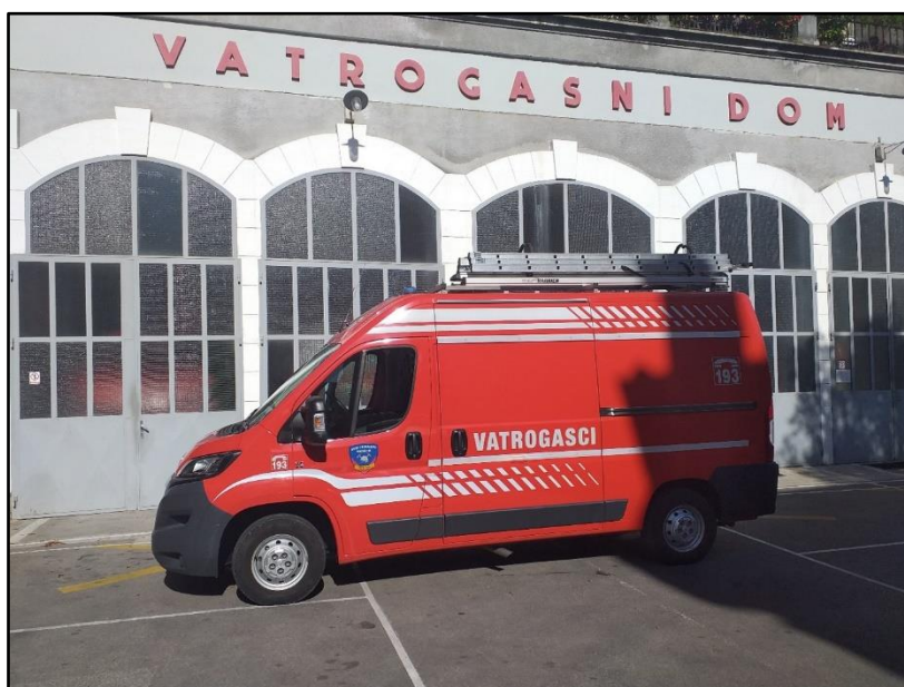
Slika 11: Malo tehničko vozilo OP-15 [2]

OP-15 malo tehničko vozilo. Namijenjeno za tehničke intervencije od otvaranja stanova do složenih intervencija u prometu te spašavanja s visina i iz dubina.