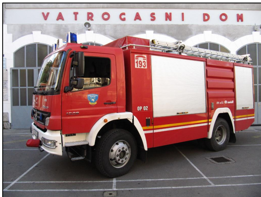
Slika 3: Veće navalno vozilo OP-2 [2]

OP-3 malo navalno vozilo Bremach. Zbog svojih gabarita namijenjeno je za gašenje požara u urbanim sredinama, kao i požara u brdskim ruralnim područjima. Opremljeno je sa 1100 litara vode i 20 litara pjenila. Kapaciteta je