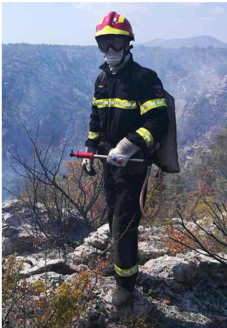
Slika 14: Vatrogasac opremljen OZO za šumske požare [2]

Na slici 14 prikazan je djelatnik JVP Opatije na požarištu Zelići u Šibensko-kninskoj županiji u sastavu izvanredne dislokacije Primorsko-goranske županije 2017. godine. Vatrogasac na sebi ima jednodijelni zaštitni kombinezon za šumske požare i požare otvorenog prostora, zaštitne čizme, zaštitne rukavice te zaštitnu kacigu za šumske požare.