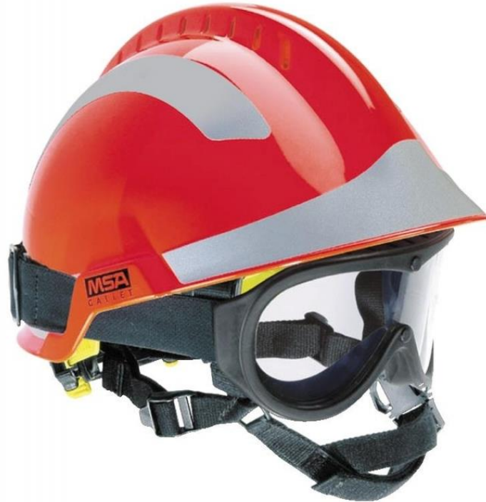
Slika 16: Kaciga za gašenje požara otvorenog prostora [9]