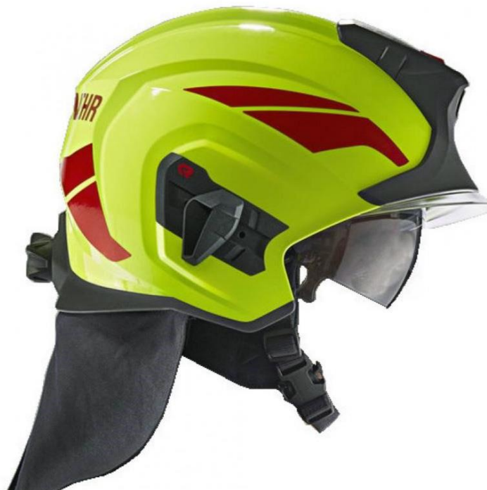
Slika 15: Kaciga za gašenje požara u zgradama i drugim građevinama [9]

Svrha vatrogasne kacige je da štiti glavu od mehaničkih ozljeda, isijavanja topline i plamena. U ovisnosti o vrsti požarne intervencije, odnosno aktivnostima vatrogasaca na intervencijama, razlikuje se namjena vatrogasnih kaciga te s tim u vezi zahtjevi zaštite koje iste trebaju ispuniti. Norme koje ih definiraju su HRN EN 443:2008: „Kacige za gašenje požara u zgradama i drugim građevinama” te HRN EN 16471:2015: “Vatrogasne kacige - Kacige za gašenje požara otvorenog prostora”. [14]