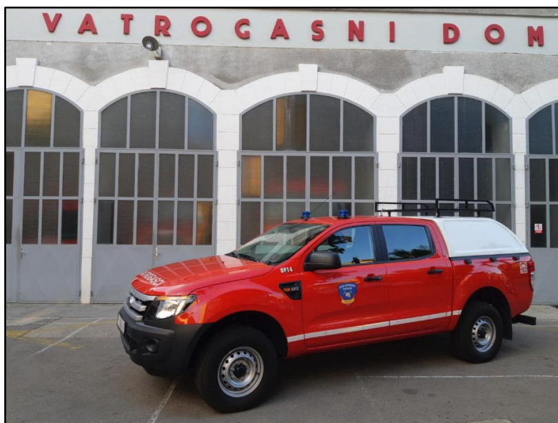
Slika 10: Terensko vozilo OP-14 [2]

OP-14 terensko je vozilo Ford Ranger opremljeno HDL modulom visokog tlaka i spremnika vode 350 litara.