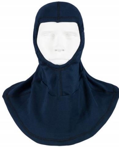
Slika 20: Vatrogasna potkapa [9]

Poznavanjem složenih uvjeta rada vatrogasaca kao i nemogućnosti predviđanja svih mogućih situacija s kojima će se vatrogasci susresti na svojim intervencijama, može se zaključiti kako je u svrhu zaštite sigurnosti i zdravlja vatrogasca nužna primjena odjevnih zaštitnih sustava na vatrogasnim intervencijama. Uz pružanje maksimalne zaštite vatrogascima, spomenuti sustavi moraju biti izrađeni sukladno ergonomskim načelima i osigurati vatrogascu normalno izvođenje radnih aktivnosti.