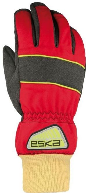
Slika 17: Vatrogasne rukavice [13]

Vodonepropusne ili zrakopropusne membrane u sastavu imaju Gore-Tex Crosstech ili Pyrotect membrane dok termalna barijera sprječava zagrijavanje ruke kombinacijom Kevlar/Nomex materijala.[12]