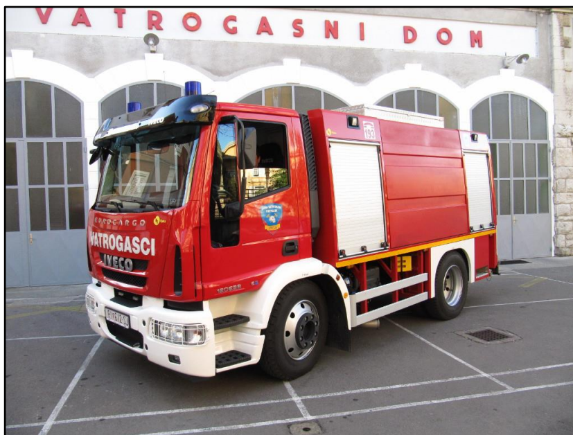
Slika 9: Autocisterna OP-12 [2]

OP-12 autocisterna, kapaciteta 5000 litara. Koristi se i za transport pitke vode, ukoliko postoji potreba. Vozne karakteristike čine ga jednim od najstabilnijih vozila u voznom parku JVP Opatija, uz OP-1.