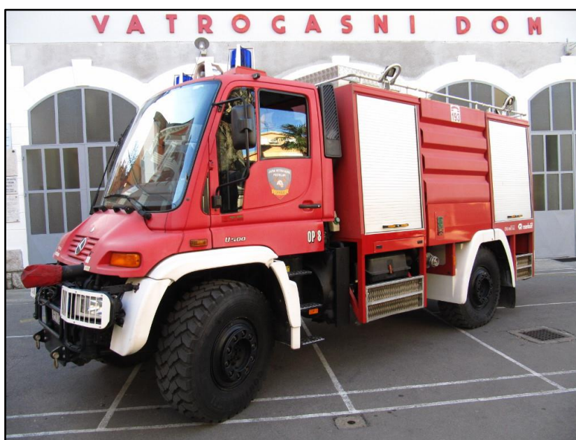
Slika 5: Veliko šumsko vozilo OP-8 [2]

OP-8 veliko je šumsko vozilo na šasiji Mercedes Unimog U500. Kapacitet vode na vozilu iznosi 3800 litara te je opremljeno sa dva vitla za gašenje po 60 metara te vučnim vitlom.