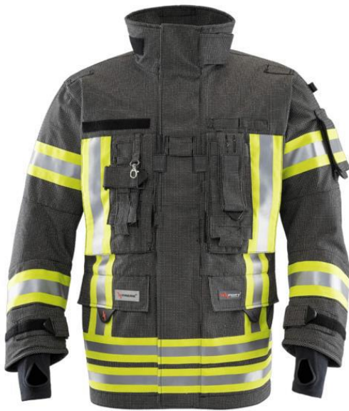
GORNJI DIO - jakna