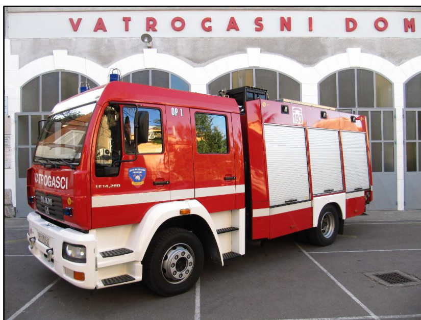
Slika 2: Navalno vozilo OP-1 [2]

OP-1 glavno navalno vozilo. MAN, kapaciteta 2000 litara vode za gašenje, dva spremnika po 150 litara pjenila, dupla kabina kapaciteta 1+5 osoba. Unatoč tome što je kamion starije izvedbe, predstavlja jedno od najboljih vozila što se tiče voznih osobina i rasporeda opreme. [2]