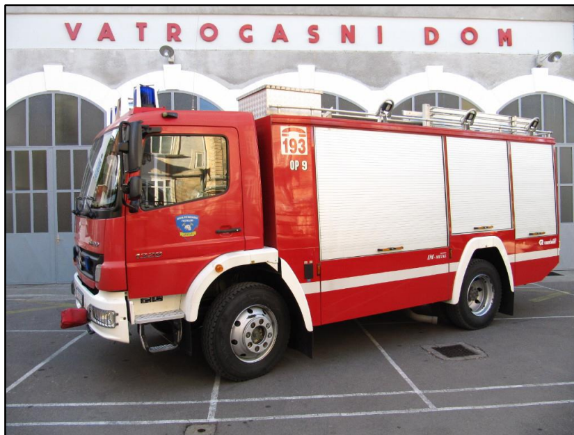
Slika 6: Srednje tehničko vozilo OP-9 [2]

OP-9 je srednje tehničko vozilo bez kрана. Vozilo je opremljeno opremom određenom prema pravilniku o minimumu tehničke opreme, NN 43/95 čl.36. Prvenstvena namjena su složenije tehničke intervencije gdje do izražaja dolazi raznovrsnost i količina opreme koja se u vozilu nalazi.