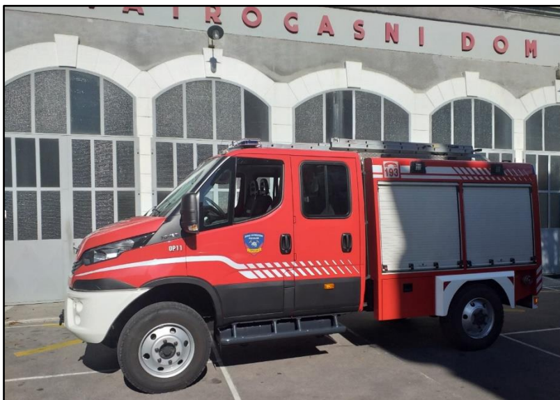
Slika 8: Srednje šumsko vozilo OP-11 [2]

OP-11 srednje šumsko vozilo na Iveco šasiji. Kao i OP-3 namijenjen je za gašenje u urbanim sredinama i na šumskim i brdskim područjima. Kapaciteta vode 1100 litara, dupla kabina sa sedam sjedećih mjesta. Jedno je od najnovijih vozila u JVP Opatija, nabavljeno 2021 godine.