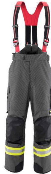
DONJI DIO - hlače