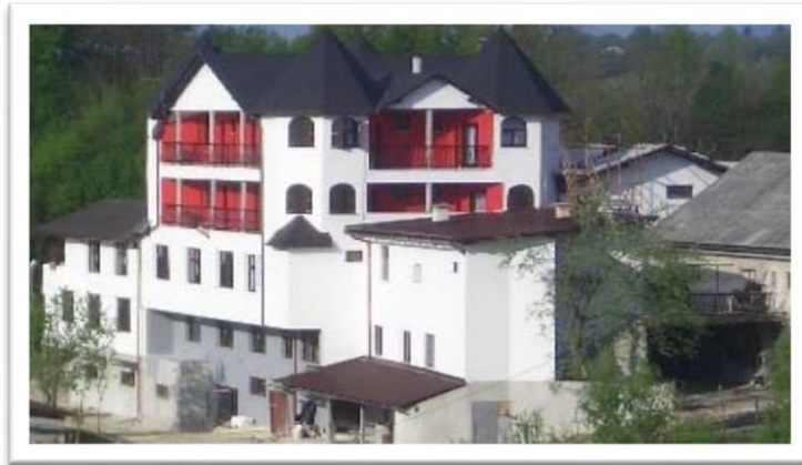
Slika 3 : Hotel Frankopan