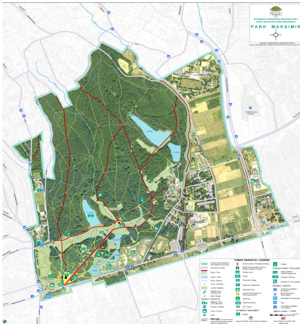
Slika br.4 Topografski prikaz parka

Inventarizacija mrtvog drva u parku Maksimir provedena je korištenjem standardnih metoda koje su uobičajene u šumarstvu i ekologiji, s ciljem prikupljanja podataka o vrsti, veličini, stupnju raspadanja i položaju mrtvog drva. Ova inventarizacija je ključna za razumijevanje uloge mrtvog drva u ekosustavu parka te za planiranje odgovarajućih mjera očuvanja.