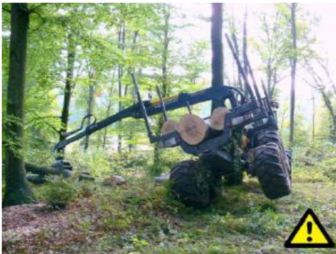
Slika 10. Dizanje kotača od tla prilikom utovara [4]

Prevrtnje forvardera može uzrokovati ozbiljne ozljede, uključujući: Kontuzije i frakture: Uzrokovane udarcem ili stiskanjem unutar kabine tijekom prevrtanja, te ozljede glave i kralježnice koje mogu biti vrlo ozbiljne, posebno ako operater nije pravilno vezan ili ako kabina nema adekvatnu ROPS (Roll-Over Protective Structure) zaštitu (slika 10.).