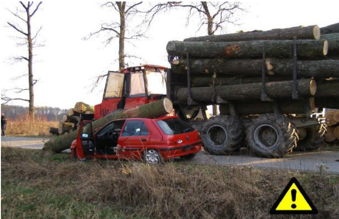
Slika 12. Posljedica nepravilno složenog tereta [4]

Sindrom karpalnog tunela uzrokovan dugotrajnim izlaganjem vibracijama i repetitivnim pokretima rukama. Oštećenja mišića i tetiva nastaju dugotrajnom izloženost vibracijama uzrokuju oštećenja mišića, tetiva i živaca.