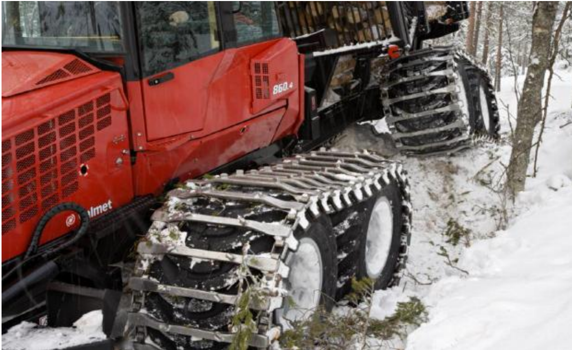
Slika 15. Polugusjenice montirane na forvarder [6]

Rad u udaljenim i teško dostupnim područjima otežava pristup servisnim timovima i hitnim službama, što zahtijeva dodatnu pripremu i opremu za hitne slučajeve. Ograničena dostupnost komunikacijskih mreža može otežati koordinaciju i prijavu hitnih slučajeva.