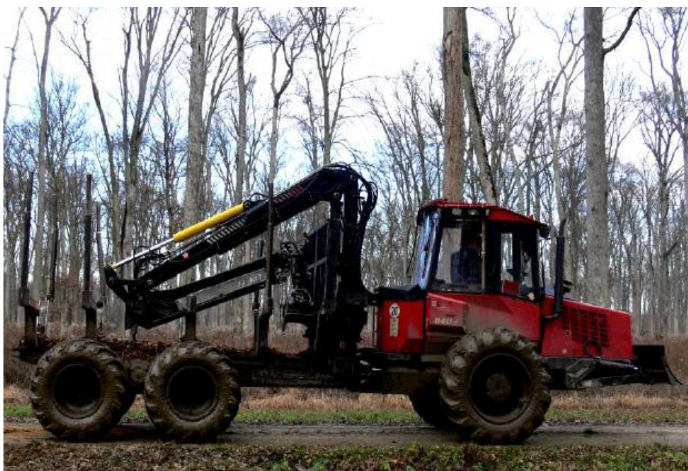
Slika 1. Forvarder [1]

Forvarderi su specijalizirana vozila ili mašine koja se koriste u šumarstvu za prijevoz sirovih trupaca iz šume do mjesta privremene ili stalne prerade, poput pilana(stovarišta). Ovi strojevi su dizajnirani da efikasno i sigurno prenose velike količine drvene građe kroz teške i često nepristupačne šumske terene. Forvarderi se najčešće koriste u komercijalnom šumarstvu, gdje je potrebno brzo i efikasno prevoziti velike količine drvene građe. Također, nalaze primjenu i u održivom šumarstvu, gdje se pažljivo upravlja resursima kako bi se osigurala dugoročna održivost šumskih ekosustava. Uz to, forvarderi su bitan alat u sanaciji šuma nakon prirodnih katastrofa poput požara ili vjetroizvala, gdje je potrebno brzo ukloniti oštećeno drvo (slika 1.).