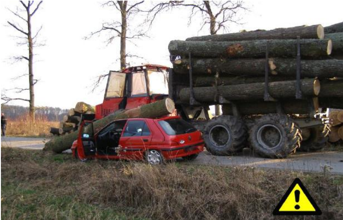
Slika 12. Posljedica nepravilno složenog tereta [4]

Sindrom karpalnog tunela uzrokovan dugotrajnim izlaganjem vibracijama i repetitivnim pokretima rukama. Oštećenja mišića i tetiva nastaju dugotrajnom izloženost vibracijama uzrokuju oštećenja mišića, tetiva i živaca.