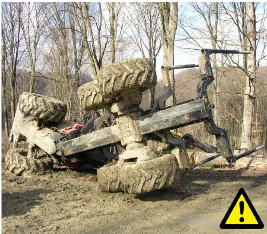
Slika 8. Prevrtanje forvardera [4]

Preopterećenje ili nepravilno raspoređen teret može uzrokovati prevrtanje ili gubitak kontrole(slika8.).