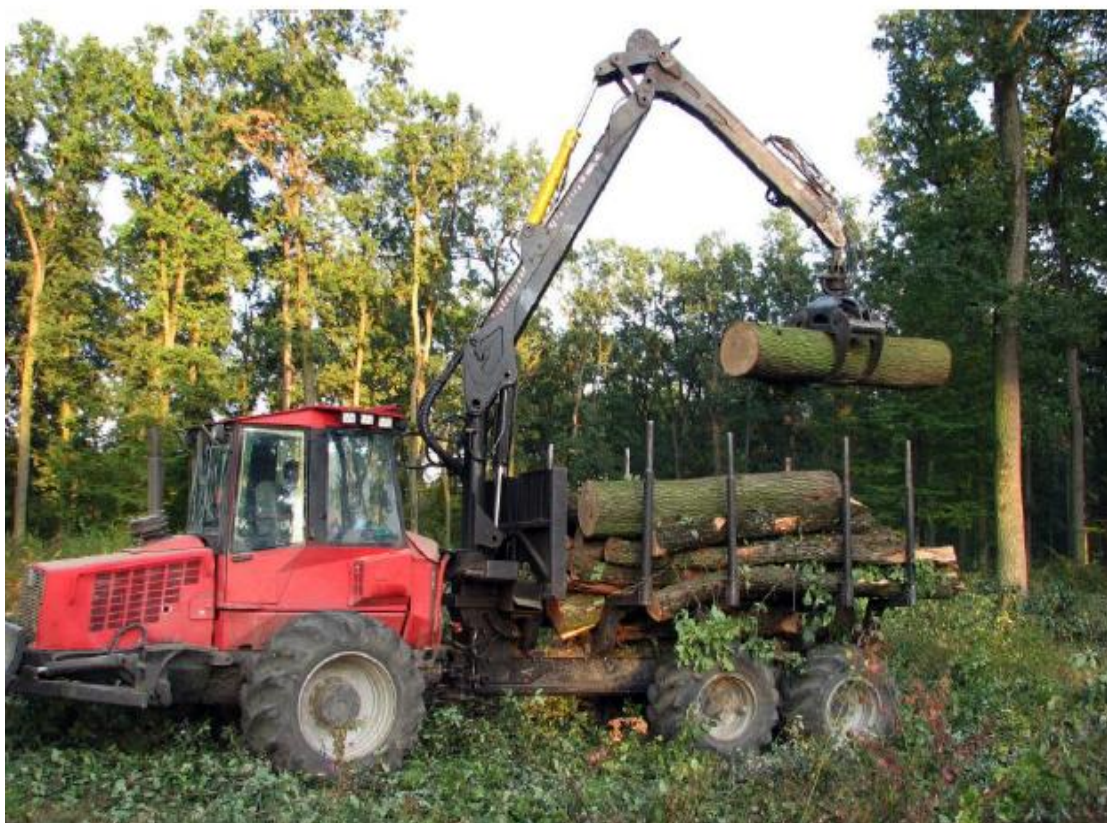
Slika 3. Utovar trupaca na forvarder [1]

Nakon sječe, forvarderi dolaze na mjesto gdje su trupci posječeni. Hidraulična ruka s hvataljkom omogućuje operateru da podigne i utovari trupce na vozilo (slika 3.). Ovaj proces značajno smanjuje fizički napor i povećava brzinu utovara u usporedbi s ručnim metodama. Forvarderi su dizajnirani da se kreću po neravnom, blatnjavom i često nepristupačnom terenu. Zahvaljujući pogonu na sve kotače i velikim gumama, mogu se lako kretati kroz šumu, prelazeći preko prepreka poput kamenja i korijenja. Na određenim lokacijama unutar šume, forvarderi istovaruju drvo na privremene deponije ili direktno na kamione koji prevoze drvo do pilana ili drugih krajnjih odredišta. Hidraulična ruka omogućuje precizan i siguran istovar trupaca.