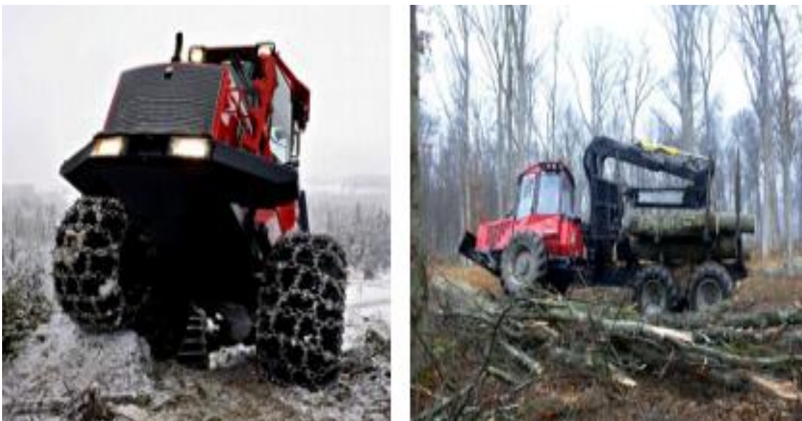
Slika 6. Prijelaz forvardera preko prepreka [3]