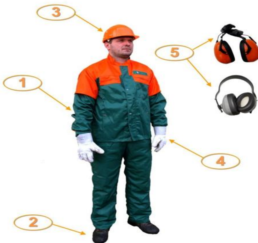
Slika 16. Osobna zaštitna sredstva [8]

Korištenje osobne zaštitne opreme pri radu s forvarderima ključan je element u osiguravanju sigurnosti i zaštite zdravlja radnika. Pravilna uporaba, redovito održavanje i kontinuirana edukacija radnika o važnosti OZO-a značajno smanjuju rizik od ozljeda i osiguravaju sigurno radno okruženje u šumarstvu.[8]