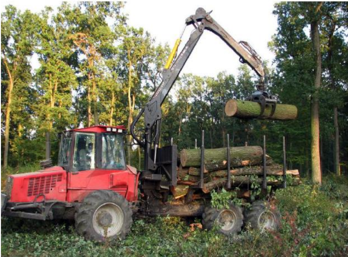
Slika 3. Utovar trupaca na forvarder [1]

Nakon sječe, forvarderi dolaze na mjesto gdje su trupci posječeni. Hidraulična ruka s hvataljkom omogućuje operateru da podigne i utovari trupce na vozilo (slika 3.). Ovaj proces značajno smanjuje fizički napor i povećava brzinu utovara u usporedbi s ručnim metodama. Forvarderi su dizajnirani da se kreću po neravnom, blatnjavom i često nepristupačnom terenu. Zahvaljujući pogonu na sve kotače i velikim gumama, mogu se lako kretati kroz šumu, prelazeći preko prepreka poput kamenja i korijenja. Na određenim lokacijama unutar šume, forvarderi istovaruju drvo na privremene deponije ili direktno na kamione koji prevoze drvo do pilana ili drugih krajnjih odredišta. Hidraulična ruka omogućuje precizan i siguran istovar trupaca.