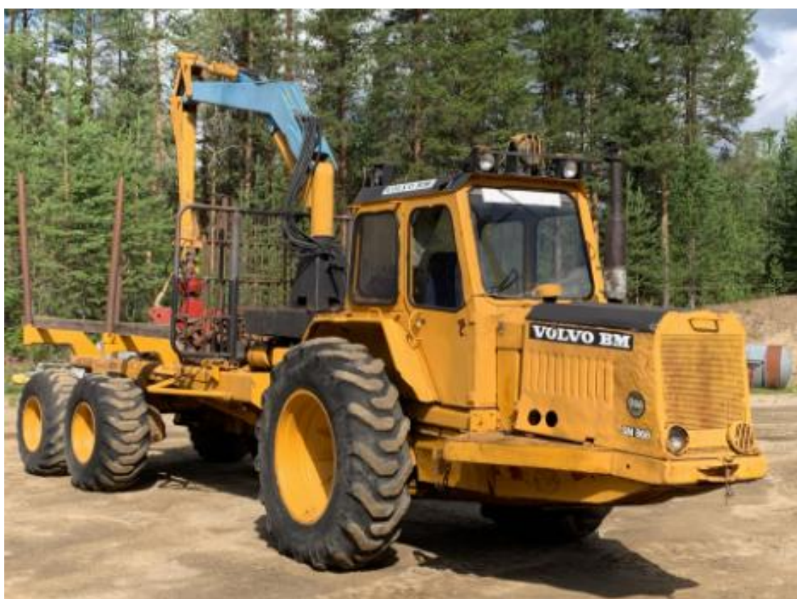
Slika 2. Forvarder Volvo BM [1]

elektroničke sustave za praćenje opterećenja, GPS navigaciju i optimizaciju rada. Ove tehnologije omogućile su preciznije i učinkovitije upravljanje radom. S početkom 21. stoljeća, povećana svijest o zaštiti okoliša potaknula je razvoj ekološki prihvatljivih forvardera. Električni i hibridni modeli postaju sve prisutniji, smanjujući emisije i negativan utjecaj na šumske ekosustave. Najnoviji razvoj uključuje automatizaciju i korištenje umjetne inteligencije. Autonomni forvarderi i sustavi za daljinsko upravljanje omogućuju još veću sigurnost i učinkovitost, dok se radnici mogu fokusirati na nadzor i upravljanje operacijama iz sigurnih lokacija [1].