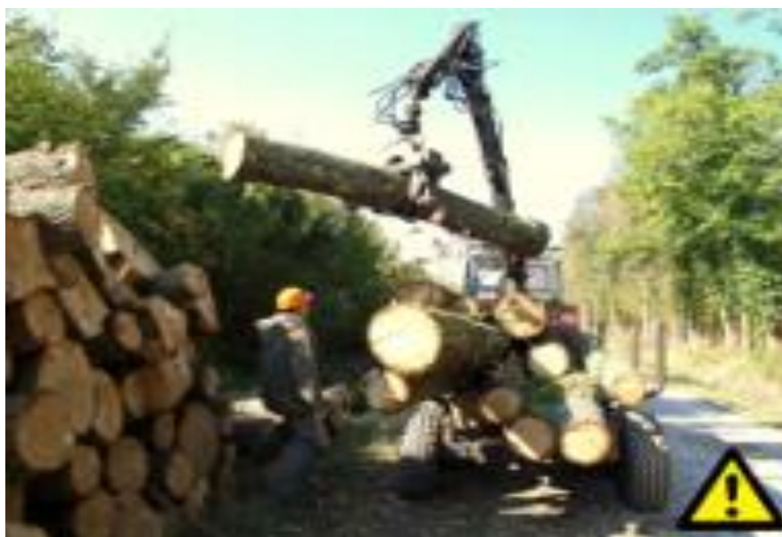
Slika 11. Radnik u radnom prostoru dizalice [4]

Zgnječenja se mogu dogoditi ako trupci padnu na operatera ili drugog radnika tijekom utovara ili istovara. Strukturne ozljede nepravilnim raspoređivanjem tereta može uzrokovati pomicanje tereta, što može dovesti do ozljeda(slika 11.).