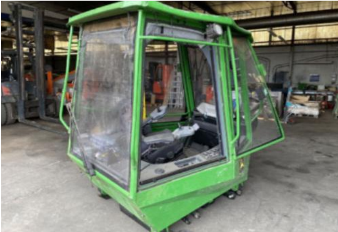
Slika 4. Kabina forvardera [2]

Moderni forvarderi opremljeni su sustavima za smanjenje vibracija kako bi se smanjio fizički stres na operatera. Kabine s velikim prozorima i kamerama omogućuju bolju vidljivost, smanjujući rizik od sudara i nesreća(slika 5).