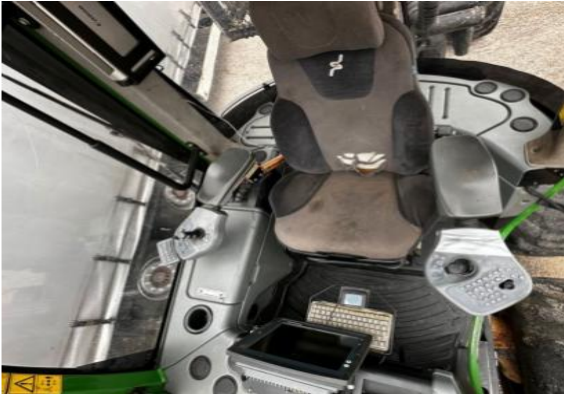
Slika 5. Unutrašnjost kabine [2]