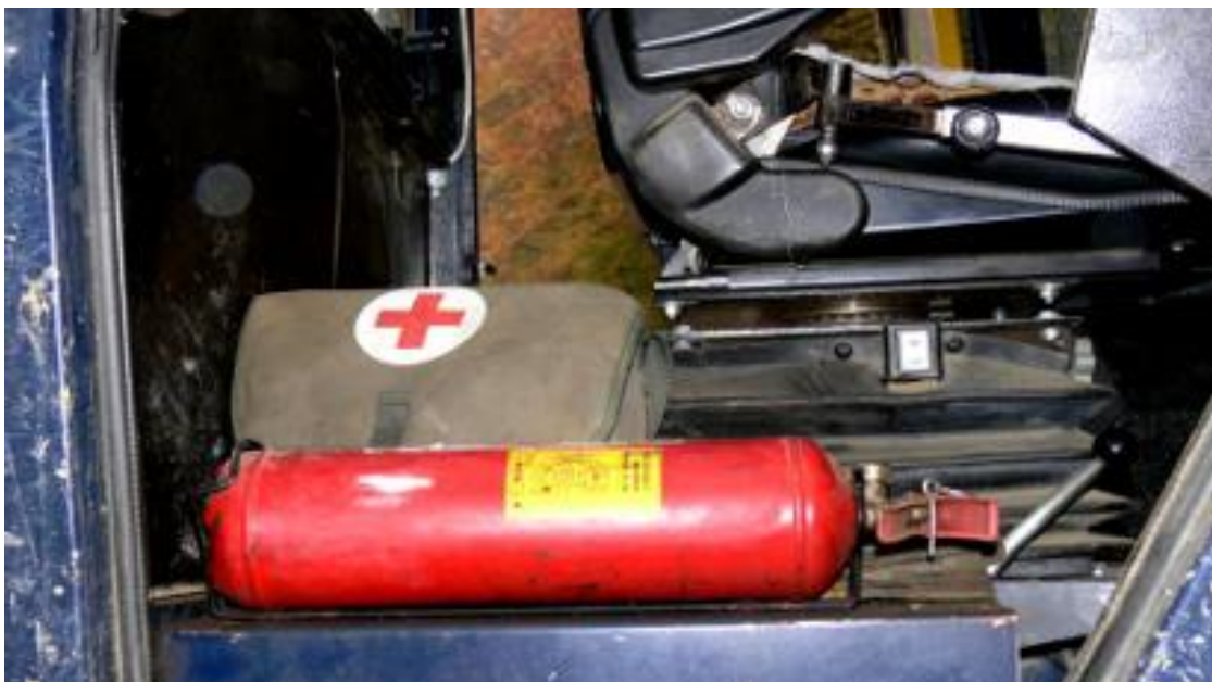
Slika 9. Aparat za gašenje požara i pribor za pružanje prve pomoći [4]