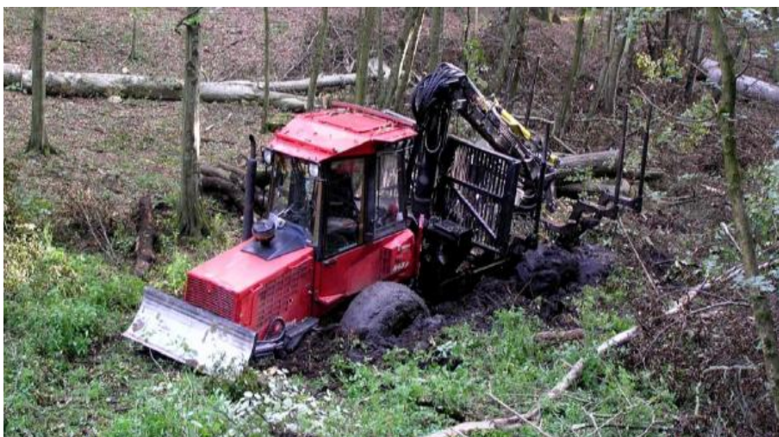
Slika 14. Forvarder zapeo na slabo nosivom tlu [6]

Forvarderi često rade na strmim padinama i neravnim terenima, što zahtijeva specijalizirane vještine operatera i visoku stabilnost vozila. Rad u mokrim uvjetima može uzrokovati probleme s kretanjem forvardera, povećavajući rizik od zaglavlivanja ili prevrtanja (slika 13.) [6]