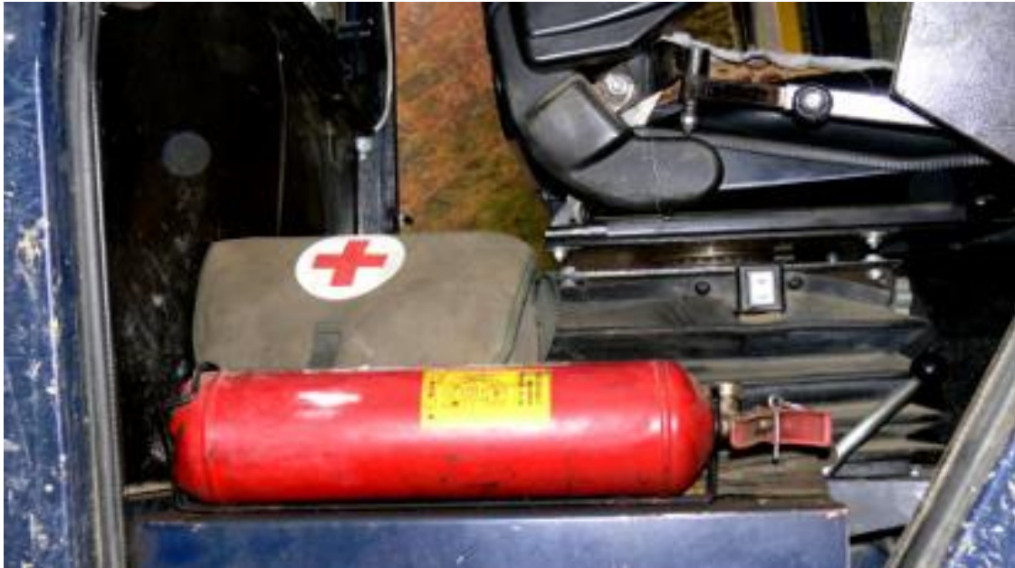
Slika 9. Aparat za gašenje požara i pribor za pružanje prve pomoći [4]