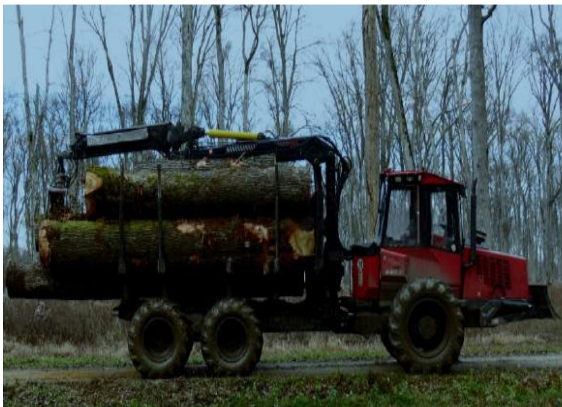
Slika 7. Pravilno natovaren teret [4]

Operateri moraju biti svjesni terena po kojem se kreću, izbjegavajući ekstremne nagibe i nestabilne površine koje mogu dovesti do prevrtanja vozila. Pravilan utovar i raspored tereta ključni su za stabilnost forvardera(slika7.).