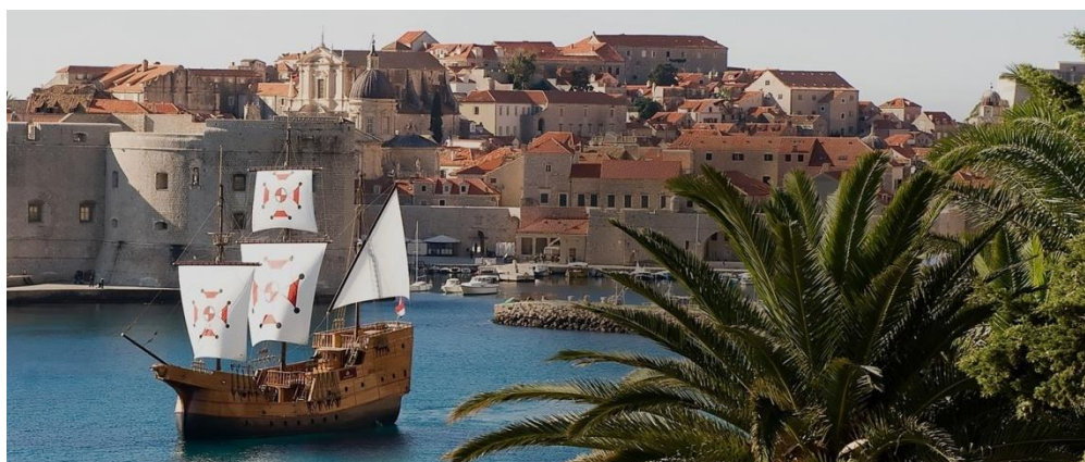
Slika 7. Drveni jedrenjak