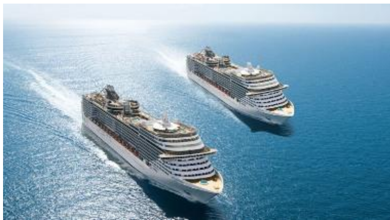
Slika 2. Brod za krstarenje