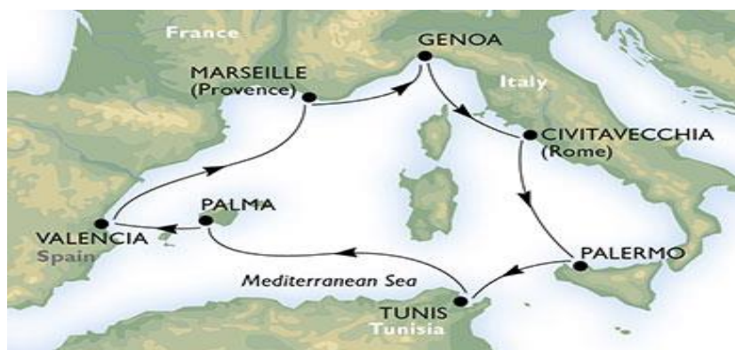
Slika 1. Kružna putovanja između više zemalja