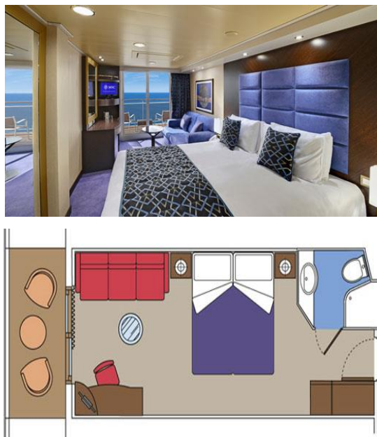
Slika 6. Unutrašnjost sobe s balkonom