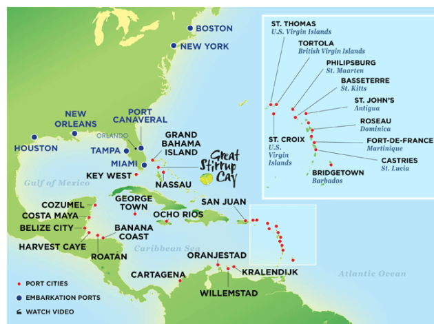
Slika 4. Područje Kariba