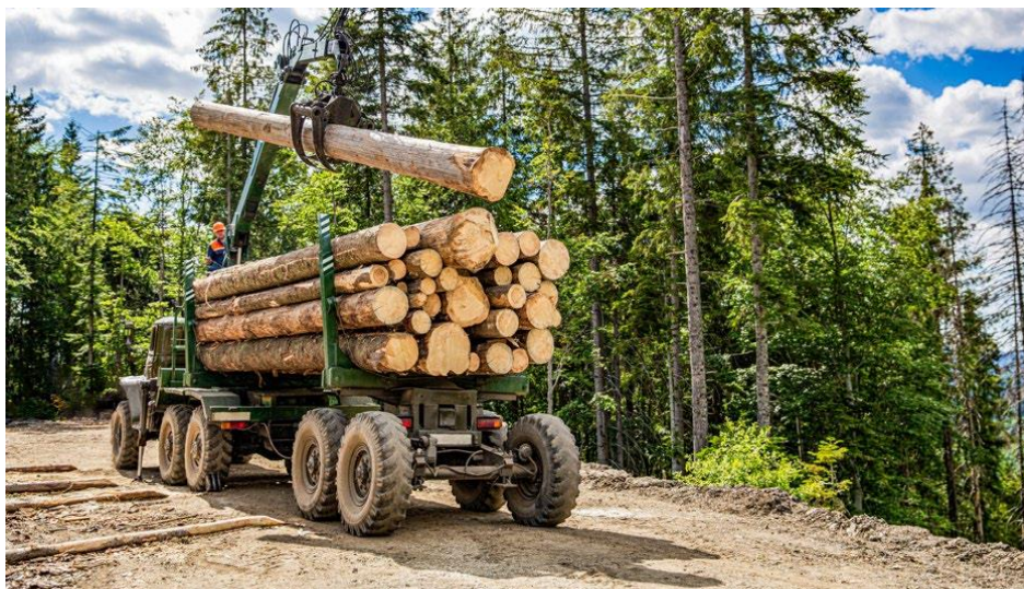
Slika 16. Izvoženje drvnih sortimenata forwarderom

Za privlačenje drvnih trupaca i premještanje drvenih trupaca od mjesta sakupljanja do pomoćnog stovarišta služe šumski zglobni ili adaptirani poljoprivredni traktor s vitlom, dok se izvoženje drvnog materijala vrši forwarderom, slika 16. i traktorskom ekipažom, slika 17., [20].