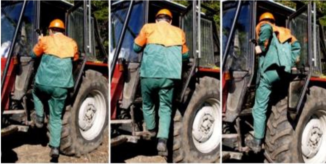
Slika 19. Pravilan ulazak u traktor