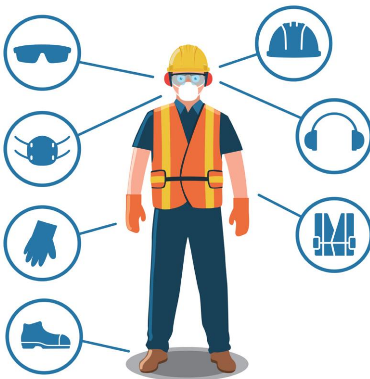
Slika 11. Osobna zaštitna sredstva

Osnovne mjere sigurnosti nisu uvijek dovoljne da bi se provela zaštita zaposlenika. Zbog toga je važno korištenje osobnih zaštitnih sredstava, slika 11. Osobnim zaštitnim sredstvima i opremom smatraju se uređaji, naprave, odjeća i obuća što se koriste pri radu za zaštitu od štetnih utjecaja radne okoline. Koja će se osobna zaštitna sredstva primijeniti pri obavljanju određenog posla ovisi o izvorima i vrsti opasnosti. Odabir osobne zaštitne opreme obavlja se na osnovi rizika utvrđenih u procjeni rizika za određeno radno mjesto. Odabrana osobna zaštitna oprema mora osigurati najveću moguću razinu zaštite radnika uz uvjet da omogućava normalno odvijanje radnih aktivnosti te da je udobna radniku [15].