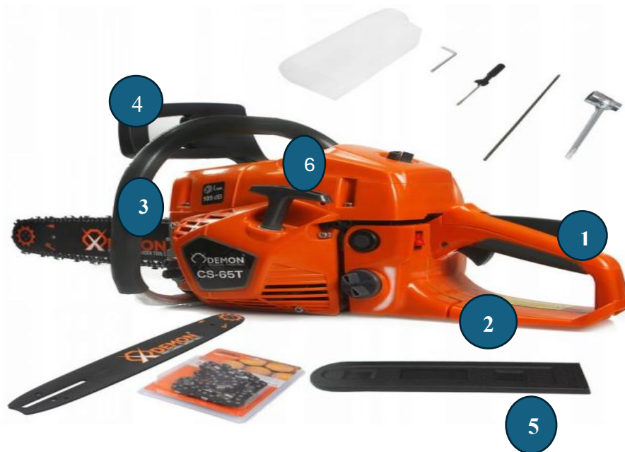
Slika 9. Zaštitne naprave na motornoj pili

U nastavku, slika 10. prikazuje, kao i prethodna slika, zaštitne naprave na motornoj pili.