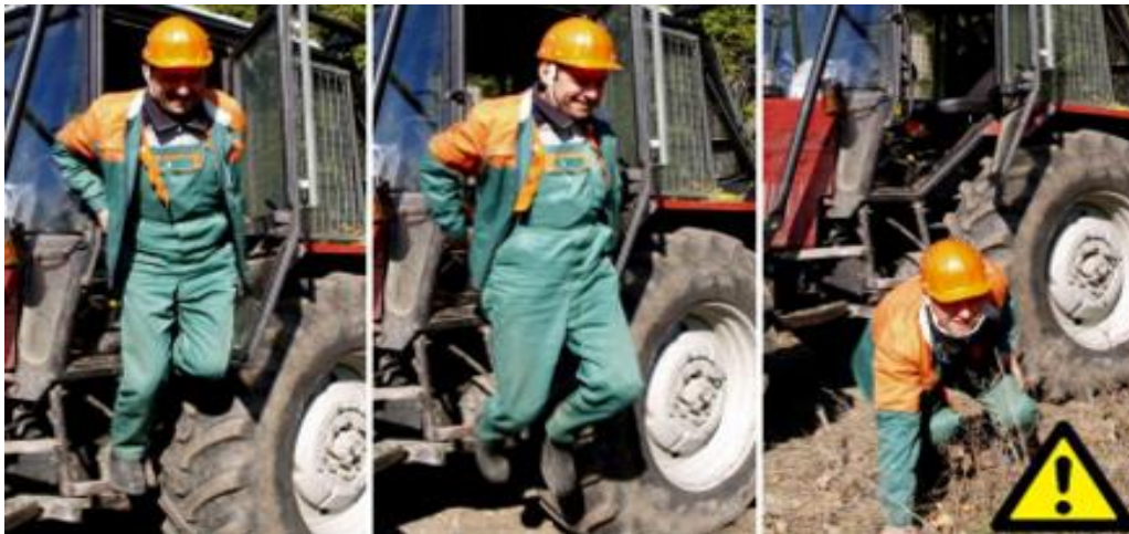
Slika 20. Nepravilan izlazak iz traktora

Na svakom stroju mora se nalaziti aparat za gašenje požara i pribor za pružanje prve pomoći. Osobna zaštitna sredstva koja se koriste na poslovima privlačenja i prijevoza drveta, propisana Pravilnikom o zaštiti na radu u Hrvatskim šumama d.o.o., jesu: