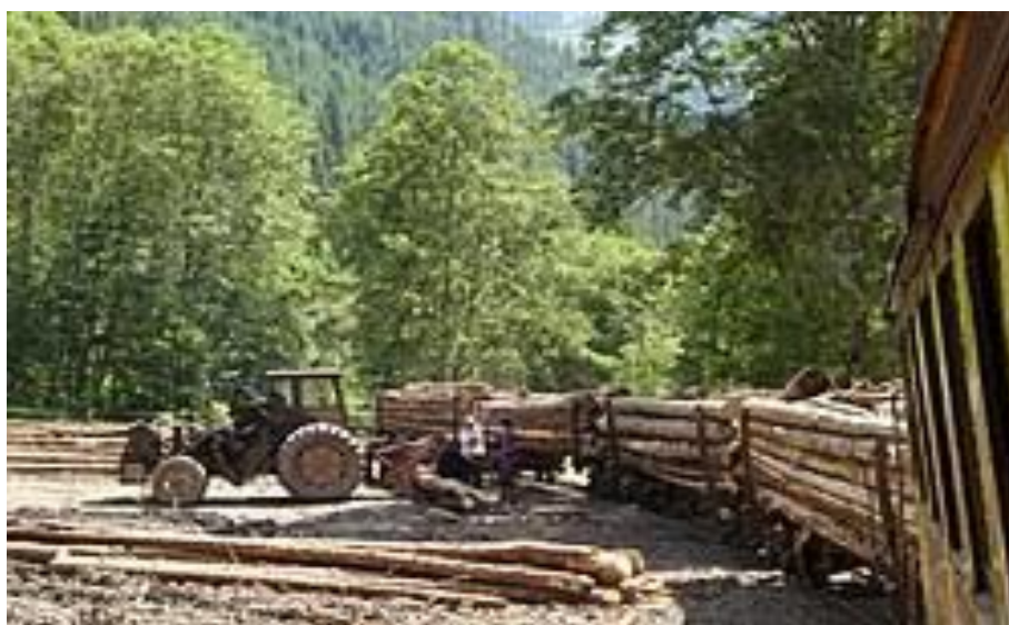
Slika 21. Transport drva vlakom

Pravilnikom o zaštiti na radu u šumarstvu (Narodne novine 10/86) u članku 95. propisano je kako se prijevoz drvnih sortimenata mora obavljati vozilima koja su za tu namjenu prilagođena. Visina pak tereta na vozilima ne smije prelaziti visinu ugrađenih ručica za osiguranje tereta. Pri prijevozu drvnih sortimenata kraćih dužina mora se osigurati oslanjanje tereta na najmanje dvije ručice. Ako se pak teret na vozilima osigurava lancima, čeličnom užadi, klamfama ili pak na drugi način mora se osigurati potpuna stabilnost tereta pri prijevozu. Slika 21. prikazuje osiguranje tereta prilikom transporta drva vlakom. Šumske ceste, mostovi i propusti moraju biti održavani u takvom stanju da je omogućen siguran prijevoz drvnih sortimenata [21].