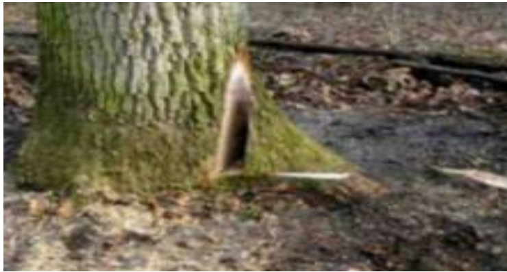
Slika 5. Obrada žilišta na stablu