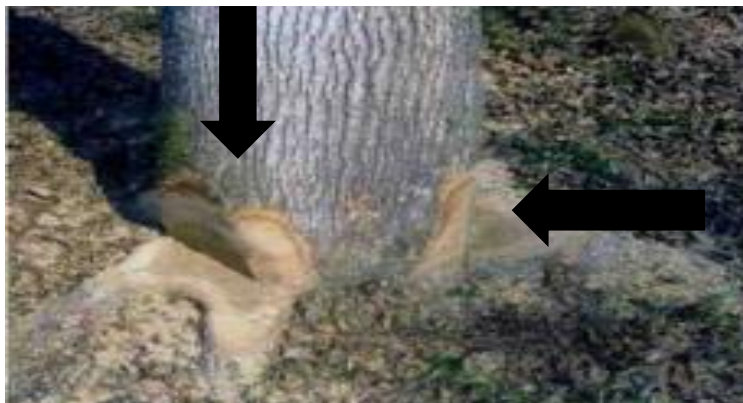
Slika 6. Obrada žilišta na stablu