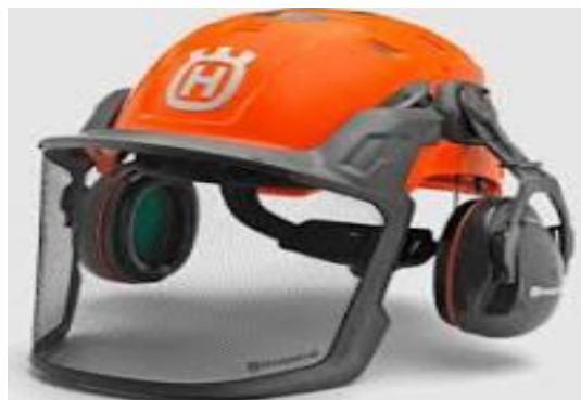
Slika 12. Zaštitna šumarska kaciga

Služi za zaštitu glave od pada predmeta, udara glavom u tvrde predmete, zaštitu očiju od piljevine pri rezanju drveta kao i zaštitu od niskih temperatura u zimi. Ove kacige imaju mrežasti štitnik za oči i zimsku podlogu. Mrežasti štitnik izrađen je od najlona ili acetatne folije i pričvršćen je na prednjoj strani kacige posebnim držačem. Štiti oči od piljevine. Zimska podloga sastoji se od tople kape koja štiti glavu, vrat i uši radnika za vrijeme hladnoće pri radu na otvorenom prostoru. Na kapi se nalazi podešavajući remen za pričvršćivanje, slika 12., [17].