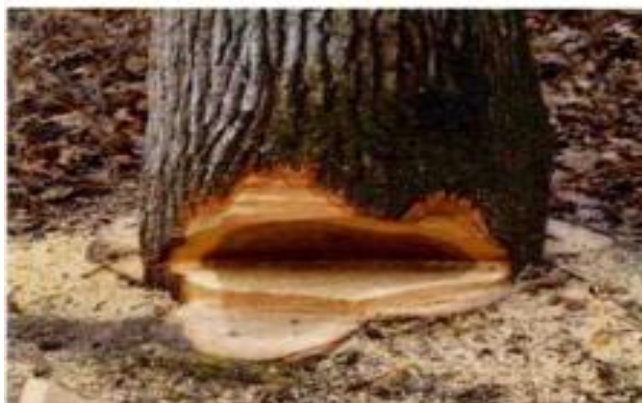
Slika 7. Izrada zasjeka na stablu

Pravilno izveden zasjek, slika 7., je kod debljih stabala vrlo važan element sigurnog obaranja stabla. Njegova osnovna funkcija je omogućavanje nesmetane rotacije stabla u početku padanja. Izvodi se na više načina ali uvijek na strani stabla u smjeru njegovog pada. Najčešći oblik zasjeka je s jednom horizontalnom ravninom piljenja i drugom pod kutom od 35° do 45° u odnosu na prvu. Stanje stabla i teren znače da se tipovi zasjeka mogu razlikovati. Potrebno je izbjegnuti da zasjek bude predubok. Ne bi trebao biti veći od 15-20 % poprečnog zasjeka visine grudi. Zasjek se izvodi u dva dijela: gornji rez i donji rez. Otvor zasjeka zavisi od korištene metode. Rezove treba izvoditi što bliže tlu, radi bolje kontrole i stabilnosti pri padanju stabla.