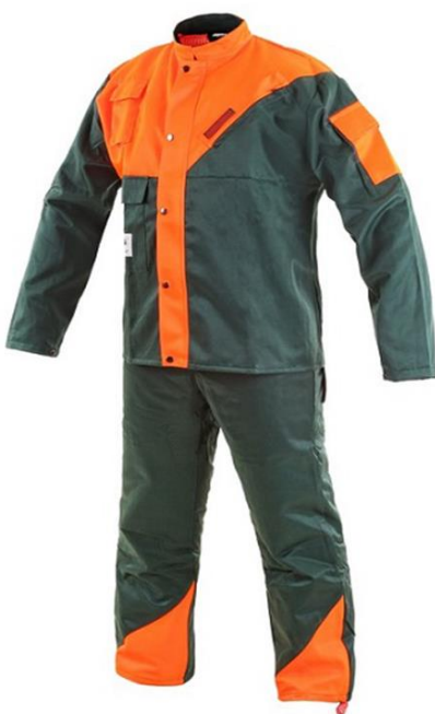
Slika 13. Radna odjeća za rad s motornom pilom

Konfiguracija i broj zaštitnih slojeva mrežice određuje sam proizvođač na osnovi ispitivanja koja potvrđuju koliki je broj slojeva zaštitne mrežice potreban da pri brzini lanca motorne pile od 20 m/s ne dođe do prorezivanja zadnjeg zaštitnog sloja mrežice [18].