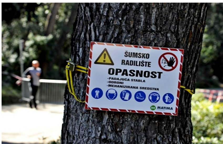
Slika 1. Šumsko radilište

i sposobnostima, uz odgovarajuća sredstva za rad i predmet rada predstavljaju temeljni čimbenik šumarske proizvodnje. Stručno osposobljeni, odgovorni, savjesni i motivirani šumarski radnici imaju odlučujuću ulogu u ostvarivanju uspješnih proizvodnih i poslovnih rezultata te čine neodvojivu sastavnicu u suvremenoj, općeprihvaćenoj paradigmi održivoga gospodarenja šumama. Danas u svijetu stalnih promjena šumarstvo se neprestano nalazi pred izazovom osiguranja kvalificirane i održive radne snage. Nedostatak šumarskih radnika postaje sve učestaliji problem u europskom i svjetskom šumarstvu, a razlog tomu su različiti globalni demografski, ekonomski, tehnološki i politički procesi, kao i specifičnosti samog sektora [1]. Za vrijeme radova izvođač radova dužan je osigurati mjesto sječe, u cilju zabrane pristupa nezaposlenima, slika 1. Na mjestima sječe izvođač radova osigurava postavljanjem posebnih oznaka, zvučnih signala, po potrebi postavljanjem dežurnog radnika i slično.