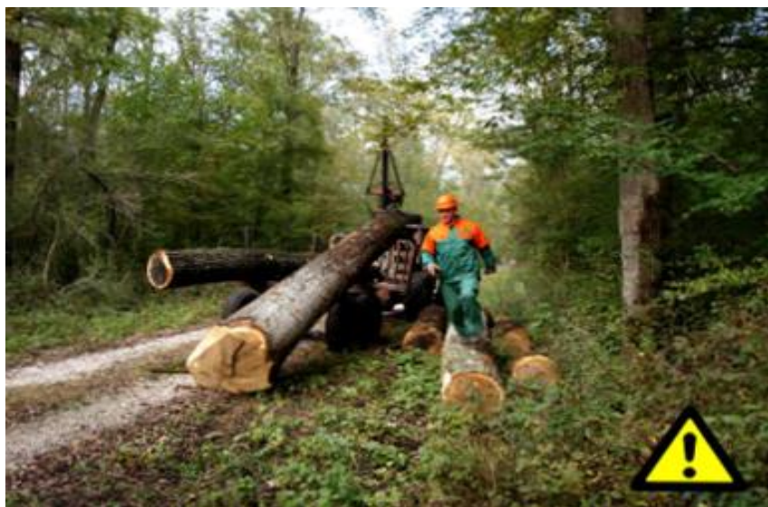
Slika 18. Gibanje radnika u opasnom području

Najčešći uzroci ozljeđivanja na utovarno-istovarnim radovima i prijevozu su: