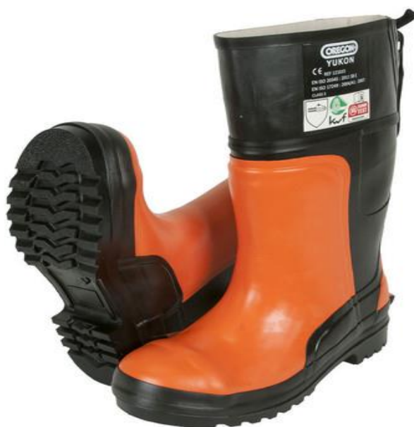
Slika 14. Zaštitne šumarske čizme