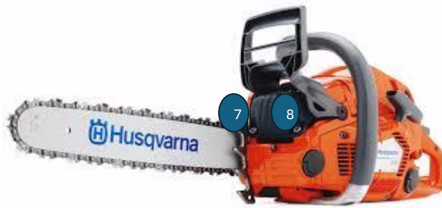
Slika 10. Zaštitne naprave na motornoj pili

U nastavku, slika 10. prikazuje, kao i prethodna slika, zaštitne naprave na motornoj pili.