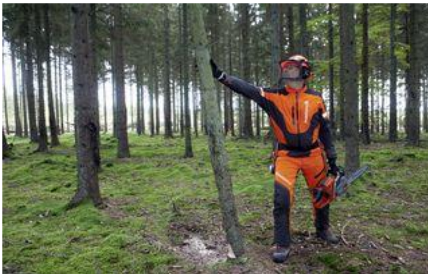
Slika 3. Izbor smjera obaranja

Kada smo odredili smjer obaranja, te utvrdili smjer odstupanja (koji mora biti pod kutom od 45^\circ lijevo ili desno suprotno od smjera rušenja) pristupa se samom obaranju doznačenog stabla.