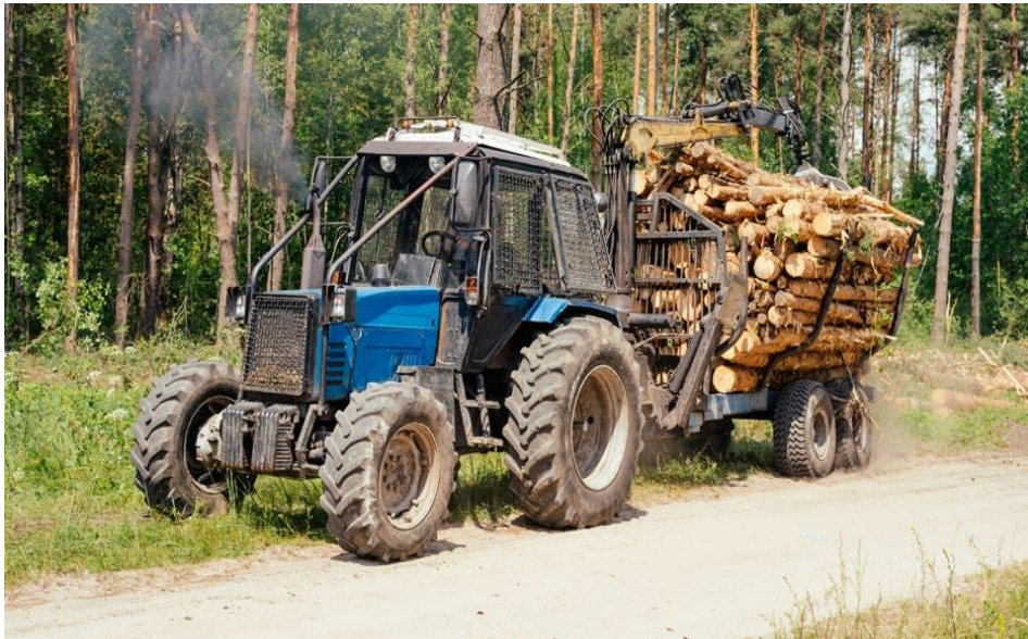
Slika 17. Izvoženje drvnih sortimenata traktorskom ekipažom

Sve poslove radnici su dužni provoditi prema pravilima struke, odnosno važećim tehnologijama i pravilima zaštite na radu u što ulazi: ispravnost stroja ( dužni su ga provjeriti prije početka rada, provjeriti posjeduje li stroj protupožarni aparat i kutiju prve pomoći.