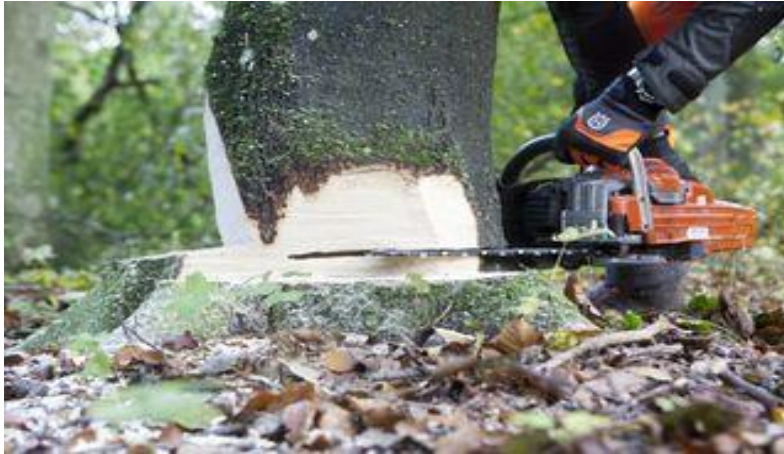
Slika 8. Potpiljivanje stabla