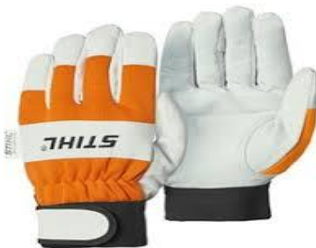
Slika 15. Antivibracijske rukavice

Kada govorimo o zaštiti ruku tada su jako bitne zaštitne rukavice različitih vrsta i veličina. Neke od njih imaju pojačanja na dlanovima, neke na prstima, neke ne propuštaju vodu što je dobro za rad u šumu, zatim rukavice koje su iznutra zadebljane za lakši rad sa užetom te antivibracijske rukavice, slika 15., za rad sa motornom pilom i drugim vibrirajućim strojevima i alatima.