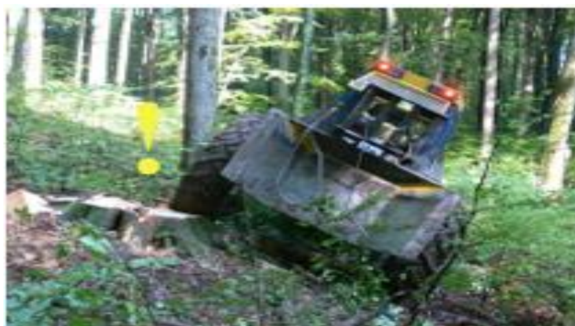
Slika 23. Nailazak na panj prilikom kretanja unazad

Ukoliko preko neke izbočine na nagnutom terenu prijeđemo prebrzo "donjim" kotačem, može doći do prevrtanja stroja, slika 23.