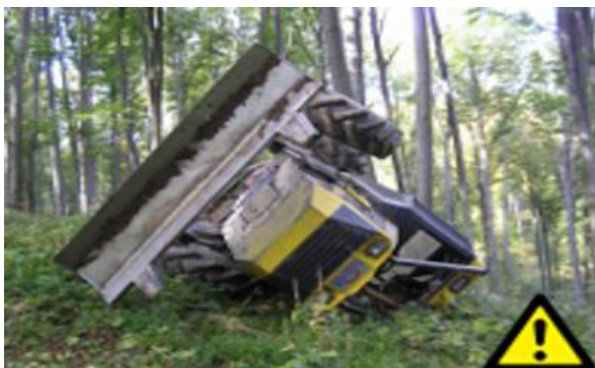
Slika 22. Posljedica nepravilnog rada

Ukoliko preko neke izbočine na nagnutom terenu prijeđemo prebrzo "donjim" kotačem, može doći do prevrtanja stroja, slika 23.