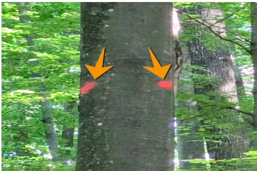
Slika 2. Doznačeno stablo

Prije samog obaranja, radnik mora pronaći doznačeno stablo. Nakon toga, pristupa se izboru pravilnog smjera obaranja tj. pravca u kojem će stablo padati te utvrdili smjer odstupanja, slika 4., koji mora biti pod kutom od 45^\circ lijevo ili desno suprotno od smjera rušenja.