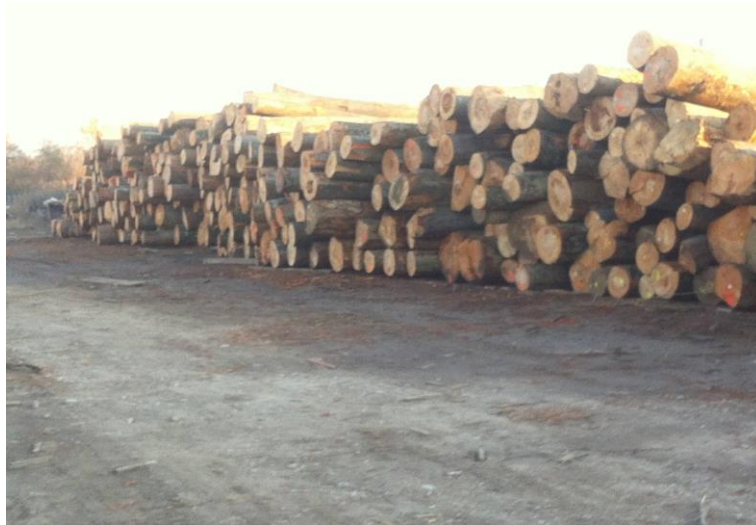
Slika 2. Skladište drvnog sortimenta [1]

Istovareni i složeni drvni sortiment na skladištu transportiraju se do pogona pilane. Transport do pogona može se obavljati pomoću viličara ili najčešće lančanog transportera. Viličarom se podiže drvni sortiment sa skladišta i postavlja na transporter koji ga odvozi na preradu.