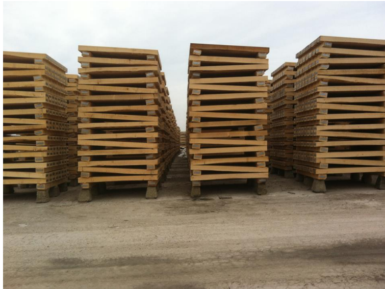
Slika 3. Skladištenje i sušenje pragova [1]

Opasnosti prilikom skladištenja i sušenja ispunjenih pragova :