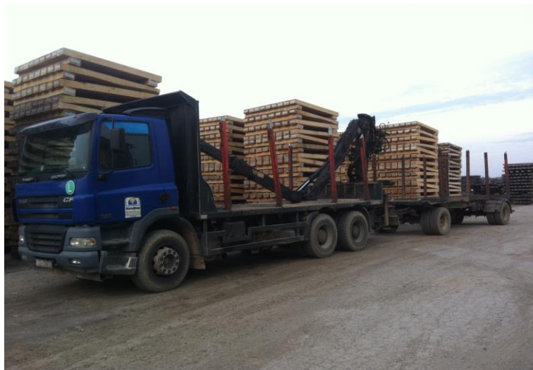
Slika 1. Vozilo za prijevoz i istovar drvnih sortimenata [1]

Prijevoz i istovar drvnih sortimenata obavlja se uglavnom prijevoznim sredstvima koji imaju ugrađene posebne dizalice za hvatanje drvnih sortimenata radi istovara ili premještanja s jednog mjesta na drugo (slika 1).