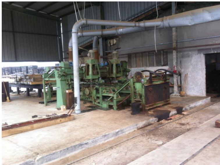
Slika 4. Linija za blanjanje pragova [1]

Zaravnavanje pragova vrši se na liniji za blanjanje koja poravnava mjesto na pragovima gdje dolazi ploča za šine. Prilikom prolaska pragova linijom, radnik zadužen za numeriranje pragova utiskuje numerator sa godinom proizvodnje praga. Po završetku zaravnavanja, pragovi se slažu u vagone kojima se dopremaju do impregnacijskih cilindara ( slika 4) [1].