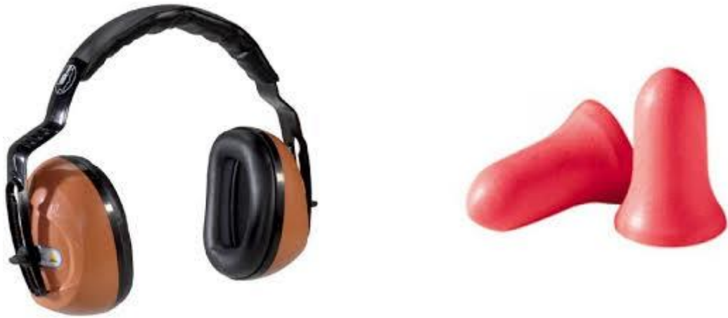
Slika 8. Osobna zaštitna sredstva za zaštitu sluha [4]

Kod radnika koji su većim djelom izloženi buci jednakoj ili većoj od dopuštene može doći do oštećenja sluha. Prvo dolazi do oštećenja zamjedbene komponente sluha i to u visokim frekvencijama. Taj dio slušnog polja je izvan govornog područja sluha te radnici takva oštećenja sluha ne primjećuju. Radnici koji su svakodnevno izloženi buci potrebno je prije stupanja u rad ispitati sluh, tj. učiniti tzv. ulazni audiogram. Na osnovu njega specijalist medicine rada na svakom liječničkom pregledu procjenjuje jeli došlo do oštećenja sluha uspoređujući novi nalaz sa prethodnim audiogramima.