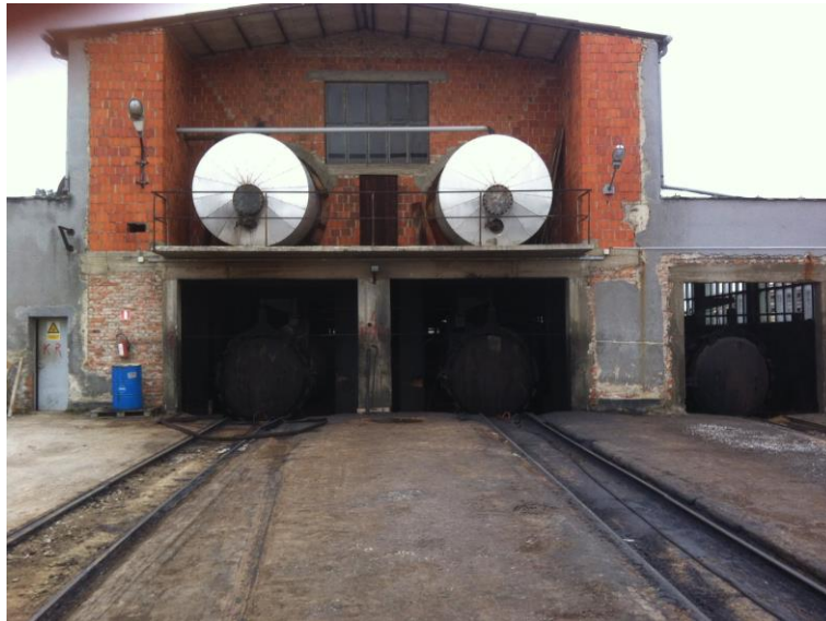
Slika 6. Operacioni cilindri impregnacije [1]