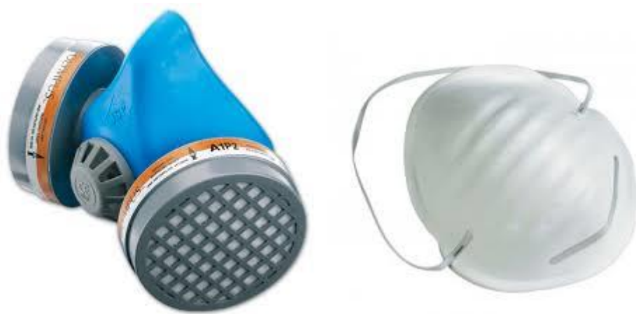
Slika 7. Respiratori za zaštitu dišnih organa [3]