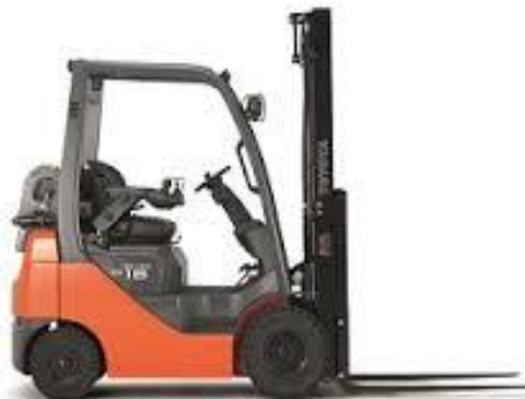
Slika 10. Viličar za transport pilanom [22]

Rukovatelj viličarom u pilani obavlja poslove transporta poluproizvoda i gotovih proizvoda unutar kruga tvrtke. Rukovatelj viličarom mora biti osposobljen za siguran rad na viličaru, te mora imati položen stručni ispit za rukovatelja viličarom. Rukovanje viličarom spada pod posao sa povećanim rizikom, s posebnim uvjetima rada ( Čl. 3, točka 2, 16, 18, 19). Većina poslova rukovanja viličarom se obavlja u pilani, a manji dio vremena u dvorišnom prostoru tvrtke ( tablica 7, 8 ).