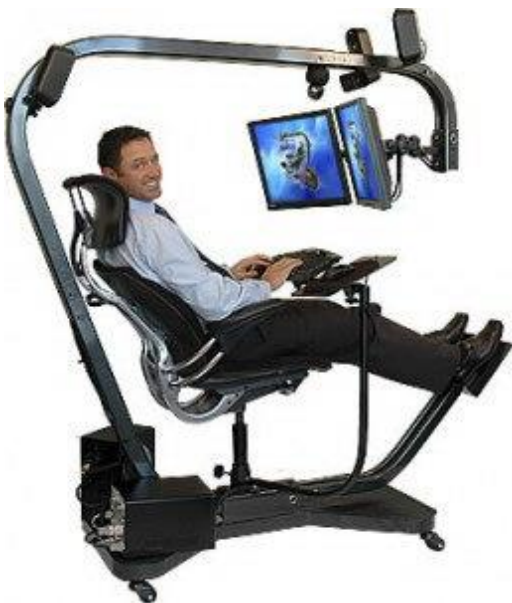
Slika 1. Prilagodba računalne opreme čovjeku

Današnji ljudi žive u jako stresnom vremenu. Ubrzani način života i vremensko ograničenje prisiljava ljude da se izlažu veliki fizički i psihičkim naporima koji prelaze granice tjelesne izdržljivosti te povećava rizik nastanka ozljeda. Najčešće su ozljede leđa, vrata, koljena, ramena i ruku. Ergonomija se bavi suzbijanjem tih ozljeda, tj. poboljšanjem uvjeta i proizvoda rada, smanjenjem opasnosti od ozljeda, te promicanjem zdravih stavova društava prema životnom radnom okolišu. Nitko nikada nije obraćao pažnju na namještaj, stolove, stolice, boje kojima su obojani zidovi i ostale čimbenike udobnog prostora. No, pokazalo se da rezultati rada često ovise upravo o uređenju i komfornosti prostora. Stoga ih ergonomija, kao znanost, ne zanemaruje, nego ističe njihovu važnost. Osnovna njena zadaća je potpora radnicima u njihovom poslu, tako što čini posao sigurnijim, komfornijim i produktivnijim.