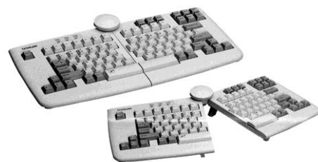
Slika 6. Lexmark-ova tipkovnica

Lexmark je izbacio tipkovnicu podijeljenu na dva dijela koji se u gornjem dijelu mogu spojiti plastičnim kotačićem. Slične primjere slijedili su i Key Tronic, Cherry, Matsushita, BTC, ukratko, sve tvrtke koje drže do svog imena, a između ostalog proizvode i tipkovnice pokušale su napraviti što ergonomičniju tipkovnicu.