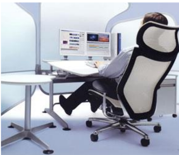
Slika 3. Ergonomska stolica za zdravu kralježnicu

Tekstil koji se koristi za izradu stolice mora pokazivati izrazitu otpornost na konstanto korištenje u skladu s EN ISO 12947-2:1998, ISO 105-E01:1994, ISO 105-X12, ISO 105-B02, EN ISO 12945-2:2000, ISO 5077:1984, ISO 3759 i ISO 6330 normama.