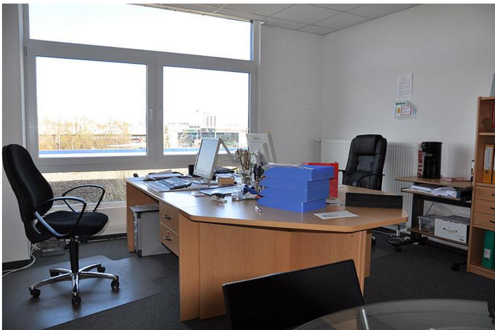
Slika 9. Ured tajnice

Priznata pravila zaštite na radu su pravila iz stranih propisa, to su znanstveno dokazani ili u praksi provjereni načini (postupci), pomoću kojih se otklanjaju ili smanjuju opasnosti na radu, odnosno kojima se sprječavaju ozljede, profesionalne bolesti te druge štetne posljedice za osobe na radu. Primjenjuju se ukoliko ne postoje propisana pravila zaštite na radu. Važno je pri usvajanju priznatih pravila, primijeniti načelo radnog prava in favorem laboratores (tj. ukoliko je neko pravo na različit način utvrđeno u dva ili više stranih propisa, primjenjuje se za radnika – najpovoljnije pravo).