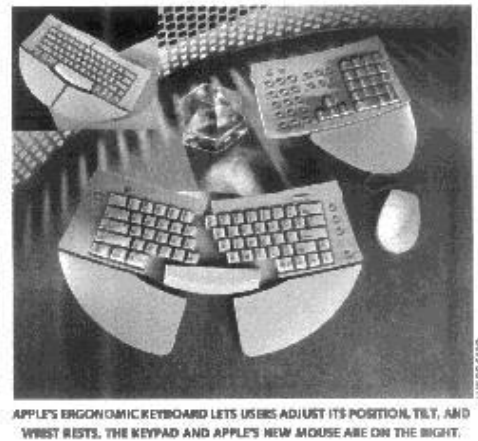
Slika 5. Apple Adjustable Keyboard

Ovo rješenje nije naišlo na neko veće oduševljenje korisnika, i vladalo je zatišje sve do 1993., kada je Apple proizveo svoju Adjustable Keyboard. Tipkovnica je izvedena tako da je alfanumerički dio izdvojen, a osnovni dio se može po sredini proširiti rotiranjem lijevog i desnog dijela oko gornje točke, a ispod obje polovice osnovnog dijela dodano je postolje za dlan. Nakon toga uslijedila je bura.