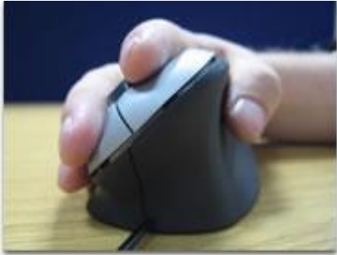
Slika 7. Ergonomski miš

Miš bi trebao biti pored tipkovnice tj. ispred zaposlenika. Najbolje bi bilo kad bi miš i tipkovnica bili na istoj površini. Lakat ne smije biti položen na stol jer time bespotrebno opterećujemo zglobove ruku. Dugotrajan rad s naslonjenim zglobovima može izazvati bolove te otežati rad zaposlenika. Ergonomski miševi, isto kao i tipkovnice, moraju biti prilagođeni ljudskoj šaci, tako da dobro prijanjaju u ruku. [5]