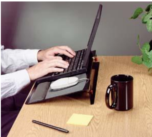
Slika 8. Prilagodljiva platforma za notebook računala

Prijenosna računala su specifična po tome što ih možemo koristiti bilo gdje što povlači veća naprezanja ovisno o mjesto na kojem radimo i u kakvom položaju je naše tijelo. Ozlijeđe kod zaposlenika može izazvati i sam dizajn svojstven za prijenosna računala. Jedan od takvih problema se javlja kod tipkovnica. Dok na kućnim računalima imamo prostrane tipkovnice sa velikim tipkama, na prijenosnim računalima imamo manje tipke koje su nagurane kako bi se što bolje nadoknadio nedostatak prostora. Stalno tipkanje na takvoj tipkovnici kroz dulje vrijeme može uzrokovati ozljedu. Također je bitno kakav smo položaj zauzeli dok radimo na računalu. Pravilan položaj tijela dok tipkamo je ključ za izbjegavanje ozljeda. Međutim blizina tipkovnice ekranu prisiljava zaposlenike da zauzmu položaj ljudskog upitnika. Ako postavimo tipkovnicu na ispravnu visinu onda nam je ekran prenisko. S druge strane ako pak postavimo ekran u razini očiju tada nam je tipkovnica previsoko. Stoga prvo treba tipkovnicu postaviti na ispravnu udaljenost, a zatim font na monitoru povećati ili smanjiti po potrebi. Unatoč velikoj praktičnosti prijenosnih računala plaća se velika cijena po pitanju ergonomičnosti, a to je velika opasnost za naše zdravlje. U današnje vrijeme sve veći broj zaposlenika koristi prijenosno računalo stoga se preporuča da češće uzimaju kratke pauze. Povremenim ustajanjem i istežanjem imat će manje problema s lošom ergonomijom i lakše će podnositi sav napor na radnom mjestu.[6]