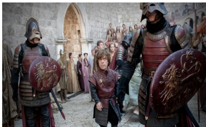
Slika 3. Kraljev Grudobran, Igra prijestolja , Dubrovnik, 2012.