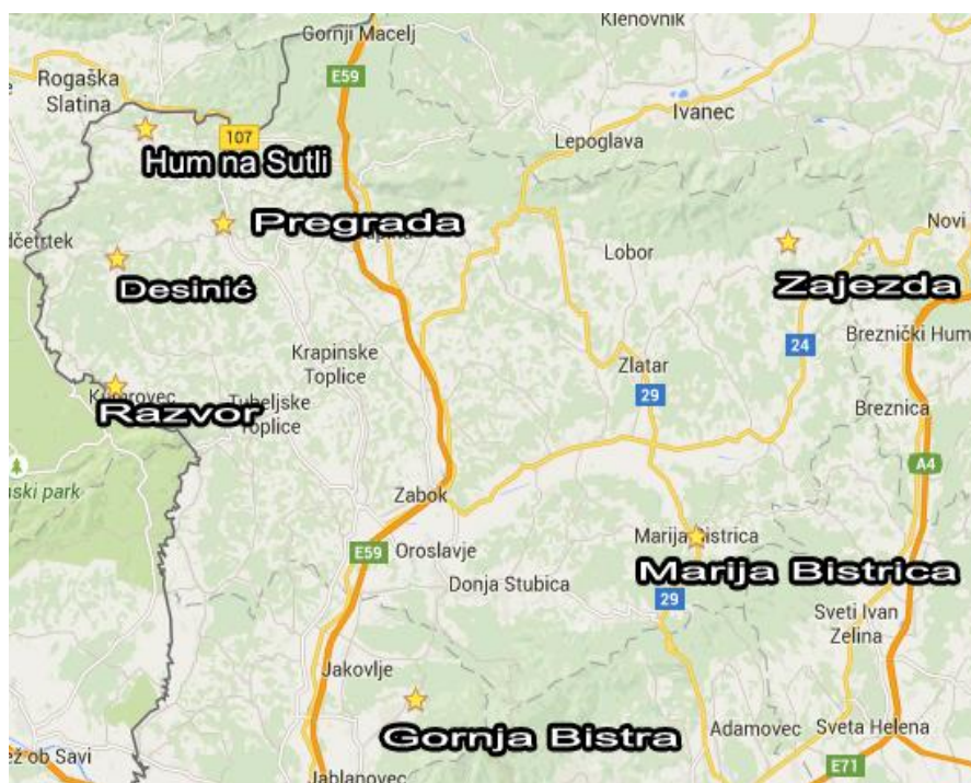
Slika 10. Dvorci Hrvatskog zagorja.

Prema opisanom stanju da se zaključiti s kolikim potencijalima raspolaže ovaj dio Hrvatske. U smislu koristi za filmsku industriju, korist leži u tome što studiji nebi imali potrebe za korištenjem računalne animacije, a snimali bi na autentičnim lokacijama, te bi tako smanjili troškove produkcije. Za turiste, korist je u tome što bi imali priliku upoznati i druge krajeve Hrvatske osim obale, a koji su jednako atraktivni.