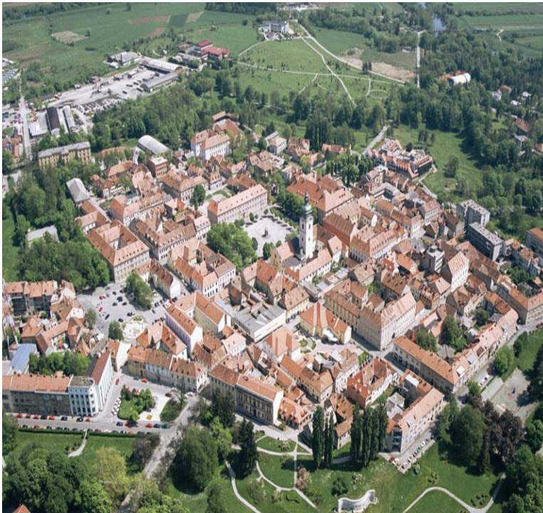
Slika 9. Karlovačka gradska jezgra.