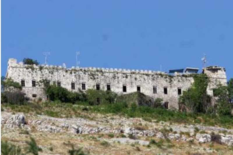
Slika 6. Tvrđava Imperial.