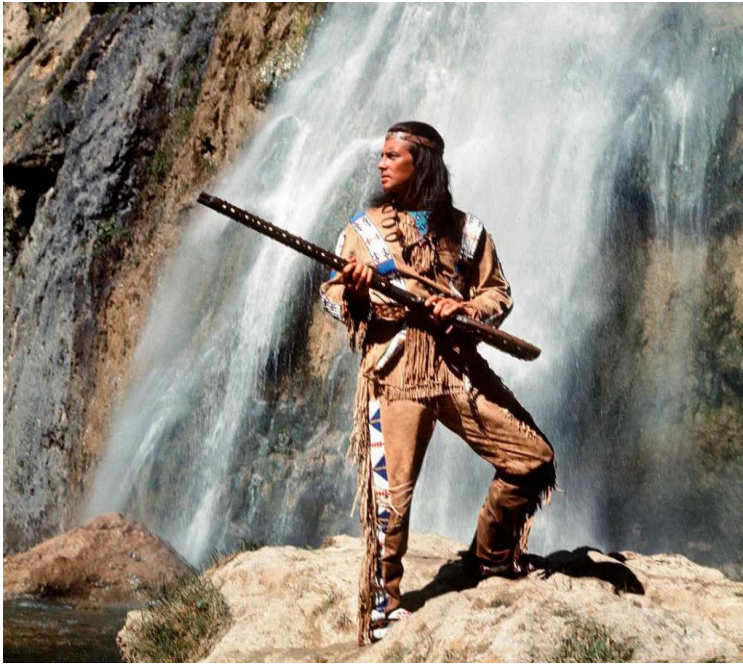
Slika 8. Prizor iz Winnetou serijala.