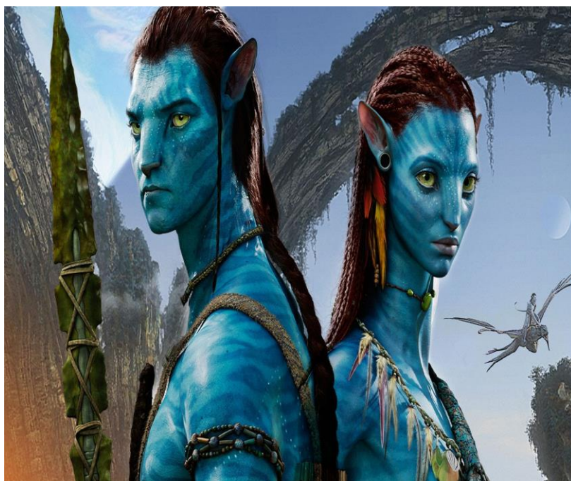
Slika 1. Avatar .