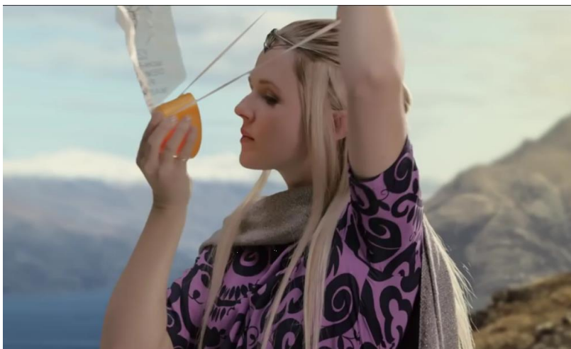
Slika 4. Kampanja Air New Zealanda.

Zbog svega navedenog, marketinški stručnjaci i turoperatorji brandiraju Novi Zeland kao Međuzemlje (fiktivno mjesto radnje Gospodara prstenova i Hobita ). Tako čak i glavna aviokompanija u reklamnim spotovima ima lokacije, magiju, pa čak i glumce iz originalne trilogije.