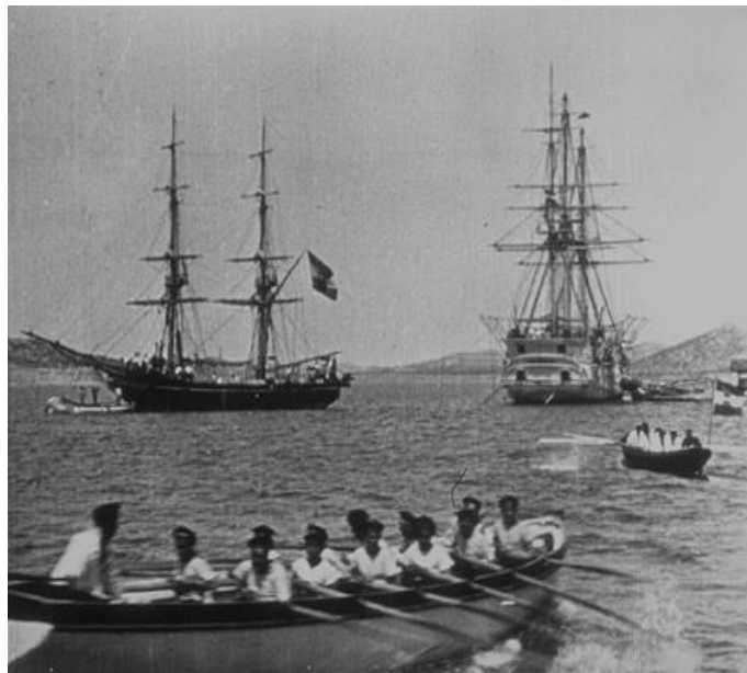
Slika 2. Alexandre Promio: manevri mornarice u Šibeniku, 1898.