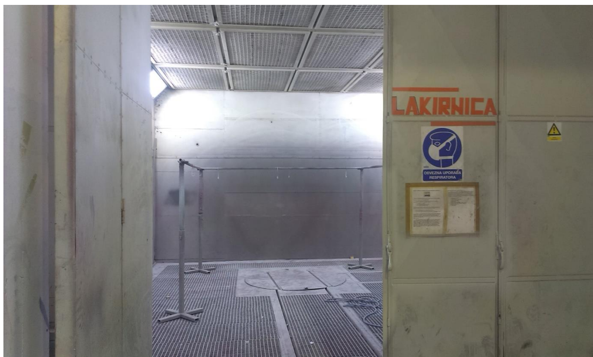
Sl.7: Kabina za ličenje [1]

Ličenje komada iz montaže se vrši u slučaju kad proces proizvodnje zahtjeva montažu (pripasivanje) komada, a nakon demontaže, ličenje, po zahtjevu radne operacije iz radne dokumentacije. Nakon sušenja komad se vraća u montažu.