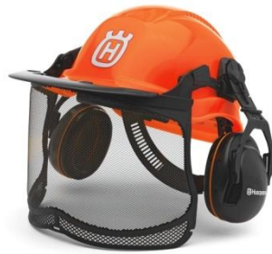
Sl.9. Zaštitna šumarska kaciga[9]

vrijeme hladnoće pri radu na otvorenom prostoru. Na kapi se nalazi podešavajući remen za pričvršćivanje.(Sl.9)