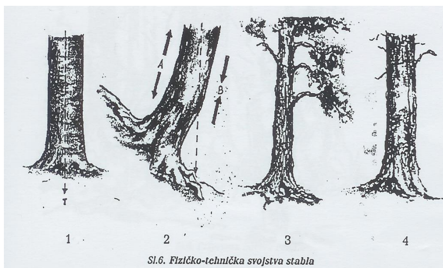
Sl. 2. Fizičko-kemijska svojstva stabla[2]

Priprema rada najvažniji je dio kod sječe stabala. Radnik mora odabrati tehniku rada, tj. mora posebno obratiti pozornost na fizičko-tehnička svojstva stabla (uspravno stablo 1, nagnuto stablo 2, neujednačeni rast 3, trulo drvo 4).(Sl.2)