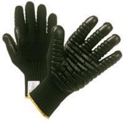
Sl.12. Antivibracijske rukavice[12]