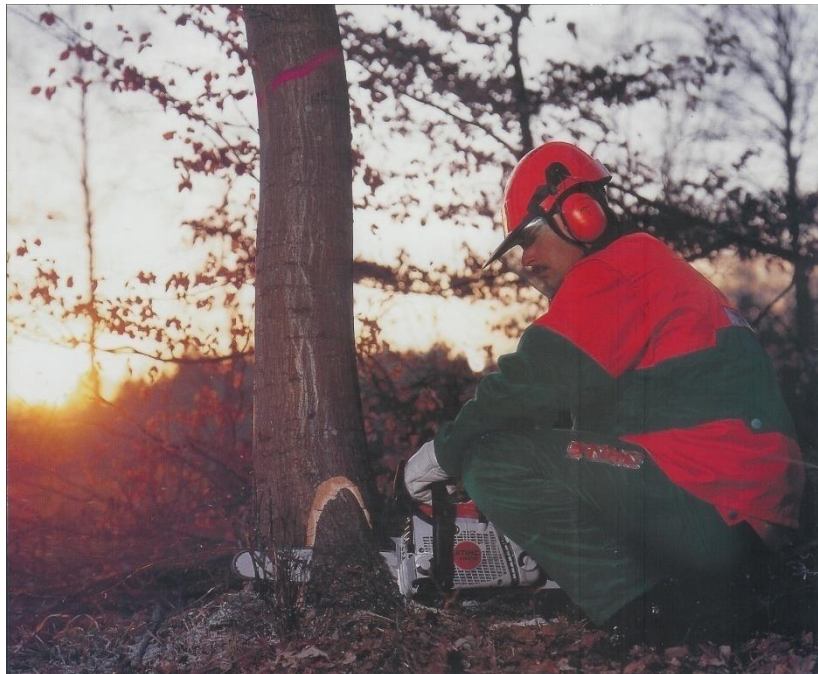
Sl. 5. Rušenje stabla[5]

Nakon obaranja stabla pristupa se kresanju grana koje treba kresati od donjeg dijela stabla prema vrhu i to sa suprotne strane debla od mjesta stajanja radnika kako bi izbjegao udar sjekire i ozljede nogu. Trupljenje debla smije započeti tek kada se deblo postavi na čvrsto i stabilno tlo. Pri pomicanju debla se mora koristiti i pomoćni alat kao što je okretaljka, capin, poluga i slično. Također valja voditi računa o tome da ne dođe do pada trupca na noge radnika koji obavlja trupljenje. Rukovanje drvnim materijalom je opasan posao i radnik se treba pridržavati određenih uputa i upozorenja za rad na siguran način.(Sl.5)