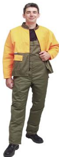
Sl.10. Radno šumarsko odijelo[10]

Konfiguracija i broj zaštitnih slojeva mrežice određuje sam proizvođač na osnovi ispitivanja koja potvrđuju koliki je broj slojeva zaštitne mrežice potreban da pri brzini lanca motorne pile od 20 m/s ne dođe do prorezivanja zadnjeg zaštitnog sloja mrežice.(Sl.10)