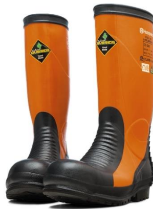
Sl.11. Zaštitne čizme[11]

Za rad u šumi osim zaštitnom odjela i jakni izuzetno su važne i zaštitne cipele koje moraju imati zaštitnu kapicu, ojačane gumom protiv klizanja te da su što udobnije i lake za obuvanje i izuvanje. Moraju biti sa pojačanom zaštitom prstiju i odobrenom gumom otpornom na visoku temperaturu. Prostrane, sa potplatom protiv klizanja. Rub na peti pomaže kod skidanja čizme.(Sl.11)