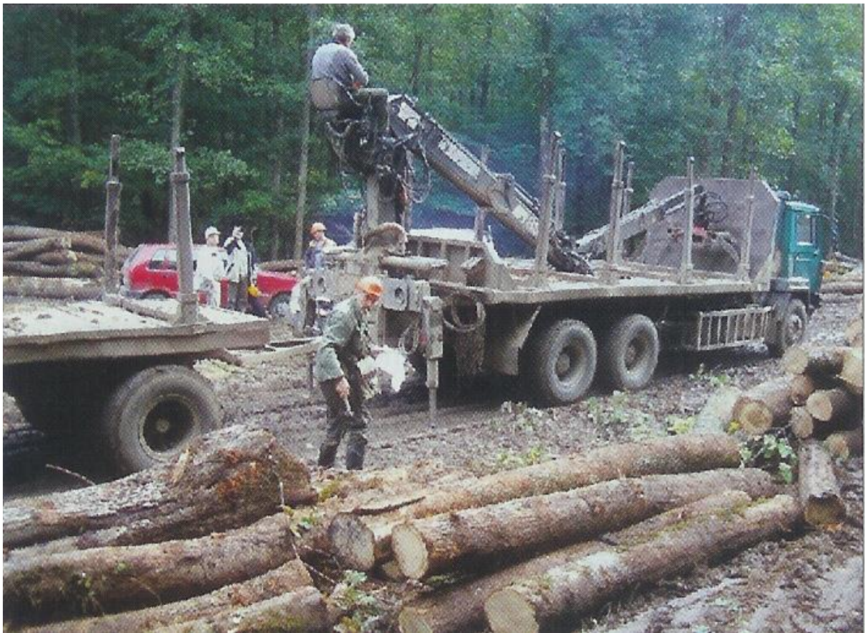
Sl.8. Otprema i prijevoz drvnih sortimenata[8]

U prošlosti se i ovaj dio radnog procesa vršio pomoću kola sa stočnom vučom, a danas se obavlja suvremenim kamionima s hidrauličnim dizalicama kojih ima raznih vrsta.