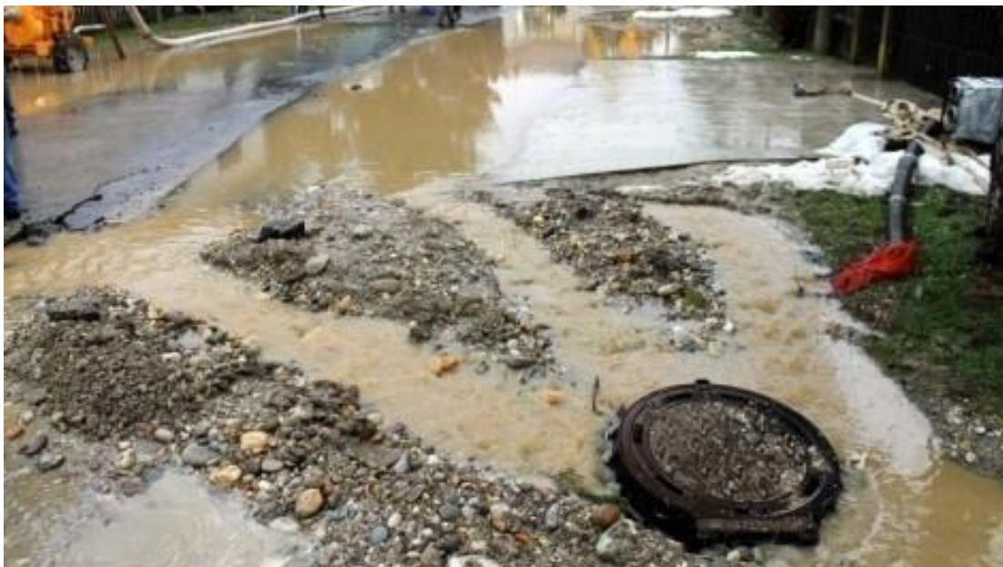
Slika4. Prikaz oborinskih otpadnih voda

Ove vode formiraju se kao površinski oticaj od padalina ili topljenog snijega sa urbanog područja. U ove vode se ubrajaju i otpadne vode od pranja uličnih površina, trotoara, kolnika... Količina i kvaliteta ovih otpadnih voda zavisi o inteziteta i učestalosti padalina, od načina održavanja javne higijene, od broja i intezititeta motornog prometa, vrste površinske obrade terena i prometnih površina, zagađenja atmosfere, klimatskih uvjeta... Po ukupnoj bakteriološkoj zagađenosti, oborinske otpadne vode su slične sanitarnim. Međutim, oborinske otpadne vode sa industrijskih površina nose značajne količine bakra, olova, arsena, sa asfaltnih površina naftne produkte što dodatno ugrožava sanitarne čvorove. Nažalost, praksa je da se ove vode ne pročišćavaju, jer se smatraju čistima, što nekad nije tako upravo iz navedenih razvoja.