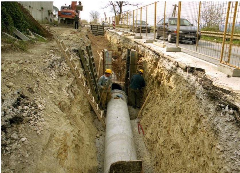
Slika5. Slika kanalizacijskog sustava

Kanalizacijski sustav odvodi otpadne tvari, ali i energiju (toplinu). Njima se odvođe kućanske (sanitarne) vode, industrijske otpadne vode i poljoprivredne vode.