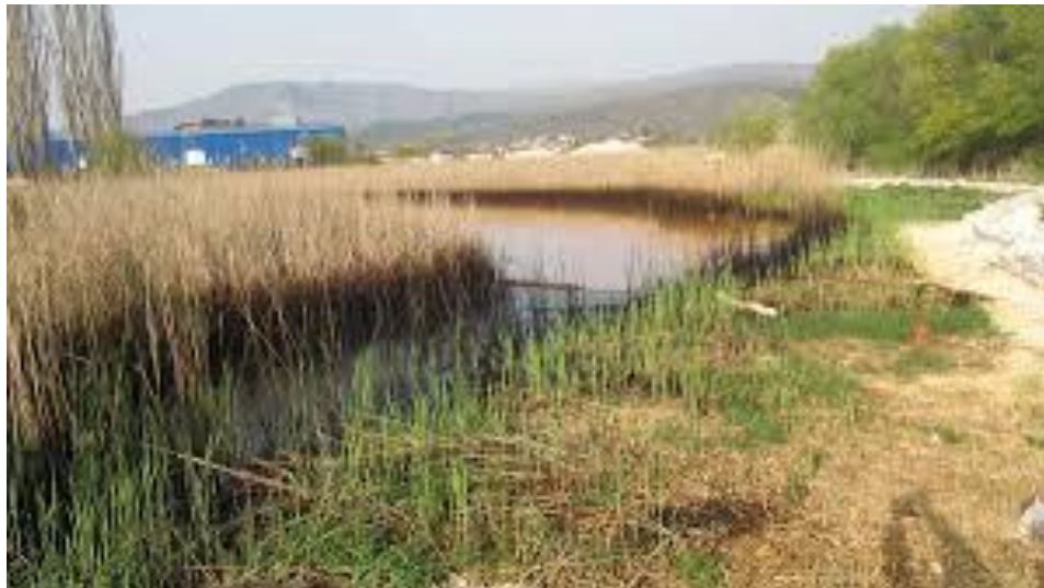
Slika3. Prikaz poljoprivrednih otpadnih voda

Sastav poljoprivrednih otpadnih voda ovisi o primjenjenoj tehnologiji obogaćivanja zemljišta gnojivom, hranjivim tvarima, primjenjenim herbicidima, biocidima, fungicidima i poljoprivrednim kulturama koje se pretežno na određenim područjima uzgajaju.