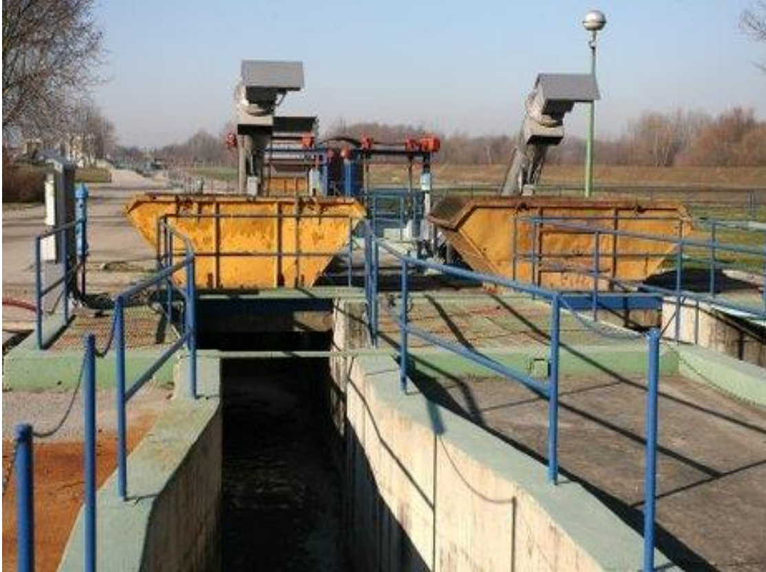
Slika10. Prikaz kanalizacijskog sustava

Javni kanalizacijski sustav sakuplja i provodi otpadnu vodu kućanstava, oborinsku vodu (koja ispire i nosi onečišćenja sa prometnih i okolnih poljoprivrednih površina) kao i obrađenu i neobrađenu industrijsku otpadnu vodu. Sakupljena otpadna voda se nakon pročišćavanja ili nepročišćena, ispušta u rijeku ili more uz obalu.