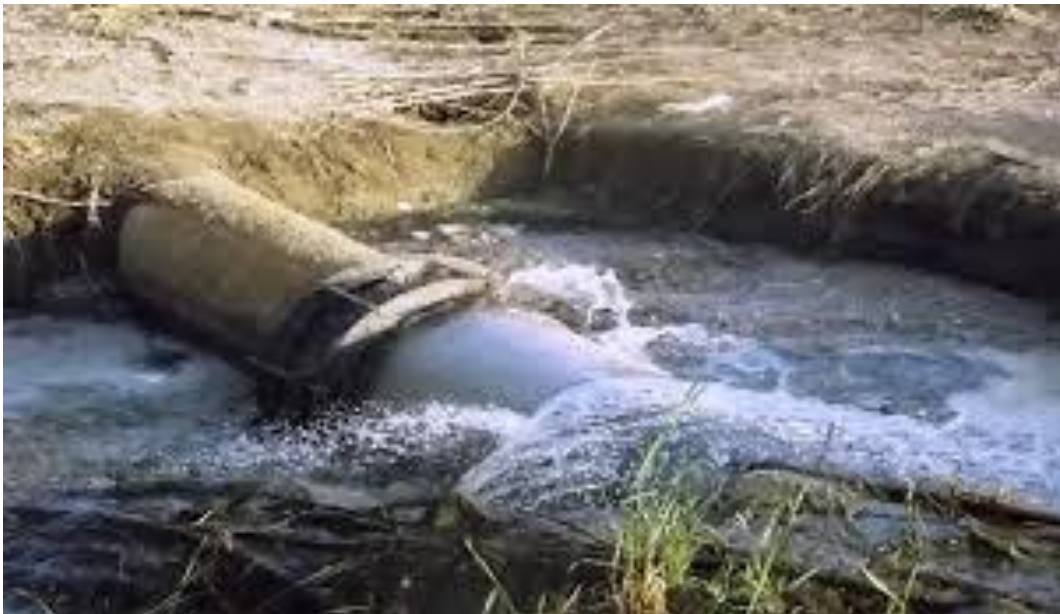
Slika 1. Prikaz neadekvatnih objekata za odvodnju otpadnih voda

Nažalost se i danas još otpadne vode često ispuštaju bez pročišćavanja u prirodne recipijente kao što je prikazano na slici 1.