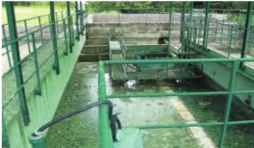
Slika7. Mehaničko-biološki uređaj

Može biti statička i pokretna, gruba i fina. Služi za odstanjivanje grubih plivajućih tvari (lišće, tkanine, iverje, granje), dlake (mesna industrija) i slično.