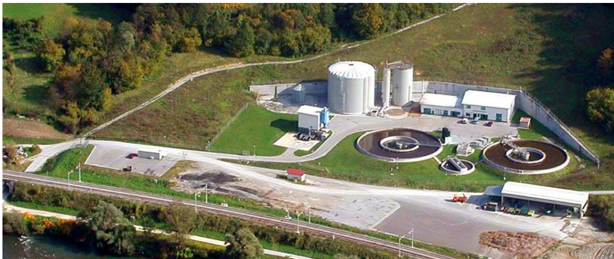
Slika8. Mehaničko-kemijsko-biološki urežaj