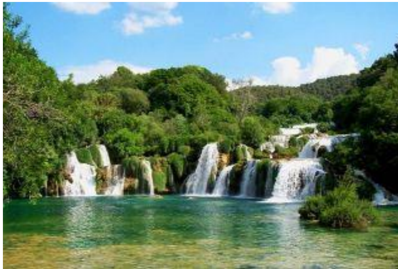
Slika12. Zastita voda uključuje načelo održivog razvitka i jedinstvo vodnog sustava

Zaštita voda uključuje načelo održivog razvitka i jedinstvo vodnog sustava radi osiguranja odgovarajućeg vodnog režima (količina i kakvoća voda), koji se temelji na odredbama Zakona o vodama , Državnog plana za zaštitu voda , propia iz područja zaštite voda od onečišćenja, te uvažavanju i drugih dokumenata, kao što su : Zakon o zaštiti prirode , Zakon o zaštiti okoliša , Nacionalna strategija zaštite okoliša i Nacionalni plan djelovanja na okoliš , Zakon o komunalnom gospodarstvu . U zaštiti voda važno je respektirati i međunarodne uvjete koje je Republika Hrvatska potpisala i potvrdila u postupcima ratifikacije, a odnose se na provedbu mjera i izgradnju vodnih građevina za zaštitu voda.