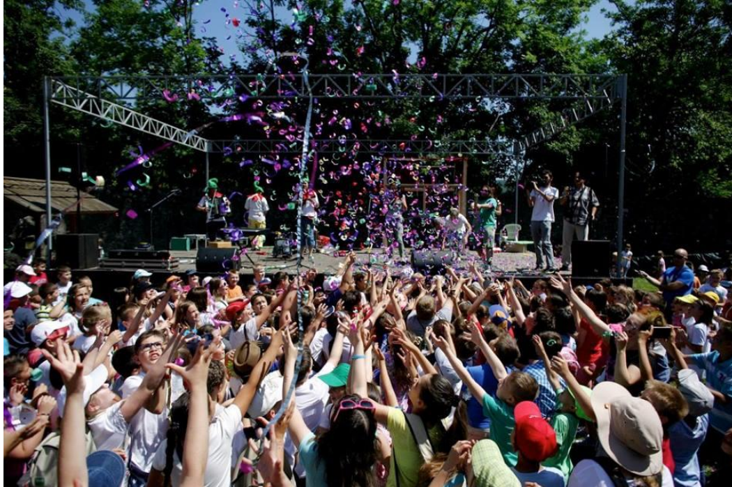
Slika 30. Ogulinski festival bajke