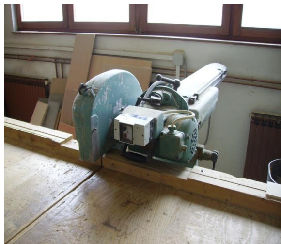
Slika 2. Savijača cijevi [izrada autora] Slika 3. Stolarska radionici [izrada autora]