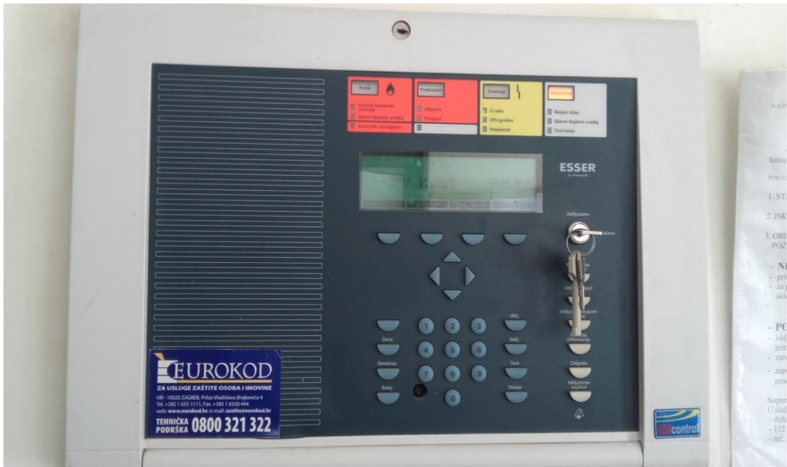
Slika 21. Vatrodajava [izrada autora]