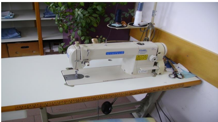
Slika 4. Šivaća mašina