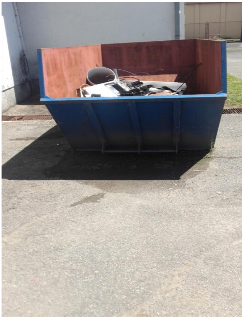
Slika 24. Spremnik za željezo i legure željeza [izrada autora]