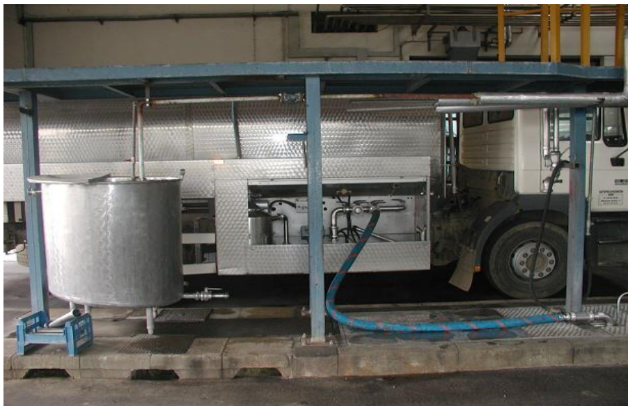
Slika 3. Linija za prijem mlijeka

Prijem mlijeka sastoji se od tri prolazne linije za istakanje mlijeka i pranje kamiona-cisterni, oprema je instalirana u dvije linije.