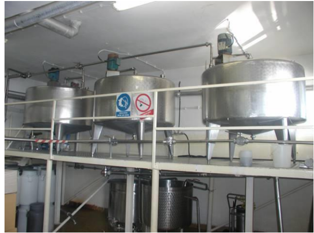
Slika 10. Linija fermentiranih proizvoda