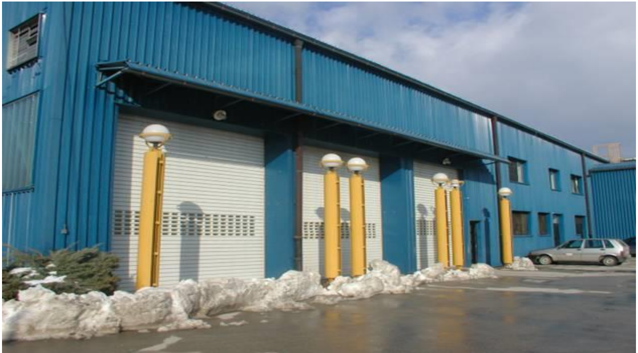
Slika 2. Mljekara

Objekti se sastoje od dvije proizvodne hale, dva skladišta, uredskih prostorija, kantine, hladnjača i odvojenih objekata za trafo stanicu i kotlovnicu. Detaljniji prikaz objekata nalazi se u Dodatku 1.