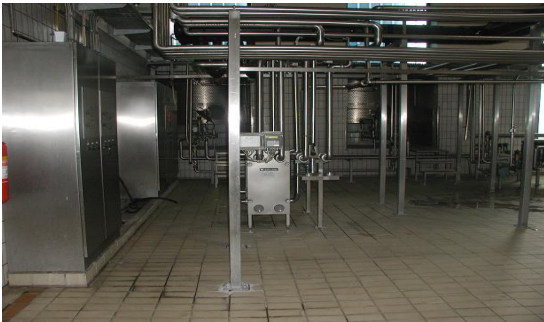
Slika 5. Linija za pasterizaciju mlijeka