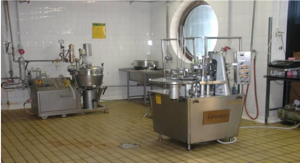
Slika 7. Stroj za punjenje sirnog namaza