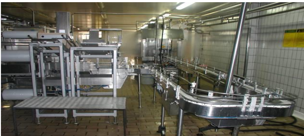
Slika 8. Stroj za punjenje pasteriziranog mlijeka