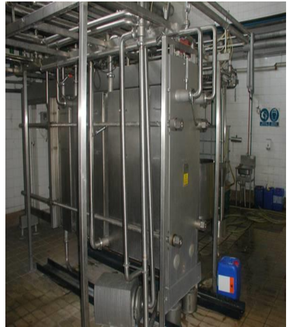
Slika 11.Linije za trajno mlijeko

U slijedećoj tablici nalaze se raspoloživi proizvodni kapaciteti i stvarna razina proizvodnje za 2005.