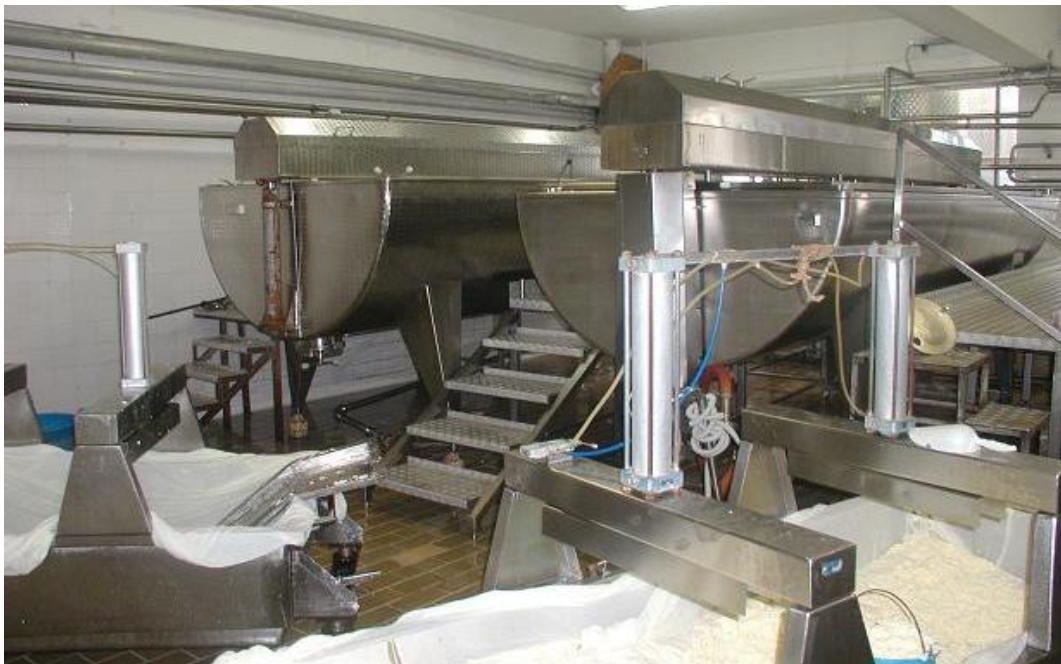
Slika 9. Kade za sir