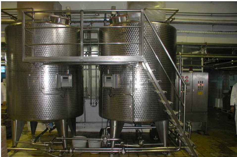
Slika 6. Kotlovi za fermentaciju