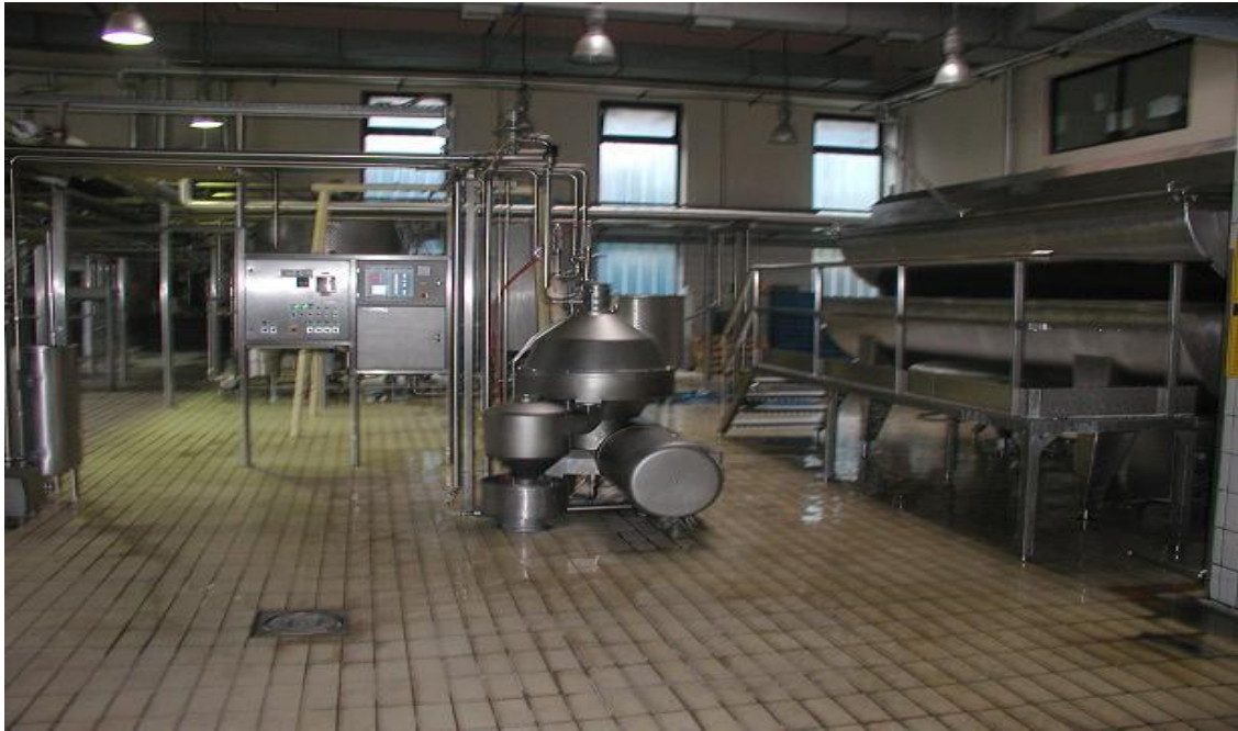
Slika 4. Linija za pasterizaciju mlijeka