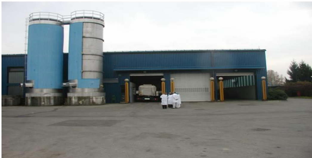
Slika 12. Skladište opasnih tvari