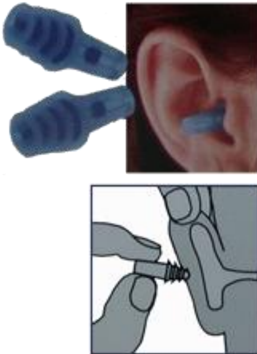
Slika 7. Način stavljanja čepića u uši