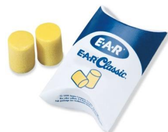
Slika 4. Zaštitne vate

Način uporabe: zaštitna vata pakirana je u određene kutije, iz koje se za jedno uho izvuče do 4 cm, otkine taj