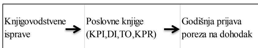
Tablica 7. Računovodstveni proces i poslovne knjige obrtnika

Izvor: Žager, K., Dečman, N., Računovodstvo malih i srednjih poduzeća , Hrvatska zajednica računovođa i financijskih djelatnika, Zagreb, 2015., str.301.