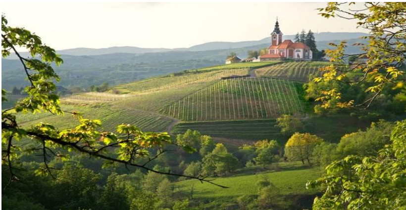
Slika 8. Ozaljsko – Vivodinska vinska cesta