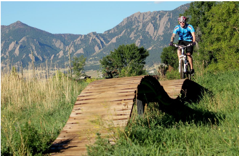
Slika 4. Bike park