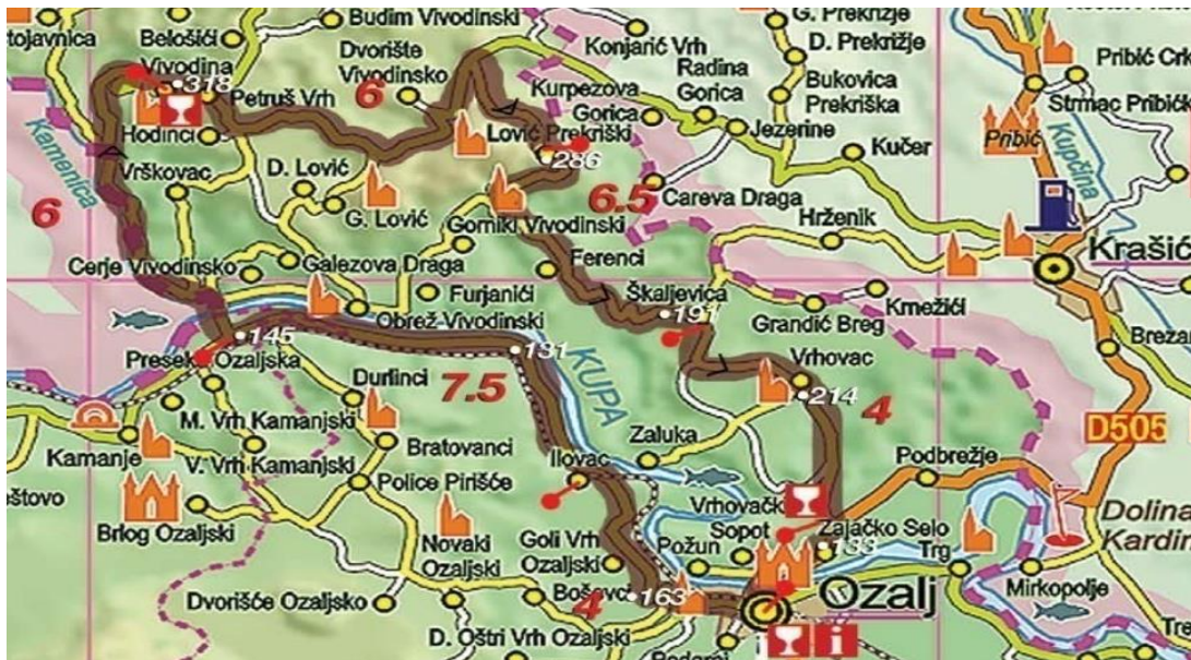
Slika 7. Biciklistička ruta Ozalj