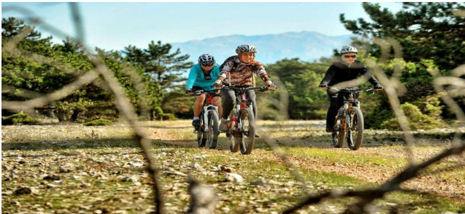
Slika 3. Cikloturisti