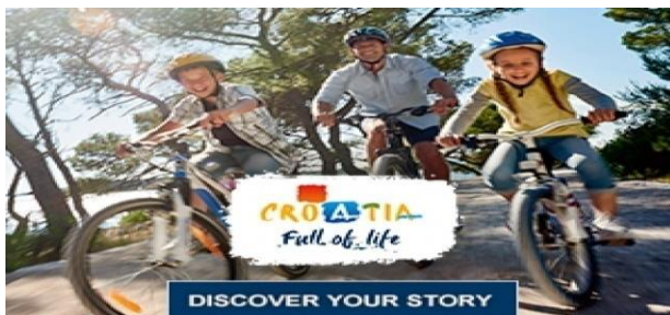
Slika 11. Promocija cikloturizma