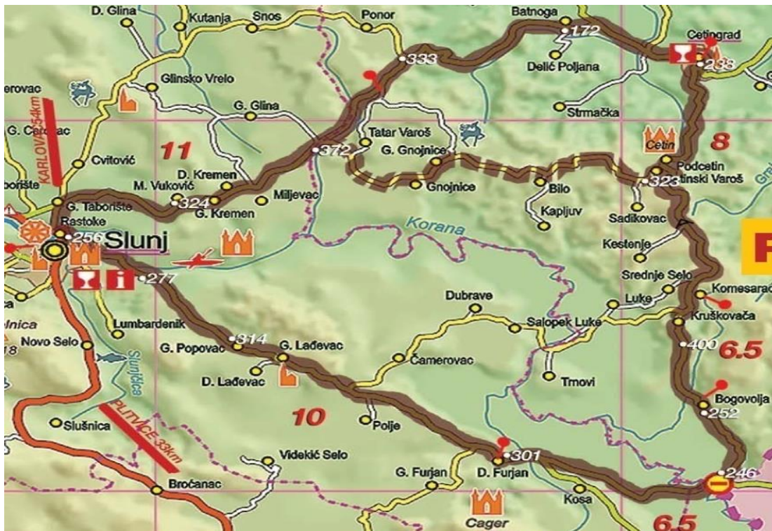
Slika 9. Biciklistička ruta Slunj