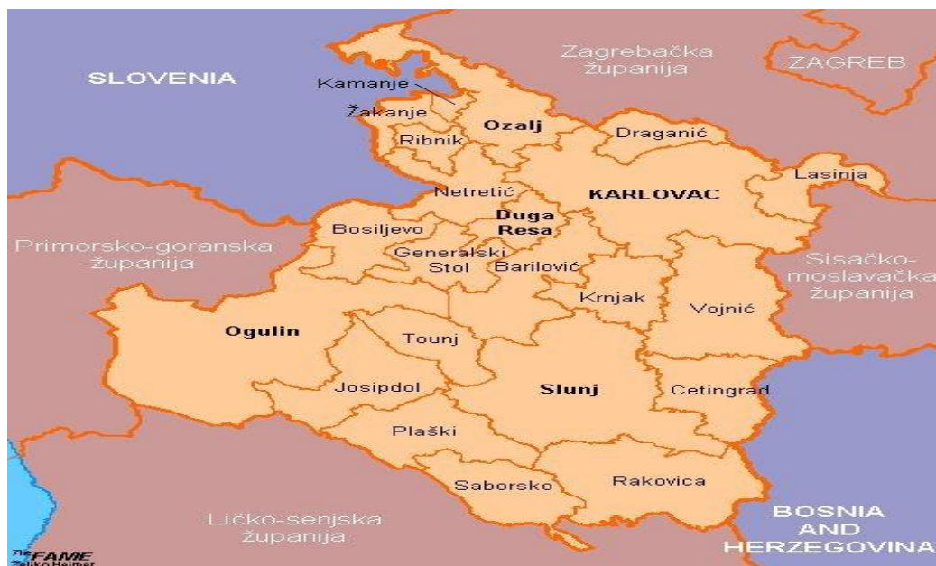
Slika1. Karlovačka županija