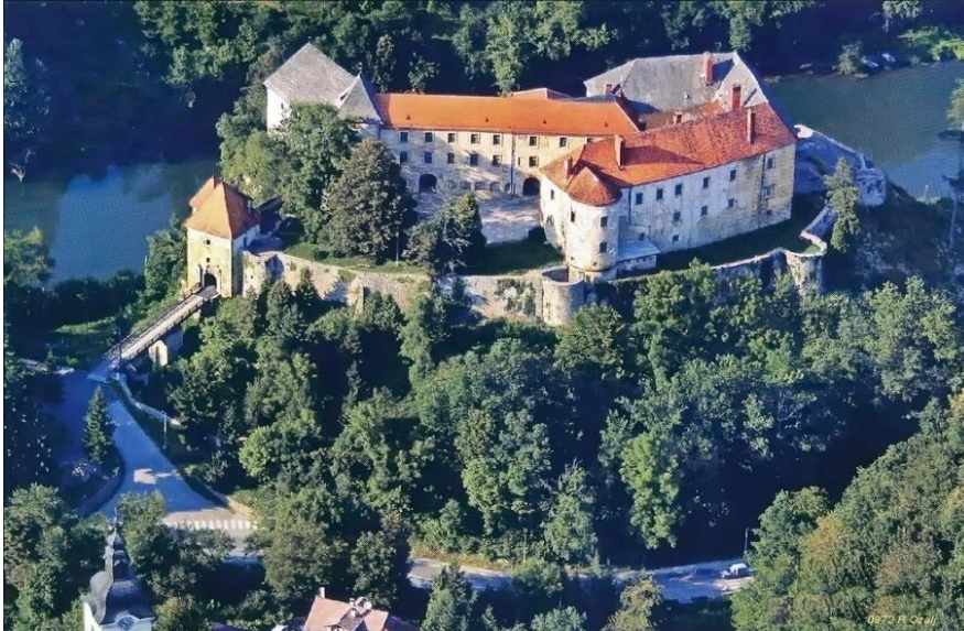
Slika 2. Stari grad Ozalj