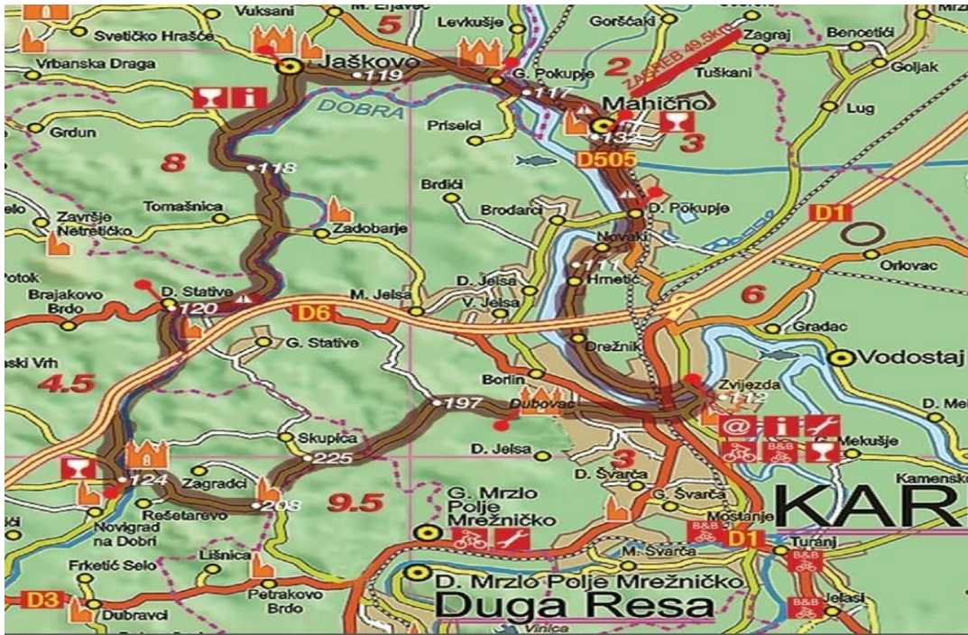
Slika 5. Biciklistička ruta Karlovac