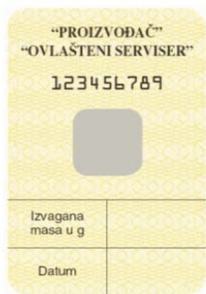
Slika 10. Naljepnica „masa bočice“ [10]

Kod aparata pod stalnim sa bočicom potrebno je provjeriti masu pogonskog plina u bočici vaganjem. Izvagana masa i datum pregleda upisuje se na samoljepljivu naljepnicu i lijepi se na bočicu (slika 10).