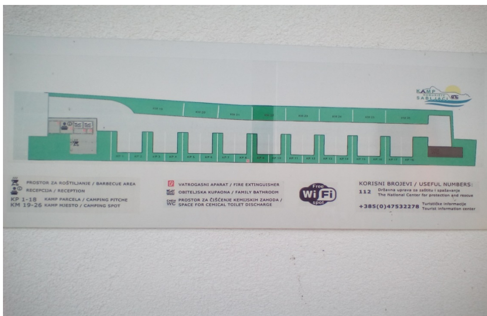
Slika 13. Plan kamp odmorišta sa označenim mjestima za vatrogasne aparate [14]

Prateća zgrada kamp odmorišta izvedena je kao klasična zidana konstrukcija na betonskim temeljima s drvenom konstrukcijom, tlocrtnih dimenzija 4,5 x 12,5 m. U njoj se nalazi recepcija, wc za osoblje, dvije obiteljske kupaonice, kuhinja, vešeraj te spremište.