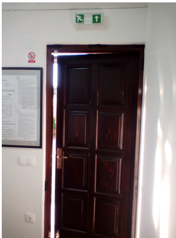
Slika 16. Označeni evakuacijski izlaz s postavljenom protupaničnom rasvjetom [14]

Za evakuacijski put iz prateće građevine primijenjen je Pravilnik o zaštiti od požara ugostiteljskih objekata (NN RH 100/99). Iz pratećeg objekta kamp odmorišta evakuacijski put je osiguran putem izlaznih vrata direktno na vanjski prostor, gdje „slijepi“ koridori izlaznih puteva ne prelaze 10 m. Svi putevi evakuacije i izlazi moraju biti propisno označeni, te uvijek čisti i prohodni. Na putevima evakuacije i evakuacijskim izlazima postavljene su oznake i protupanična rasvjeta, koja osigurava napuštanje građevine na siguran način (slika 16). Nestankom struje dolazi do automatskog paljenja protupanične rasvjete koja je opremljena vlastitom baterijom.