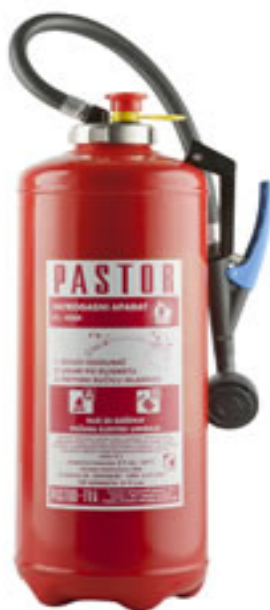
Slika 3: Vatrogasni aparat tvrtke „PASTOR“ na bazi vode; VR9 [8]

Vatrogasni aparati punjeni samo vodom su namijenjeni za gašenje početnih požara i krutih tvari (razred A) te se koriste za zaštitu od požara u drvnjoj, tekstilnoj i papirnoj industriji te skladištima. Aparati s vodom nisu namijenjeni za gašenje električnih uređaja pod naponom.