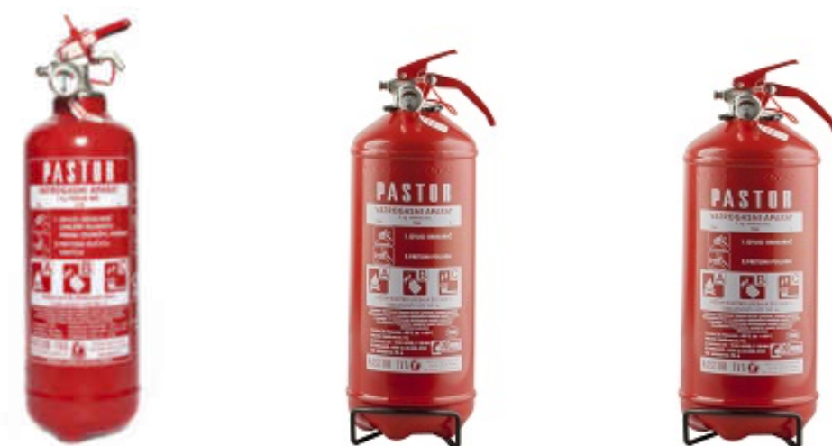
Slika 7: Vatrogasni aparati pod stalnim pritiskom tvrtke „PASTOR“: P1A, P2A i P3A