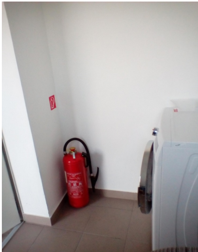
Slika 23. Vatrogasni aparat postavljen u praonici [14]