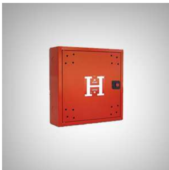
Slika 12. Ormarić unutarnje hidrantske mreže [13]

Zidni hidranti moraju biti izvedeni tako da omoguće sigurno i efikasno rukovanje i upotrebu (slika 12). Moraju biti smješteni u hidrantske ormariće zajedno s pripadajućom opremom. Zidni hidranti moraju biti obojeni u crvenom bojom na kojoj se nalazi oznaka iz koje je jasno vidljivo da se u ormariću nalazi oprema hidrantske mreže za gašenje požara.