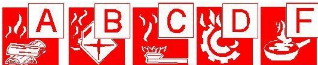
Slika 1: Piktogram razreda požara [1]

Hrvatska norma HRN EN 2 iz 2013. godine koja je usklađena sa europskom normom EN 2, razvrstava požare u skladu s prirodom gorive tvari. Takva podjela posebno je značajna radi primjene odgovarajućih aparata za gašenje požara. Požarni razredi određeni su slovnim oznakom (slika 1):