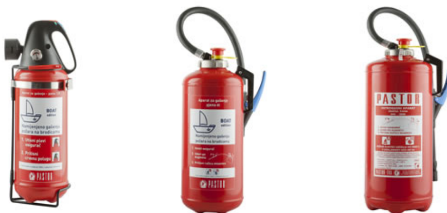
Slika 4: Vatrogasni aparati tvrtke „PASTOR“ koji koriste pjenu kao sredstvo za gašenje; Pz2E BOAT EDITION, Pz3E HOME EDITION, Pz9-F9 [8]

U spremniku aparata (koji je s unutarnje strane zaštićen od korozije) nalazi se mješavina vode i dodatka pod nazivom INILAM A. U plastičnoj bočici koja se nalazi na mjestu pobudne cijevi nalazi se pjenilo. Pod tlakom inertnog plina izbija se čep na dnu plastične bočice i dolazi do miješanja pjenila sa otopinom u spremniku aparata. Mješavina izlazi iz spremnika aparata i prolazi kroz specijalnu mlaznicu za pjenu u kojoj dolazi do miješanja sa zrakom i na taj način do stvaranja zračne pjene.