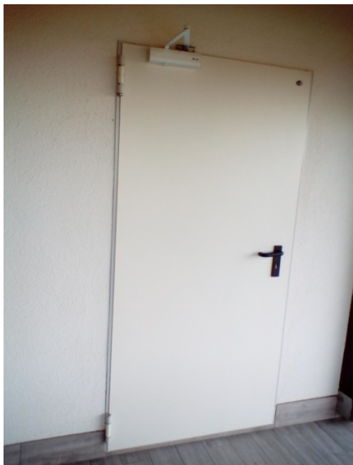
Slika 14. Protupožarna vrata s mehanizmom samozatvaranja na praonici [14]