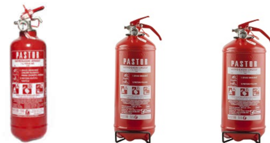
Slika 7: Vatrogasni aparati pod stalnim pritiskom tvrtke „PASTOR“: P1A, P2A i P3A