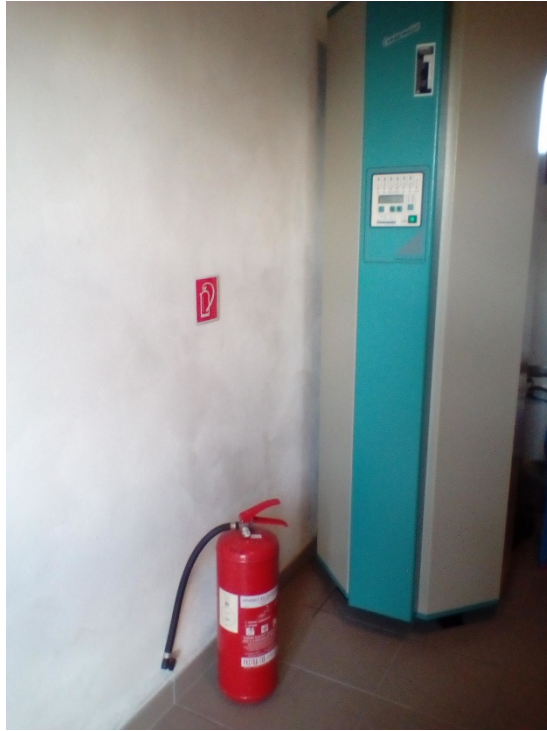
Slika 22. Vatrogasni aparat postavljen u spremištu gdje kojem se nalazi uređaj za solarnu energiju [14]