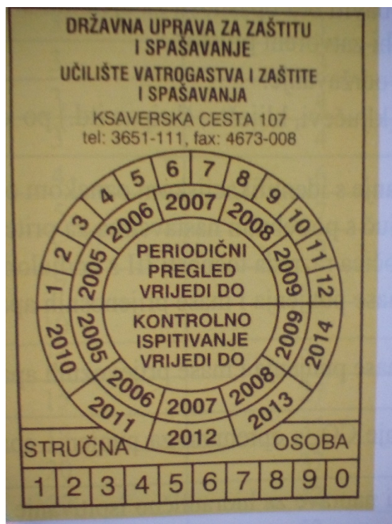
Slika 9. Naljepnica periodičkog pregleda [9]

Kod aparata pod stalnim sa bočicom potrebno je provjeriti masu pogonskog plina u bočici vaganjem. Izvagana masa i datum pregleda upisuje se na samoljepljivu naljepnicu i lijepi se na bočicu (slika 10).