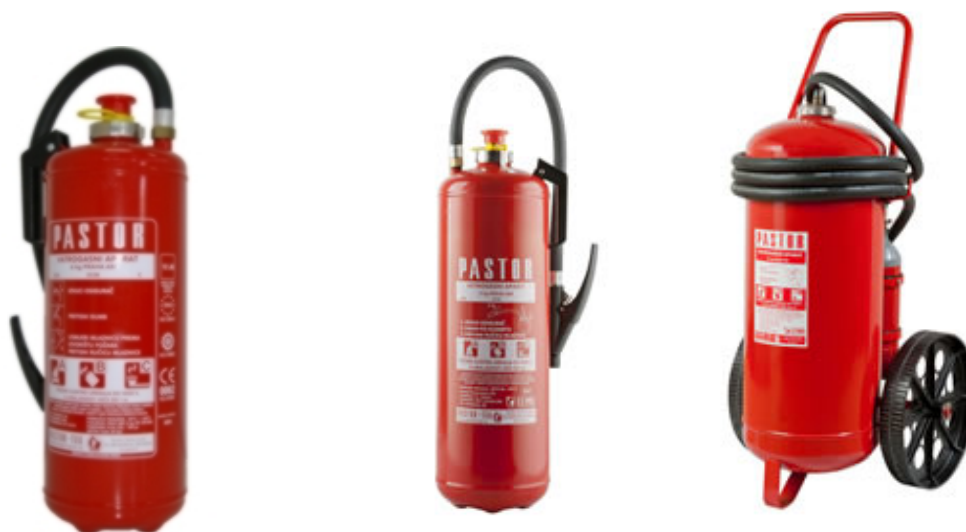
Slika 8: Vatrogasni aparati tvrtke „PASTOR“ koji koriste bočicu sa ugljičnim dioksidom; S6+, S9+, S50 [8]

Vatrogasni aparati (slika 8) koji kao pogonsko sredstvo koriste bočicu sa ugljičnim dioksidom.