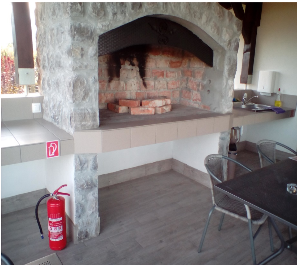
Slika 20. Vatrogasni aparat postavljen uz mjesto za roštilj [14]

Prijenosni roštilji ne smiju se koristiti u zatvorenim prostorima. Mjesta loženja vatre i mjesta predviđena za loženje roštilja ne smiju se nalaziti na udaljenosti manjoj od 3 m od šatora. Budući da je u kampu omogućeno loženje na mjestu za roštilj, izgrađeno je i mjesto za odlaganje pepela. Pepeo se smije odlagati samo na za to pripremljenom mjestu koje mora biti ukopano u zemlju ili na posebno pripremljeno odlagalište od negorivog materijala. Na udaljenosti manjoj od 10 m od odlagališta nalazi se hidrant za gašenje požara. Pepeo se nakon odlaganja polijeva vodom. Pored vanjskog roštilja, ispod nadstrešnice postavljen je jedan vatrogasni aparat sa 12 JG (slika 20).