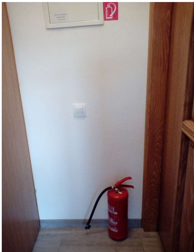
Slika 21. Vatrogasni aparat postavljen u pratećem objektu kamp odmorišta [14]

Kao što je prikazano u prethodnim tablicama vatrogasni aparati moraju biti postavljeni u pratećoj zgradi (slika 21), (slika 22) i u praonici (slika 23).