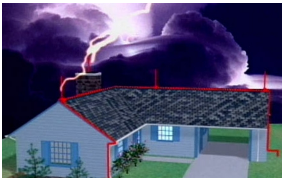
Slika 2. Udar groma u građevinu na kojoj je instalirana gromobranska zaštita [6]

Kao važan uzrok nastanka požara treba spomenuti grom kod kojeg se, uslijed velikih jakosti struje koje nastaju pri pražnjenju, mogu javiti visoke temperature, a time i požar na materijalu blizu udara groma. Postavljeni gromobrani stvaraju jako električno polje koje privlači atmosferski naboj. Na taj način gromobranske instalacije štite zgradu, a elektricitet prolazi nakon udara groma u gromobran metalnom trakom u zemlju (slika 2). Izvedba gromobrana mora garantirati atmosfersko pražnjenje bez štetnih posljedica. Hvataljke trebaju biti postavljene na onim mjestima gdje je najveća vjerojatnost udara groma. Krovni vodovi trebaju stvarati zatvoren kavez sa što više odvoda.