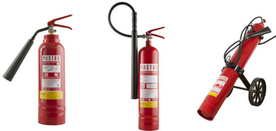
Slika 5: Vatrogasni aparati tvrtke „PASTOR“ koji koriste CO 2 kao sredstvo za gašenje; CO-3, CO2-5, CO2-30 [8]