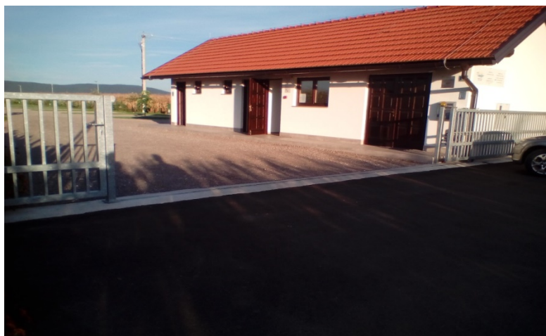
Slika 15. Vatrogasni prilaz kamp odmorištu Sabljaci [14]

Pristup do prateće zgrade kampa i površina za rad vatrogasnih vozila u kamp odmorištu osigurana je s jedne strane (slika 15). Vatrogasni pristup za mjesta gdje su smještene kamp kućice ili druga vozila nije osiguran jer se radi o vozilima, a udaljenost vatrogasnog prilaza s kojeg je moguće obaviti vatrogasnu intervenciju slobodnom površinom bez vozila do posljednjeg mjesta za kamp kućicu nije veća od 100 m.