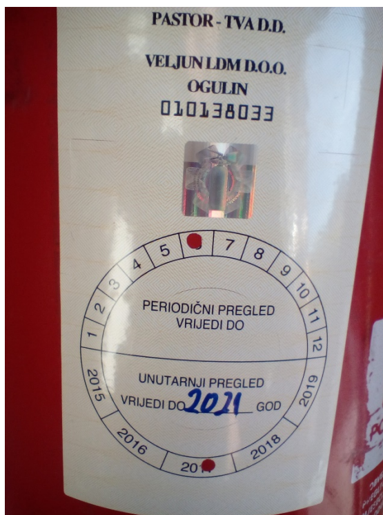
Slika 24. Naljepnica na vatrogasnom aparatu u kamp odmorištu Sabljaci o obavljenom pregledu [14]

Vatrogasni aparati u ovom objektu propisno su označeni i servisirani (slika 24).