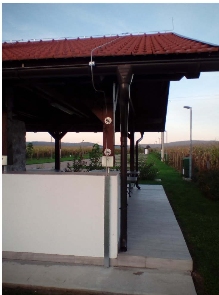
Slika 17. Ugrađena gromobranska zaštita na pratećoj zgradi kamp odmorišta [14]

Najbolje zaštita od groma, a time i od požara su gromobranske instalacije. U kamp odmorištu izveden je sustav zaštite od djelovanja munje, tj. formiran je Faradayev kavez sastavljen od hvataljki, spusteva i temeljnog uzemljivača (slika 17).