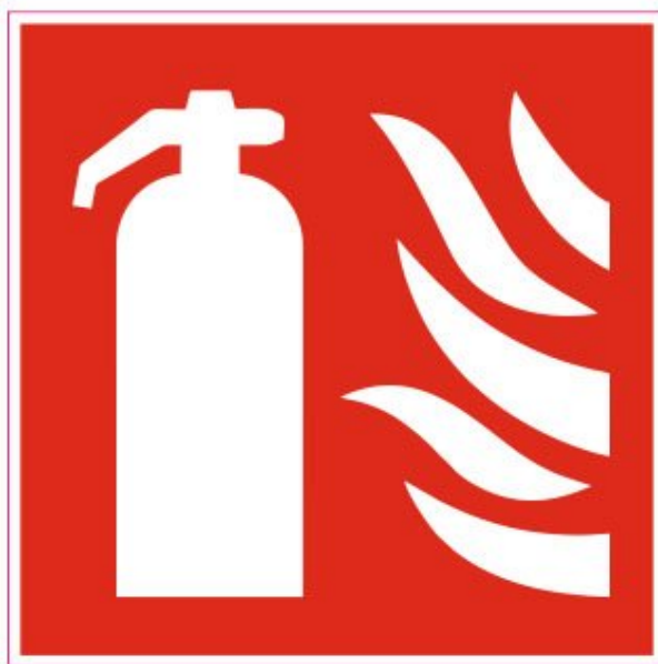
Slika 18. Naljepnica za mjesto vatrogasnog aparata [14]

U prostorijama čija je površina veća od 50 m 2 , mjesto postavljanja vatrogasnog aparata označeno je naljepnicom (slika 18). Naljepnica je pretežito obojana crvenom bojom RAL 3000, i postavljena je tako da njezinu uočljivost ne ometa sadržaj prostora.