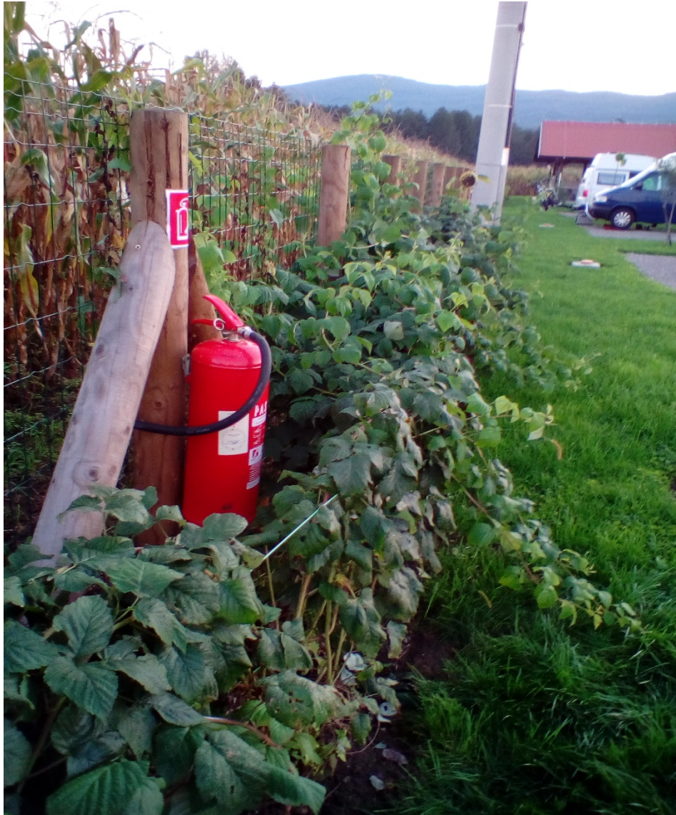
Slika 19: Vatrogasni aparat sa prahom postavljen za zaštitu sadržaja kamp prikolica [14]

Otvorena vatra smije se ložiti samo na mjestima u kampu koja su posebno pripremljena i označena za tu namjenu.