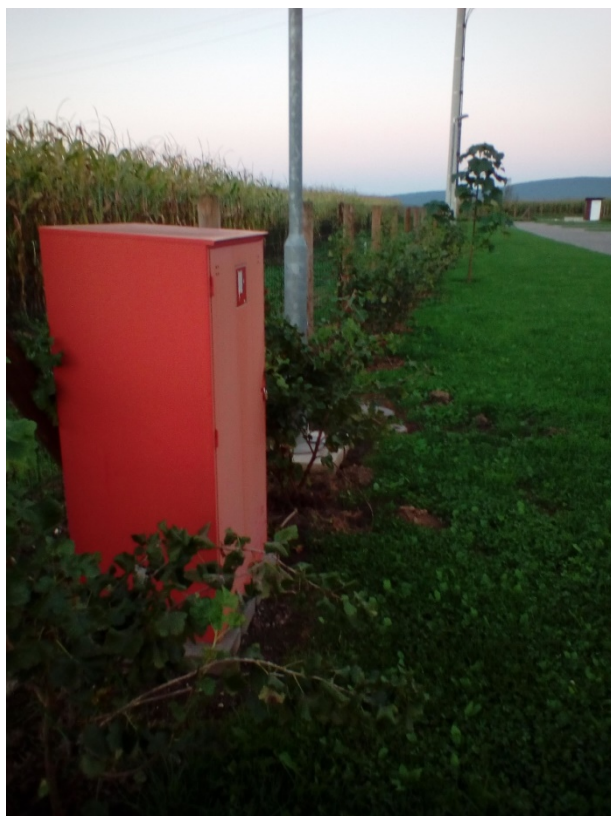
Slika 25. Vanjski hidrant u kamp odmorištu [14]

U kamp odmorištu, u vanjskom dijelu, izvedena je vanjska hidrantska mreža. Hidranti su izvedeni tako da je omogućeno sigurno i efikasno rukovanje i upotreba. Uz prateću zgradu kampa postavljen je ormarić sa kompletnom opremom za vanjske hidrante za neposredno gašenje požara (slika 25). Prostor oko hidranta mora biti uvijek slobodan i očišćen, kako bi hidrant uvijek bio dostupan.