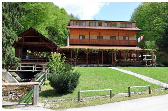
Slika 1. Lovački dom Muljava