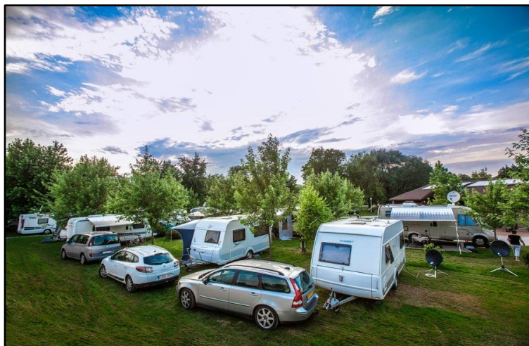
Slika 3. Kamp Slapić