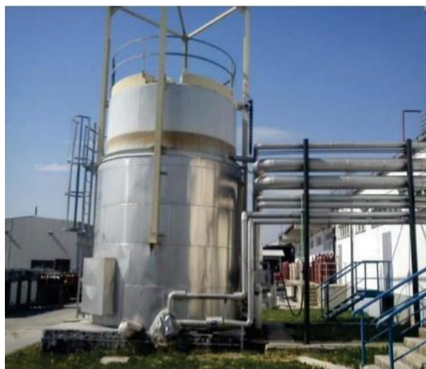
Slika 6 – Gazometar

Upravljanje razvijaaem odvija se preko 5 induktivnih rasklopnih kontakata na zvonu gazometra.