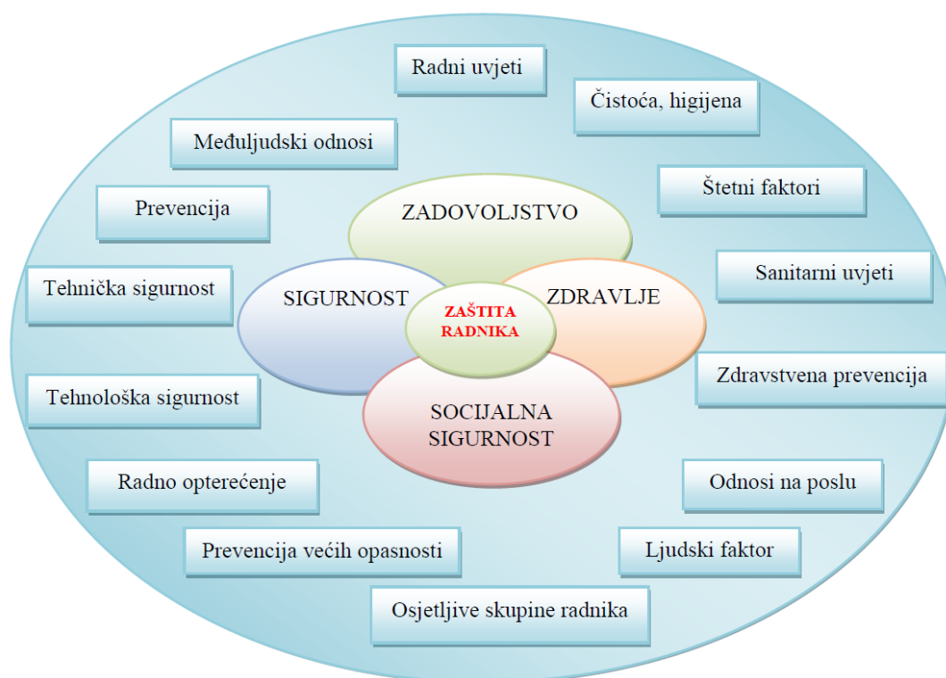
Slika 2. Aspekti rada koji utječu na zaštitu radnika

Sigurnost i zaštita zdravlja na radu moraju se osigurati uzimajući u obzir sve postojeće okolnosti vezane uz rad, tj. uzimajući u obzir ne samo sprečavanje nesreća, uklanjanje opasnih tvari i čimbenika, sigurnost tehničke opreme i procesa, već također i situacije koje dovode do prekomjernog fizičkog, umnog i osjetilnog opterećenja ili stresa. Također je potrebno imati na umu, ljudski faktor, psihosocijalne aspekte, stres i nasilje na radnom mjestu. Sve što je nepoželjno na radnome mjestu treba smatrati rizikom. Zaštita radnika mora se uz sigurnost i zdravlje usredotočiti također i na njihovo zadovoljstvo i socijalnu sigurnost (Slika 2). 4