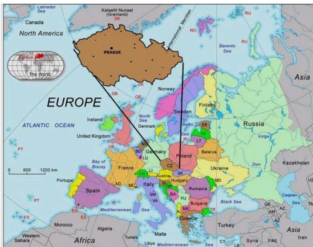
Slika 3. Karta Europe