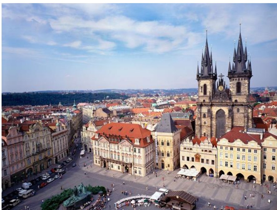
Slika 5. Starogradski trg