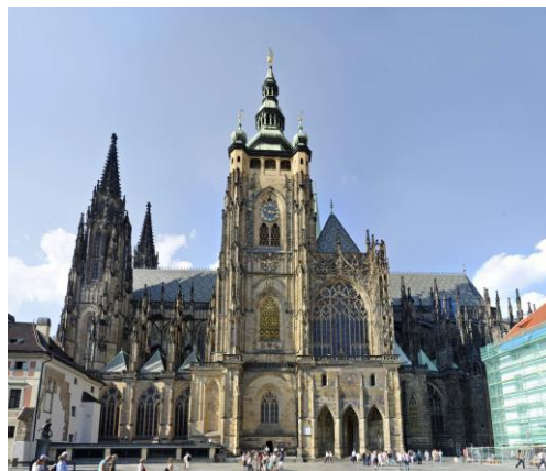
Slika 9. Katedrala Sv. Vida

Među nezaobilazne znamenitosti Praga spada “Katedrala sv.Vida”.