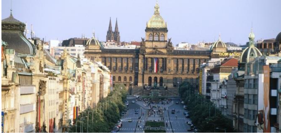
Slika 8. Vaclavski trg