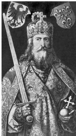
Slika 4. Karlo IV