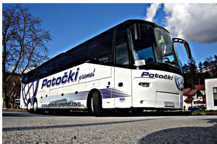
Slika 2. Prijevoz turističke agencije Potočki travel