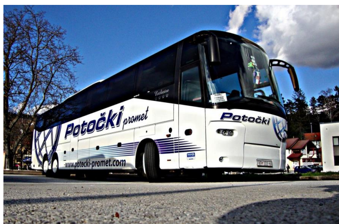
Slika 2. Prijevoz turističke agencije Potočki travel