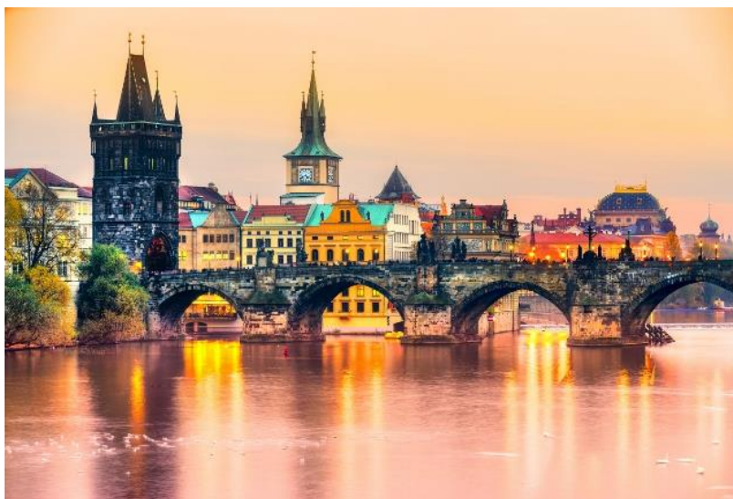
Slika 6. Karlov most