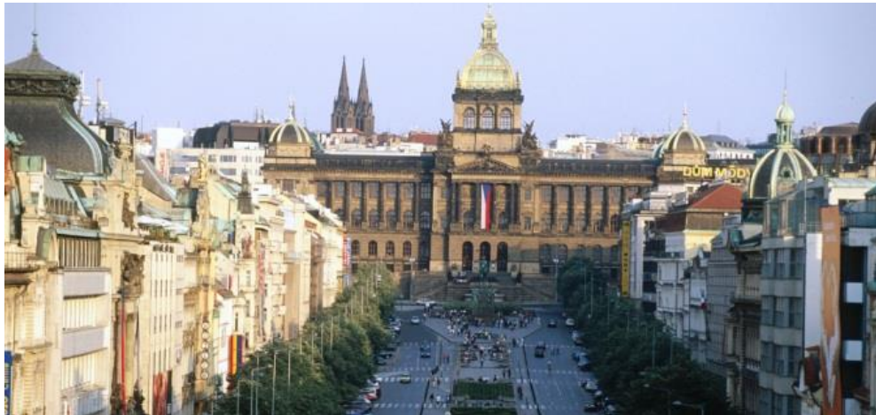
Slika 8. Vaclavski trg