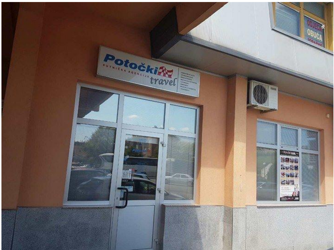
Slika 1. Poslovnica turističke agencije Potočki travel